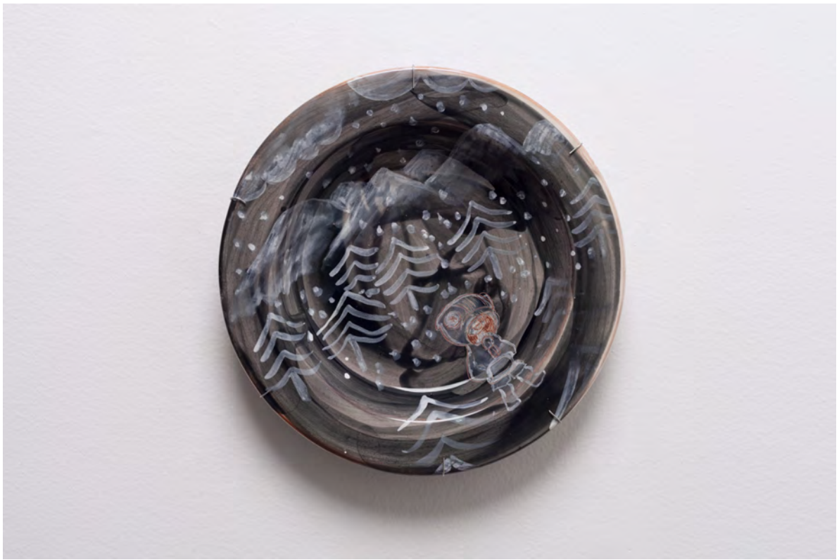
Marianna Papageorgiou Snow II, 2022 [MPRA31] Wheel thrown, hand painted ceramic plate 30 cm (diam.)