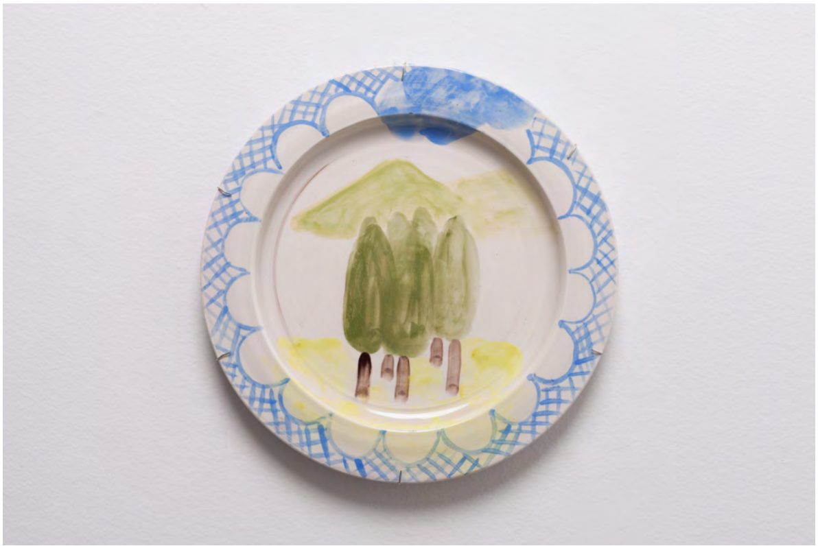
Marianna Papageorgiou Four Trees, 2022 [MPRA13] Wheel thrown, hand painted ceramic plate 30 cm (diam.)