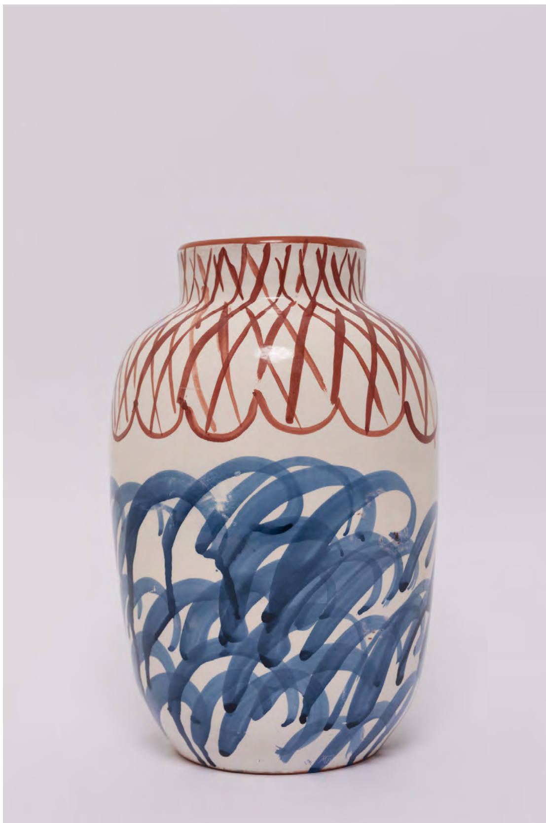
Marianna Papageorgiou Waves II, 2022 [MPVRA05] Wheel thrown, hand painted ceramic vase H 23 X W 20 cm