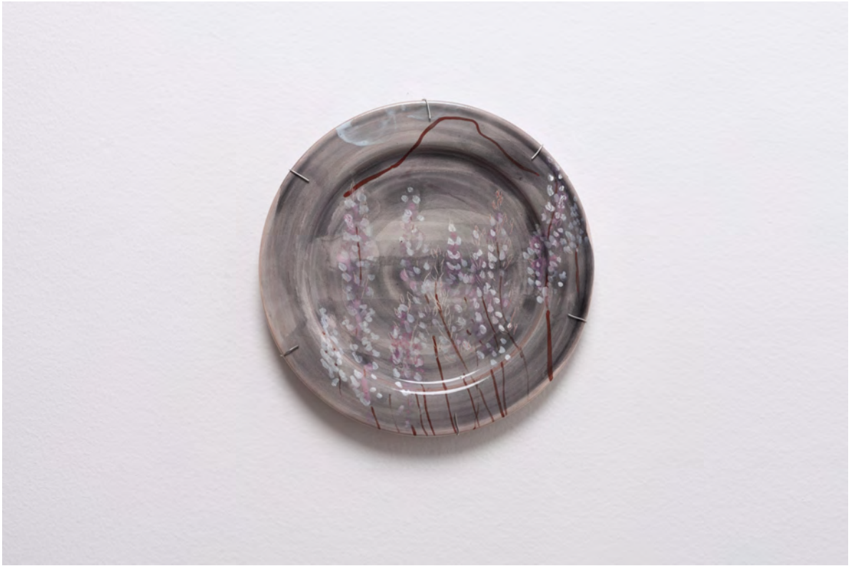
Marianna Papageorgiou Asphodel, 2022 [MPRA25] Wheel thrown, hand painted ceramic plate 20 cm (diam.)