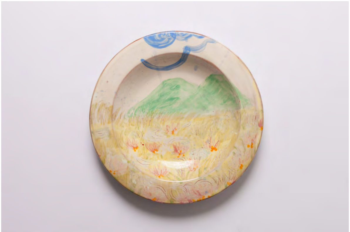
Marianna Papageorgiou Landscape V, 2022 [MPRA38] Wheel thrown, hand painted ceramic plate 29 cm (diam.)