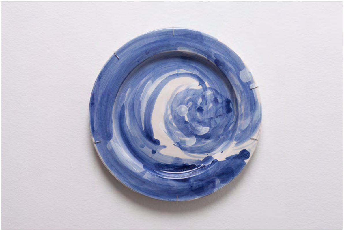
Marianna Papageorgiou Surf wave I, 2022 [MPRA11] Wheel thrown, hand painted ceramic plate 30 cm (diam.)