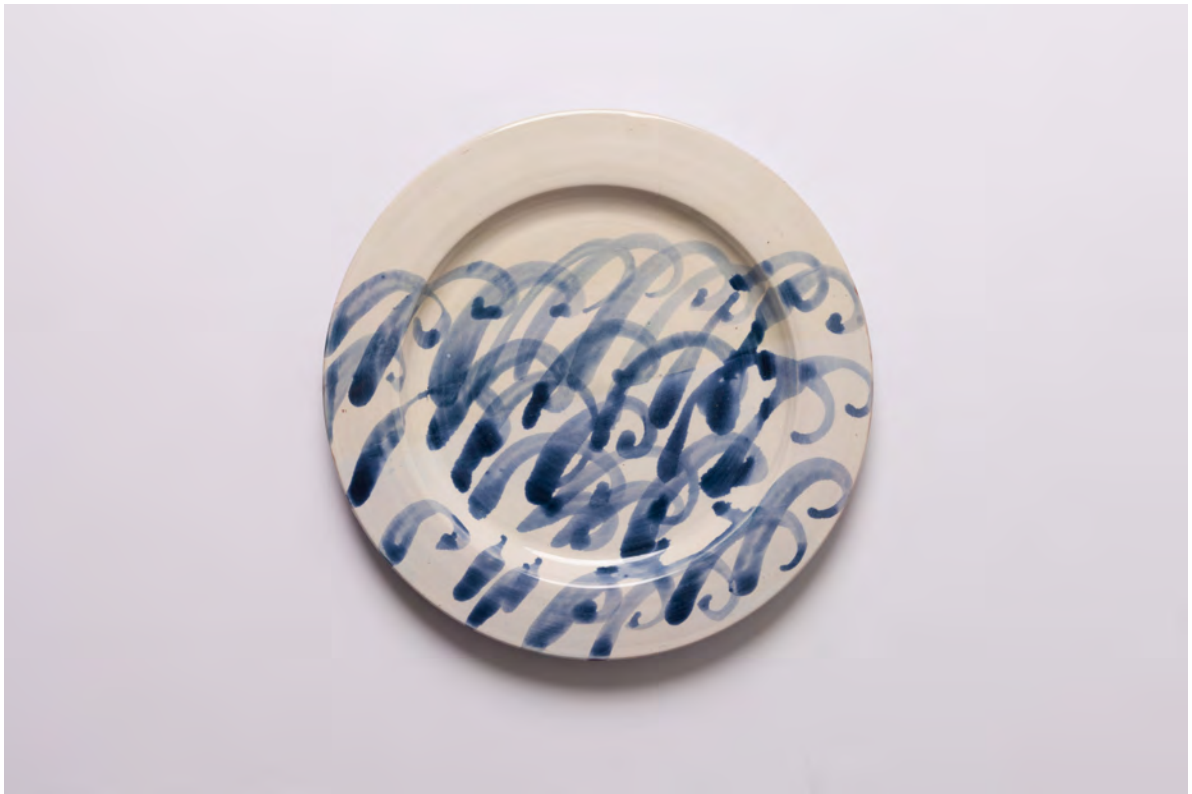
Marianna Papageorgiou Waves III, 2022 [MPRA35] Wheel thrown, hand painted ceramic plate 27 cm (diam.)