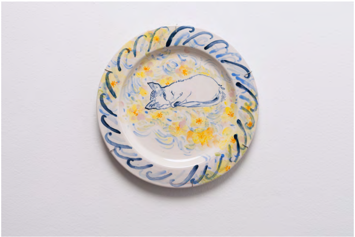
Marianna Papageorgiou Sleeping Cat, 2022 [MPRA19] Wheel thrown, hand painted ceramic plate 27 cm (diam.)