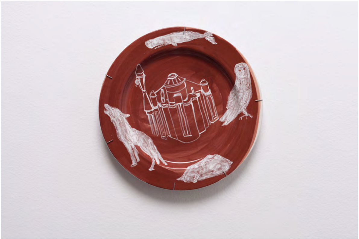
Marianna Papageorgiou Jet Pack, 2022 [MPRA29] Wheel thrown, hand painted ceramic plate 27 cm (diam.)