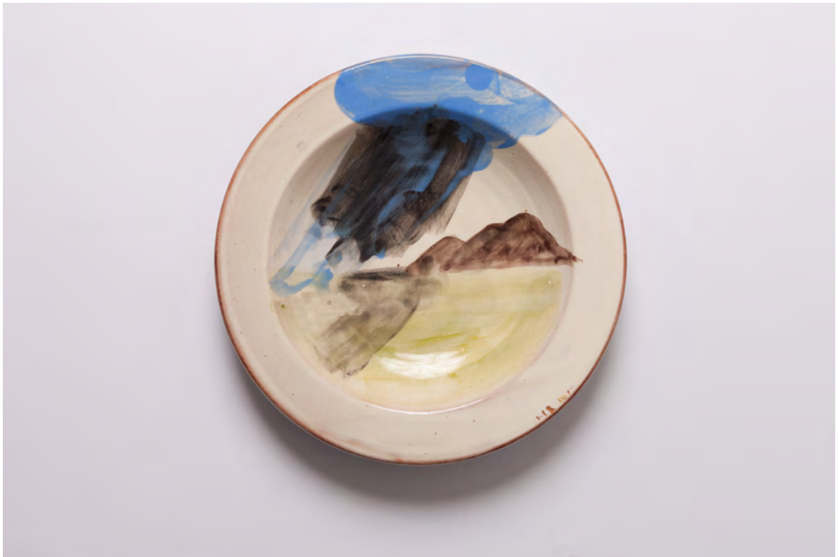
Marianna Papageorgiou Shadow, 2022 [MPRA36] Wheel thrown, hand painted ceramic plate 30 cm (diam.)