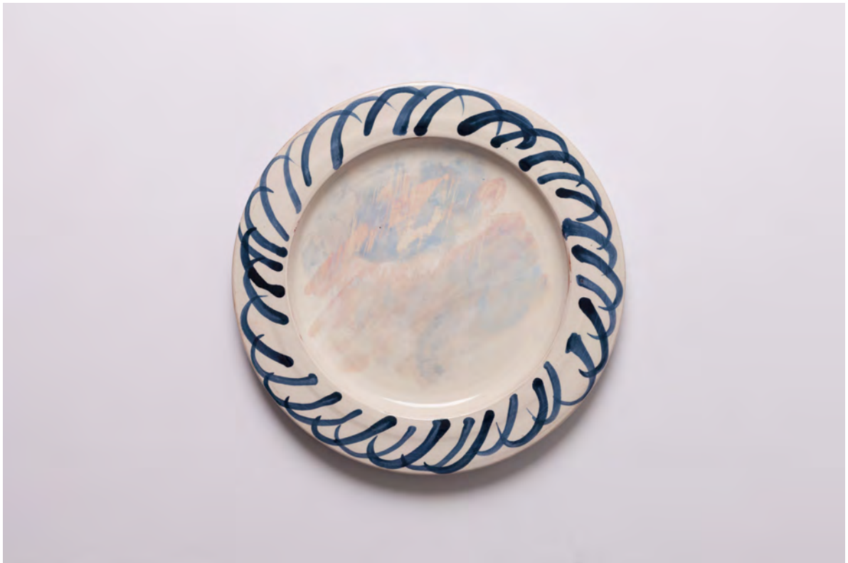
Marianna Papageorgiou Pink Cloud, 2022 [MPRA32] Wheel thrown, hand painted ceramic plate 27 cm (diam.)