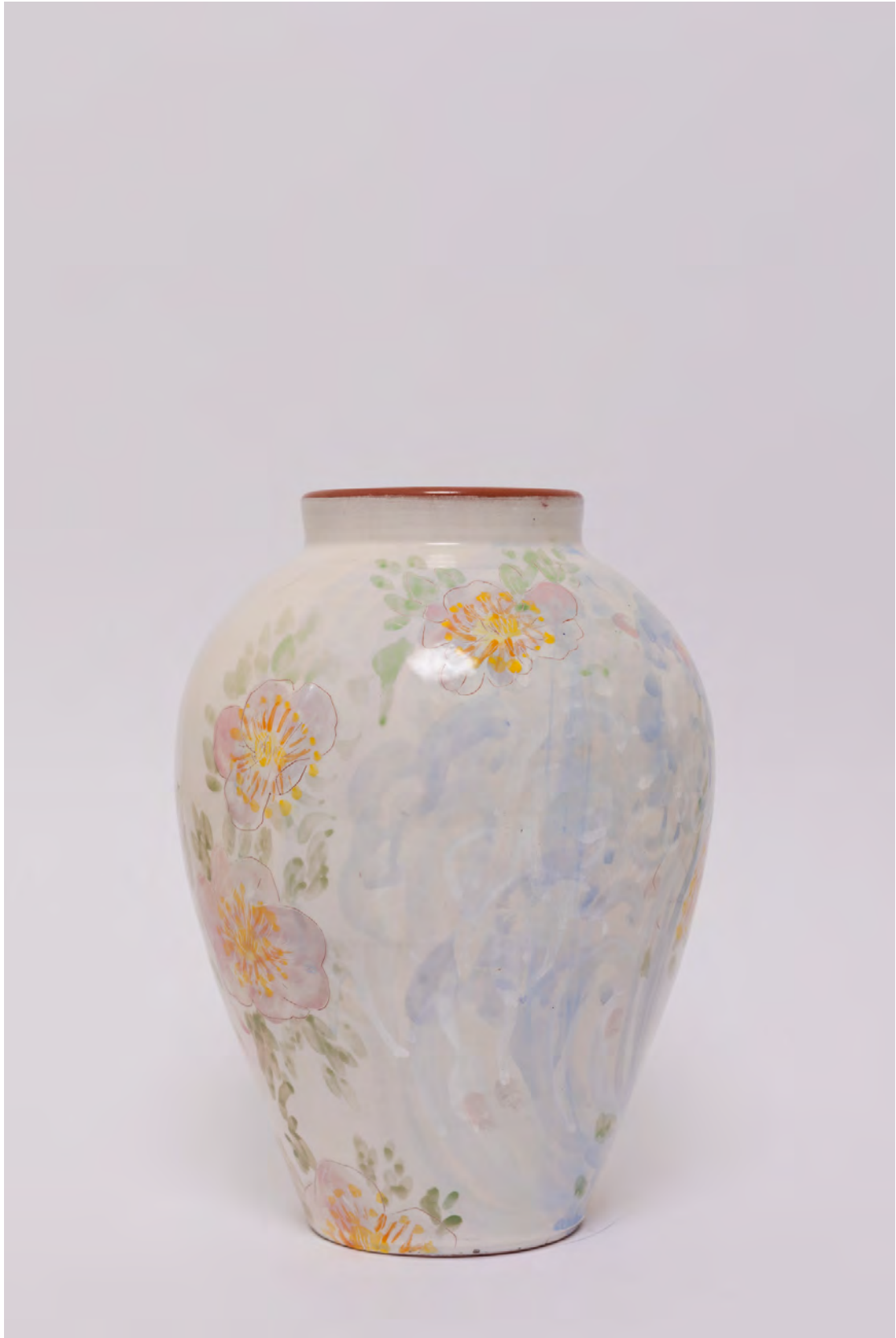
Marianna Papageorgiou Flower Surf, 2022 [MPVRA11] Wheel thrown, hand painted ceramic vase H 28 X W 19 cm