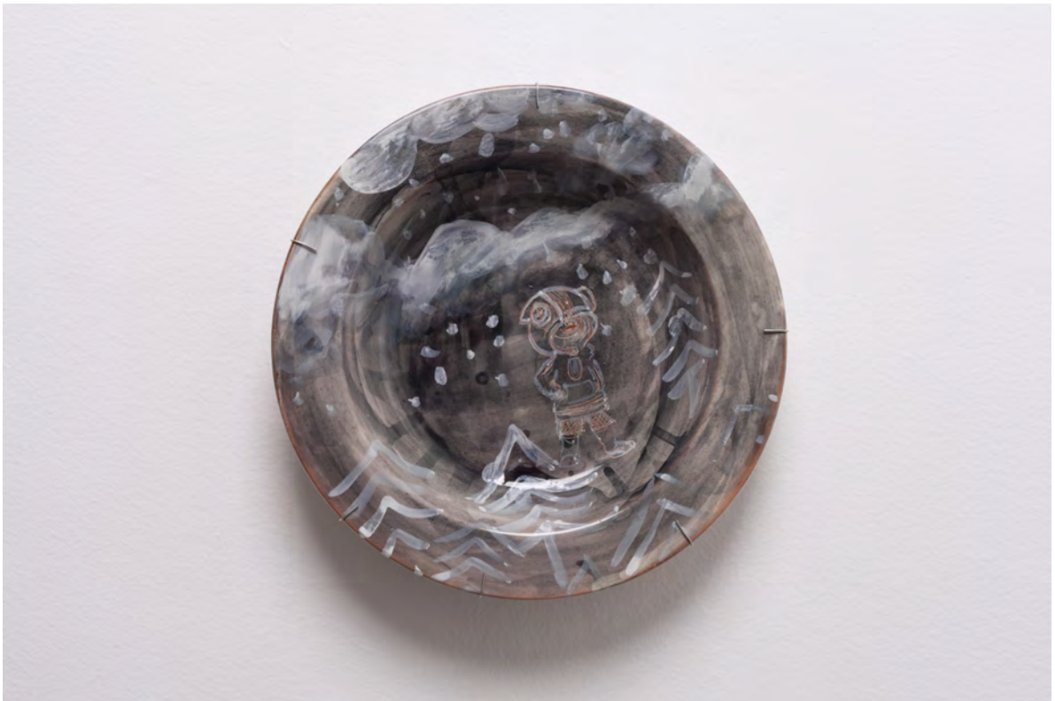
Marianna Papageorgiou Snow I, 2022 [MPRA30] Wheel thrown, hand painted ceramic plate 30 cm (diam.)