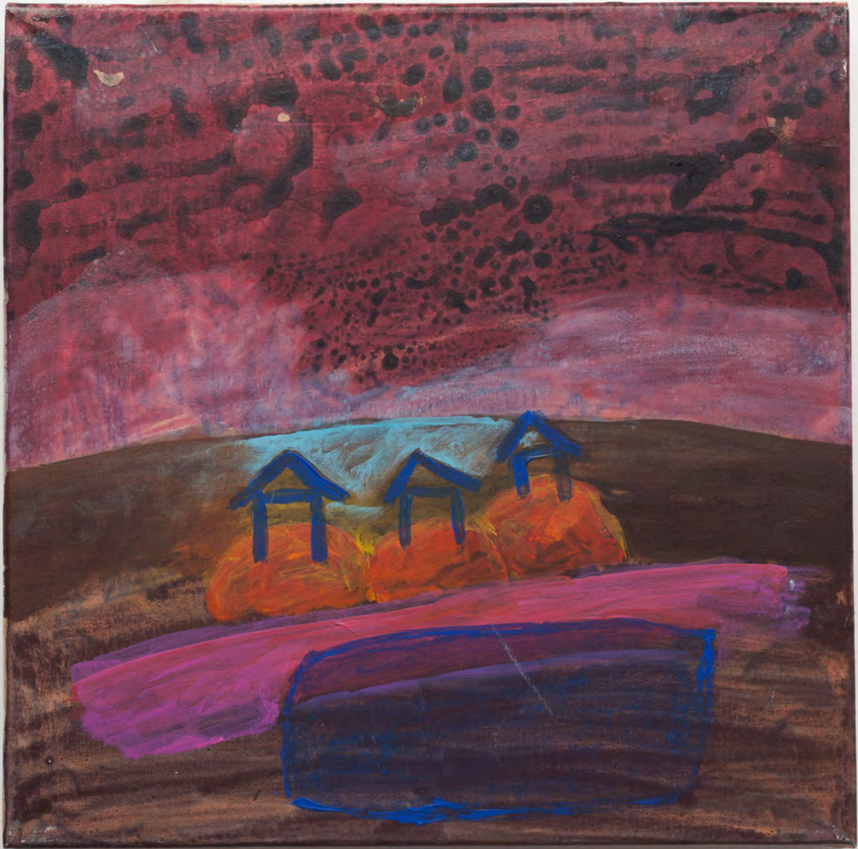
Marianna Papageorgiou Mountains, 2019 [MPPRA09] acrylic on canvas 30 x 30 cm