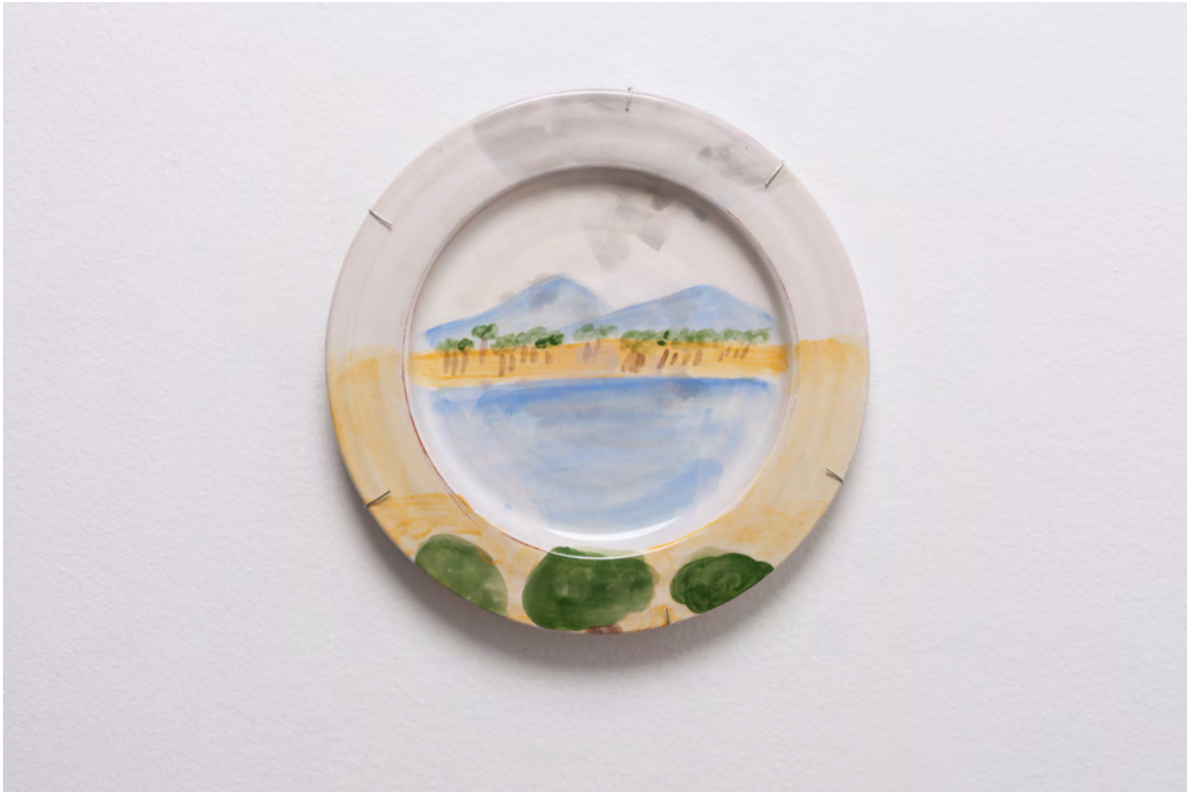
Marianna Papageorgiou Despotiko III, 2022 [MPRA17] Wheel thrown, hand painted ceramic plate 28 cm (diam.)