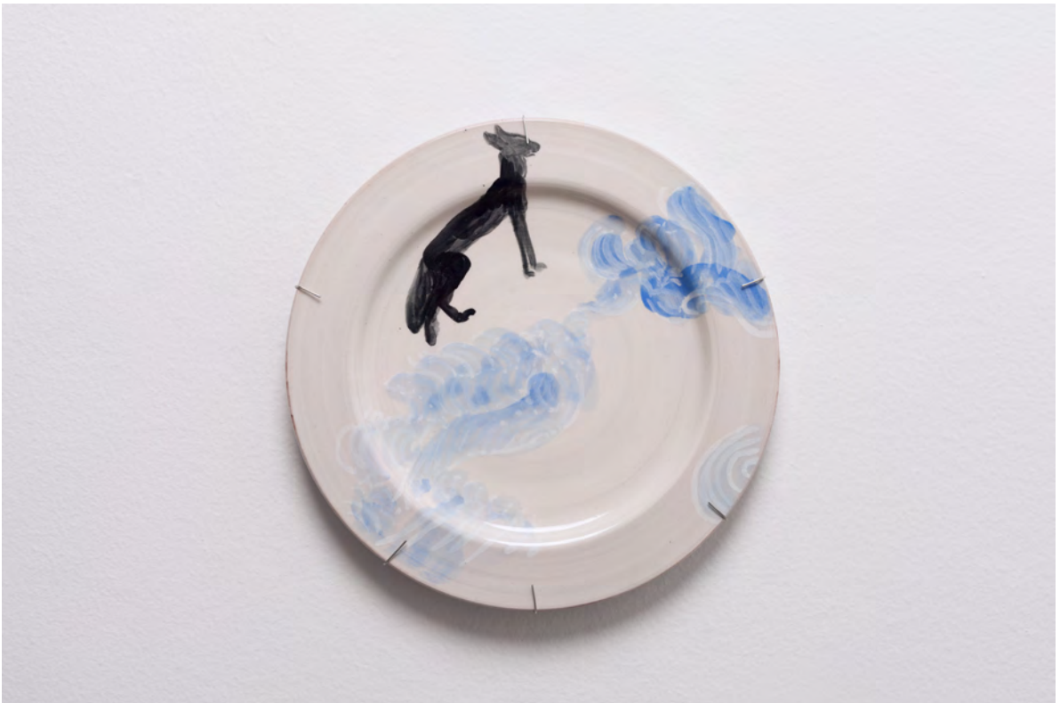
Marianna Papageorgiou Fox, 2022 [MPRA06] Wheel thrown, hand painted ceramic plate 27 cm (diam.)