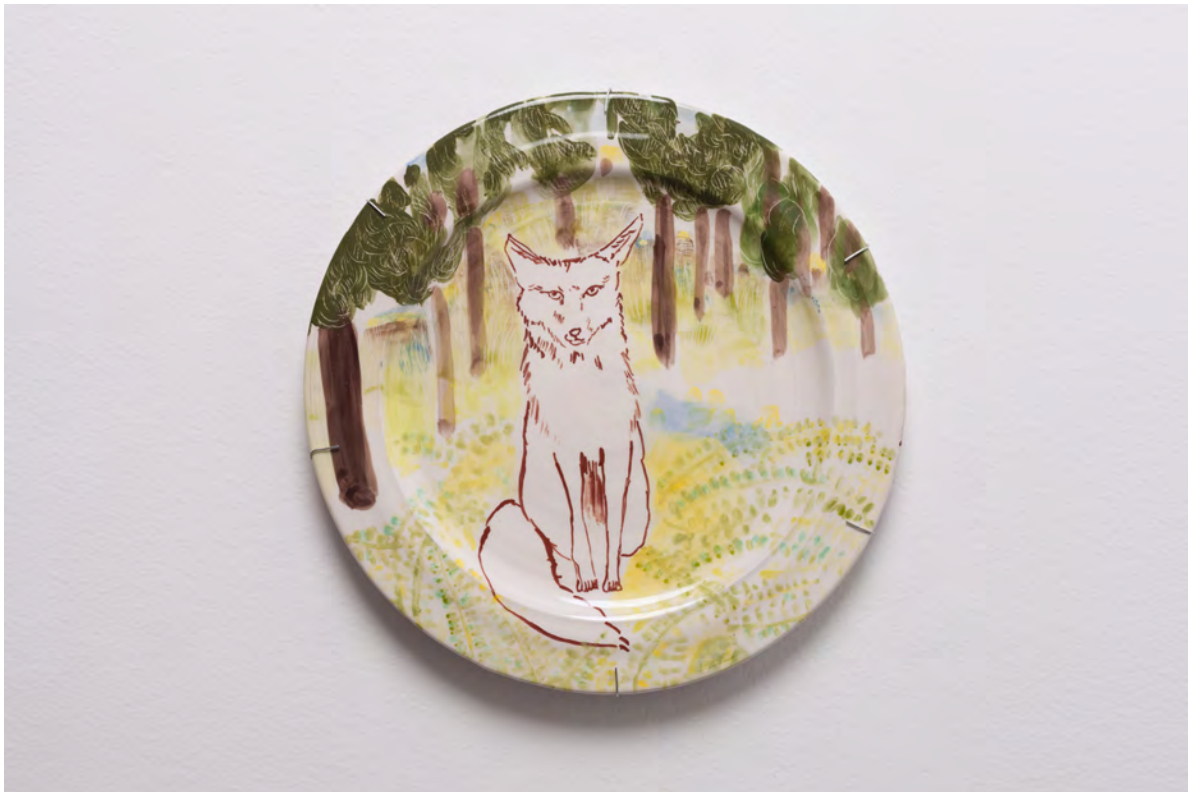
Marianna Papageorgiou Watching Fox I, 2022 [MPRA12] Wheel thrown, hand painted ceramic plate 30 cm (diam.)