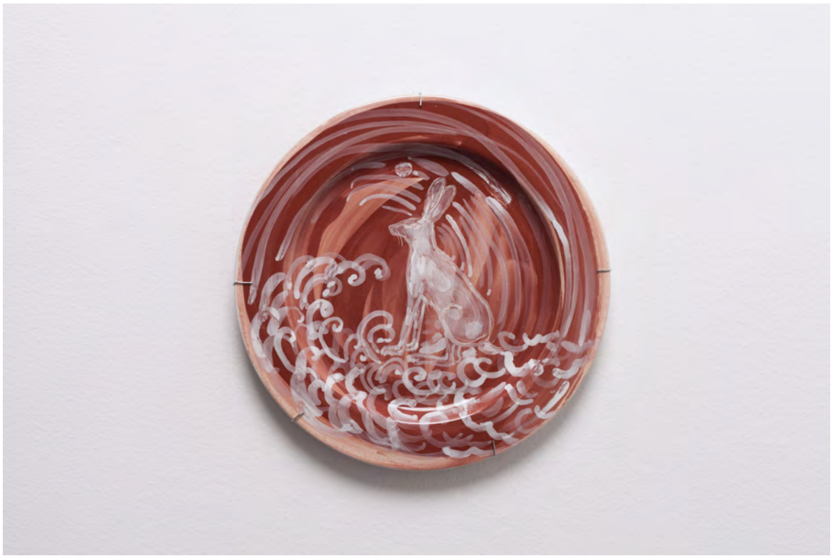
Marianna Papageorgiou Rabbit II, 2022 [MPRA23] Wheel thrown, hand painted ceramic plate 27 cm (diam.)