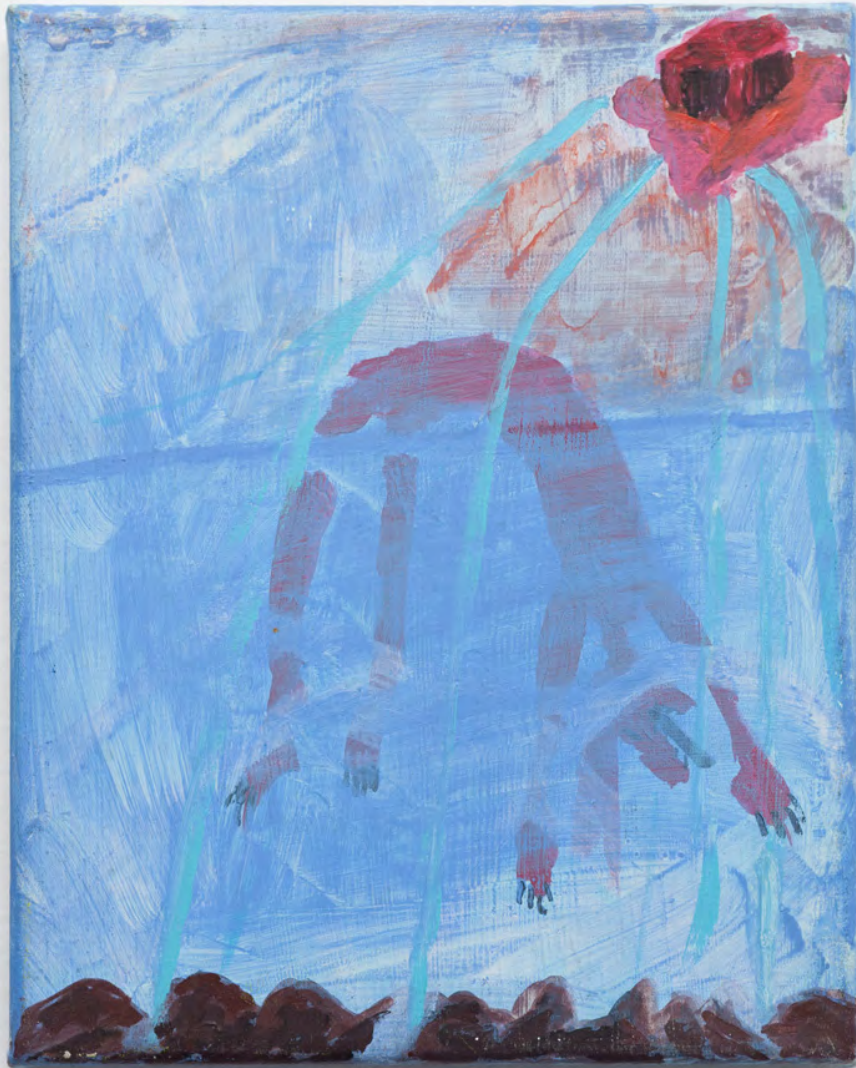
Marianna Papageorgiou Sleep II, 2019 [MPPRA05] acrylic on canvas 25 x 20 cm