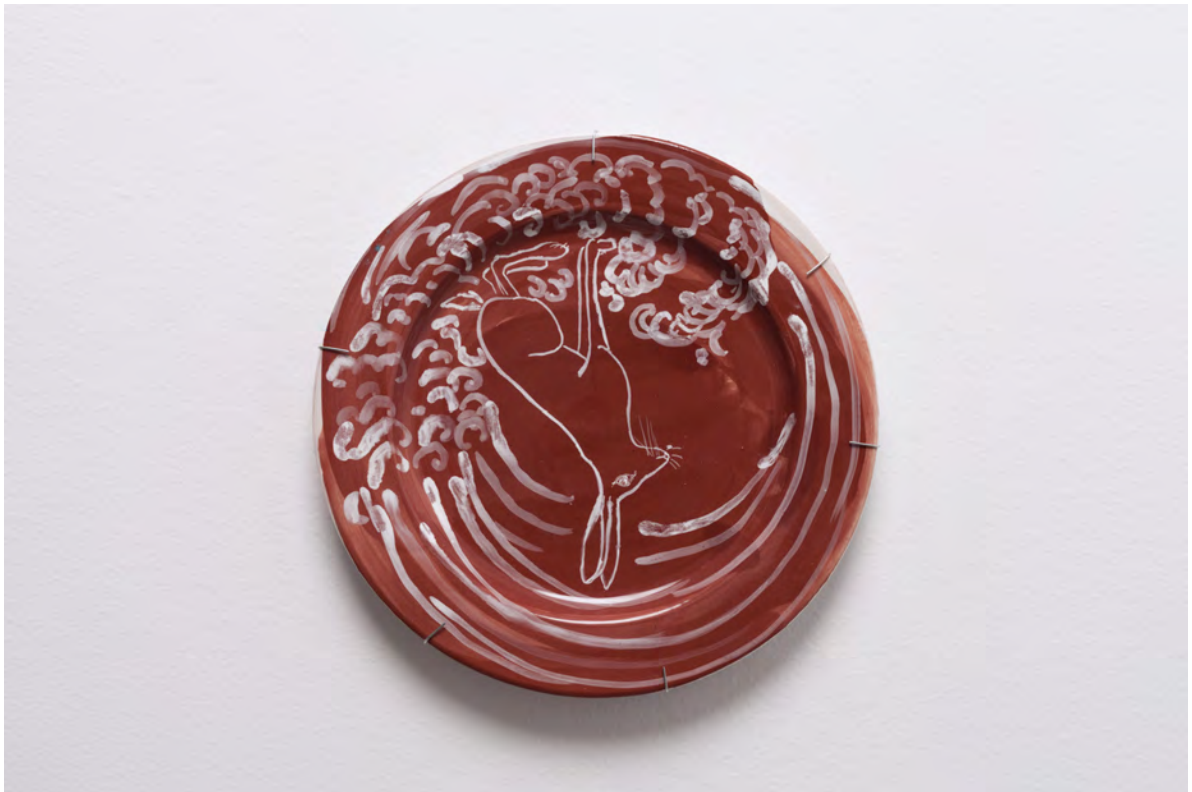
Marianna Papageorgiou Rabbit I, 2022 [MPRA08] Wheel thrown, hand painted ceramic plate 27 cm (diam.)