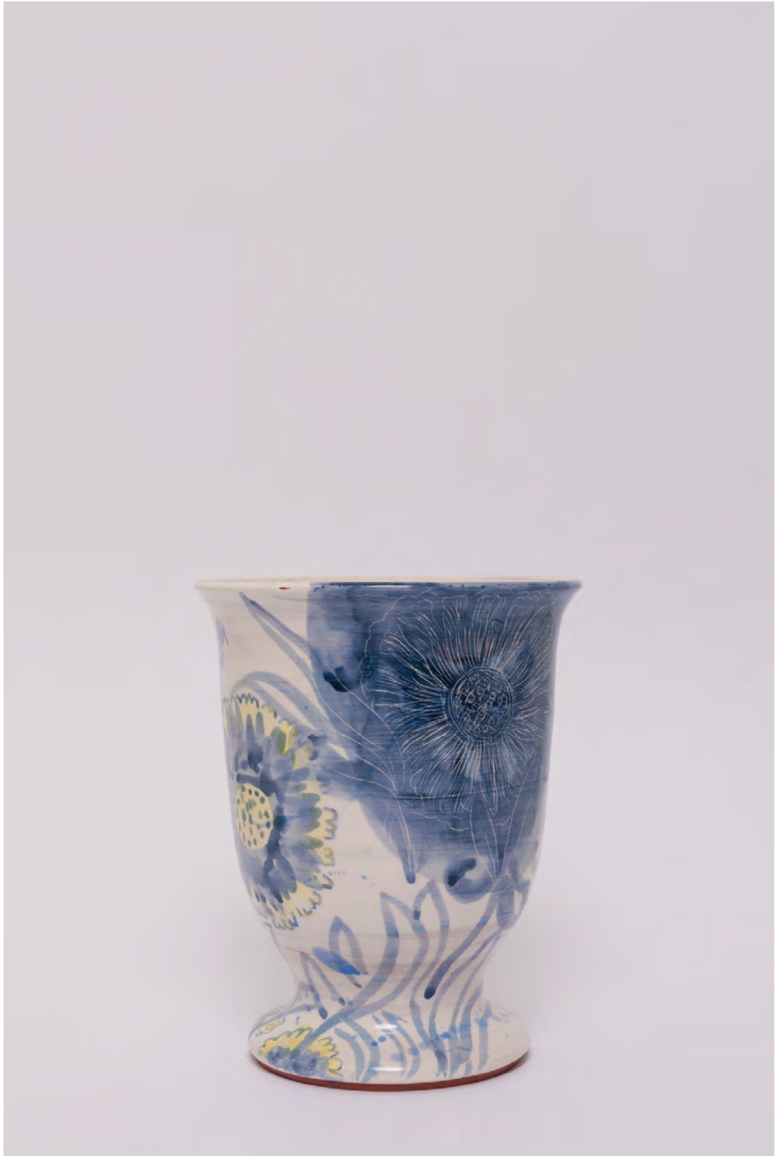
Marianna Papageorgiou Flowers, 2022 [MPVRA12] Wheel thrown, hand painted ceramic vase H 21 X W 14 cm