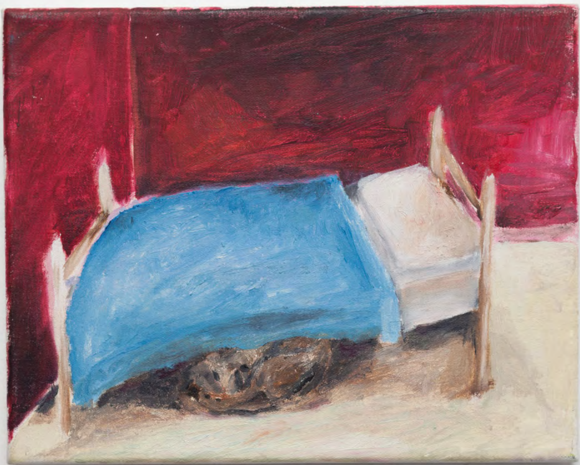
Marianna Papageorgiou Caledonia, 2019 [MPPRA04] oil on canvas 20 x 25 cm