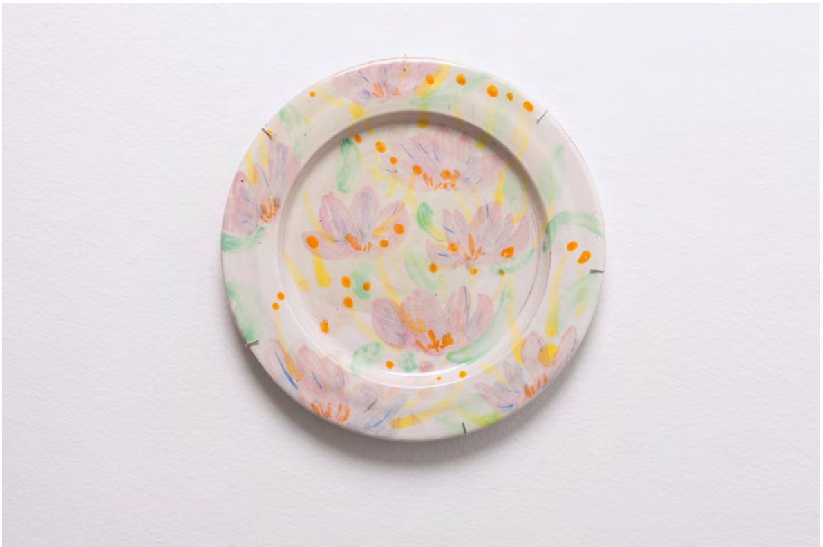
Marianna Papageorgiou Pink Flowers, 2022 [MPRA18] Wheel thrown, hand painted ceramic plate 28 cm (diam.)