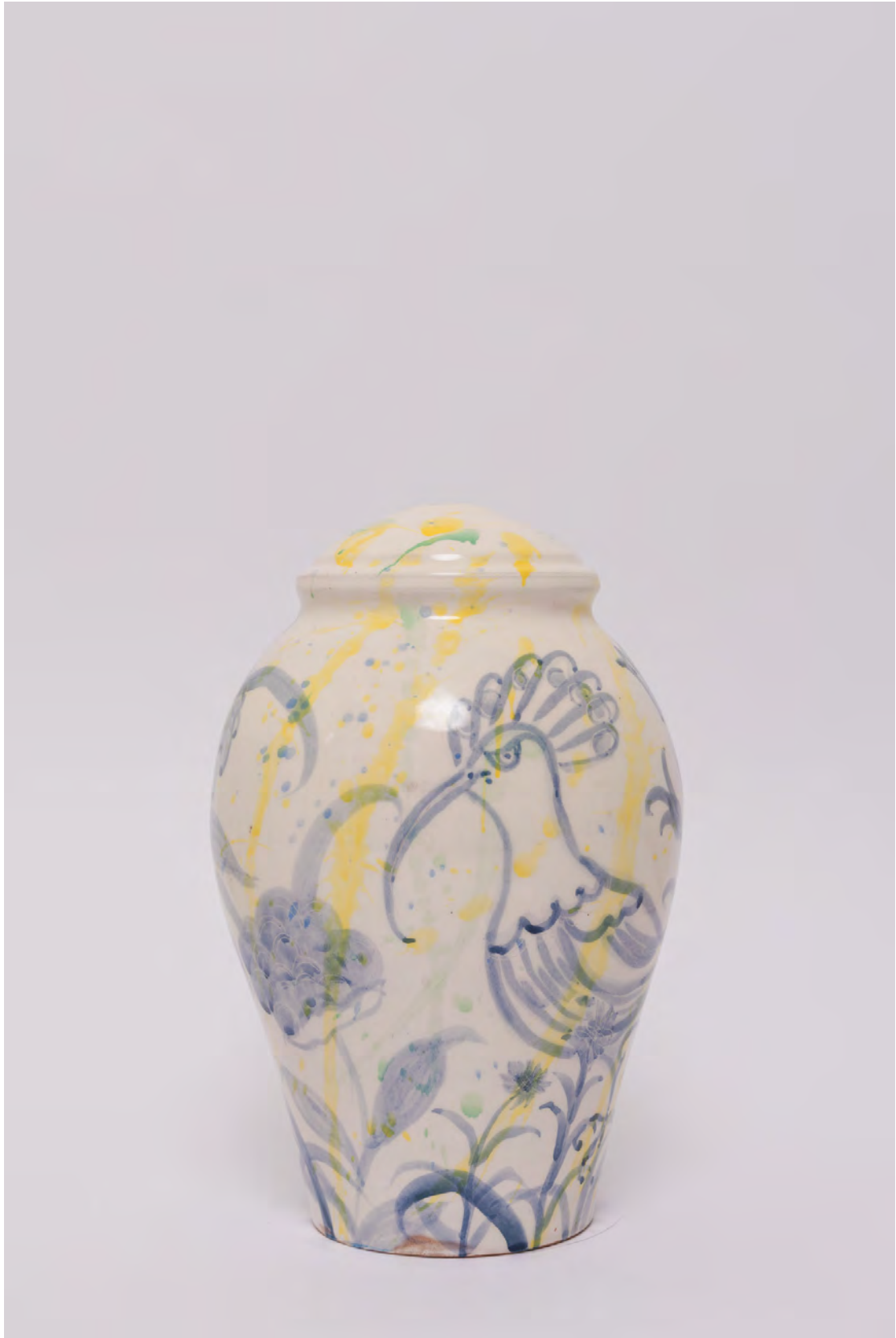
Marianna Papageorgiou Hoopoe, 2022 [MPVRA10] Wheel thrown, hand painted ceramic lamp H 25 X W 16 cm