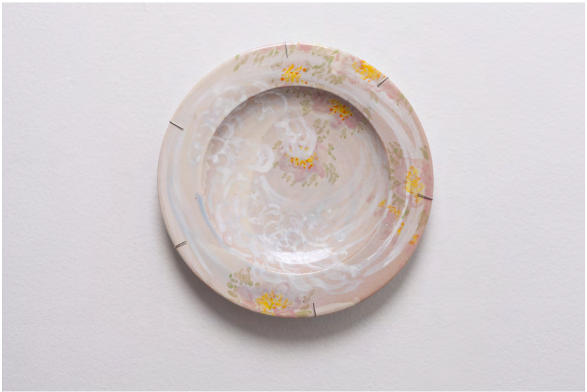
Marianna Papageorgiou Flowersurf, 2022 [MPRA21] Wheel thrown, hand painted ceramic plate 27 cm (diam.)