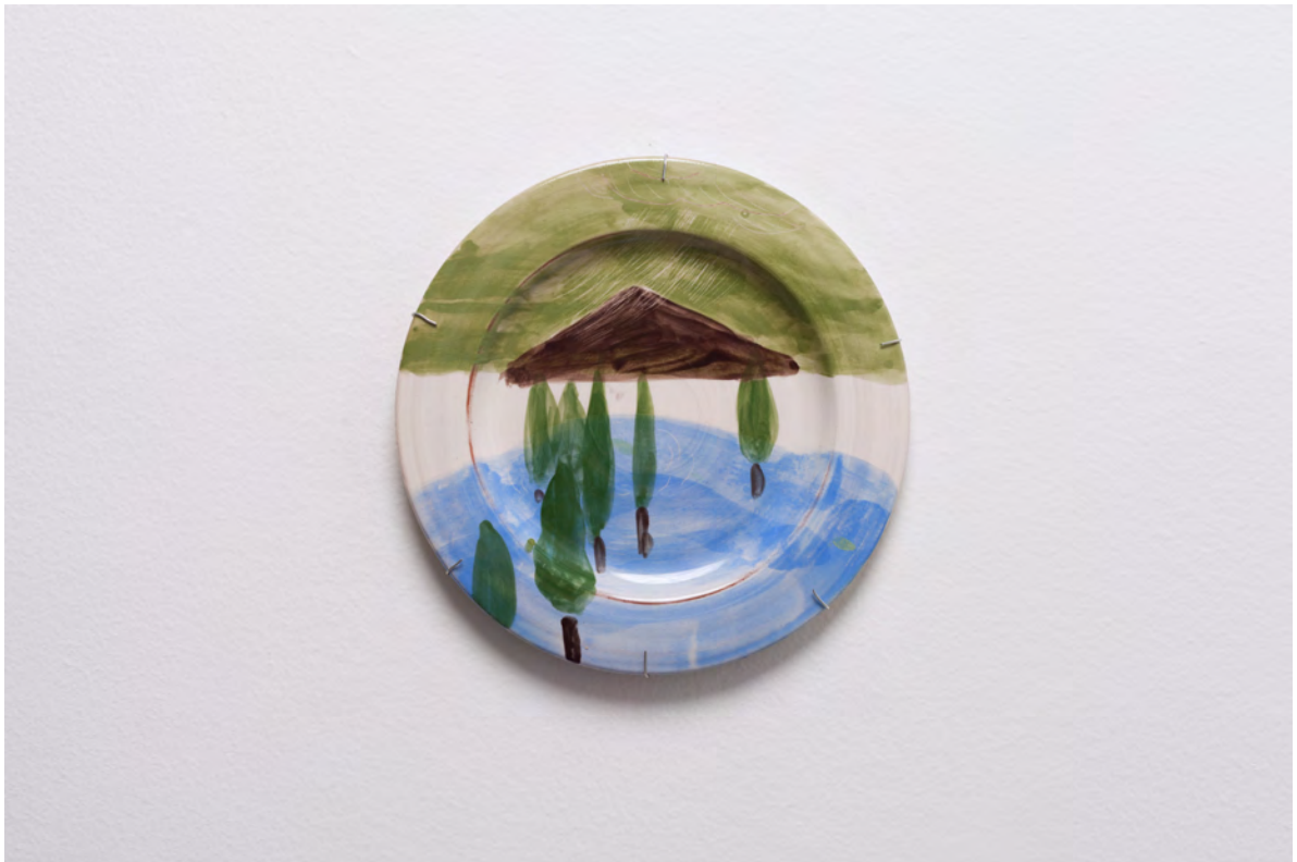
Marianna Papageorgiou Landscape III, 2022 [MPRA24] Wheel thrown, hand painted ceramic plate 23 cm (diam.)