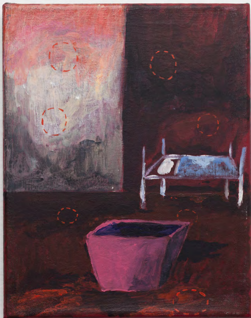
Marianna Papageorgiou Sleep, 2019 [MPPRA01] acrylic on canvas 25 x 20 cm