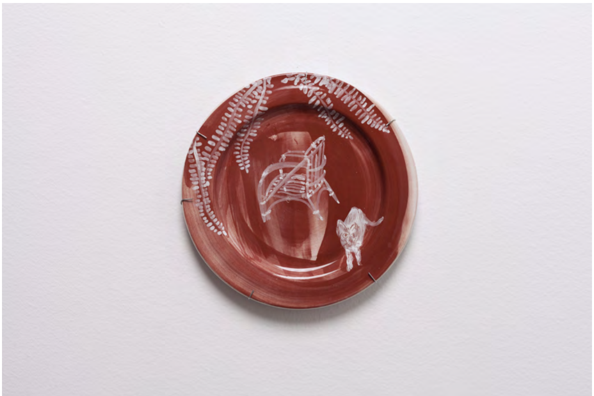
Marianna Papageorgiou Fern II, 2022 [MPRA28] Wheel thrown, hand painted ceramic plate 24 cm (diam.)