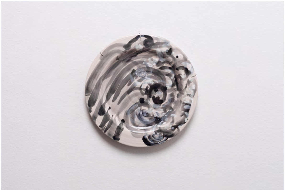
Marianna Papageorgiou Black Surf, 2022 [MPRA27] Wheel thrown, hand painted ceramic plate 24 cm (diam.)