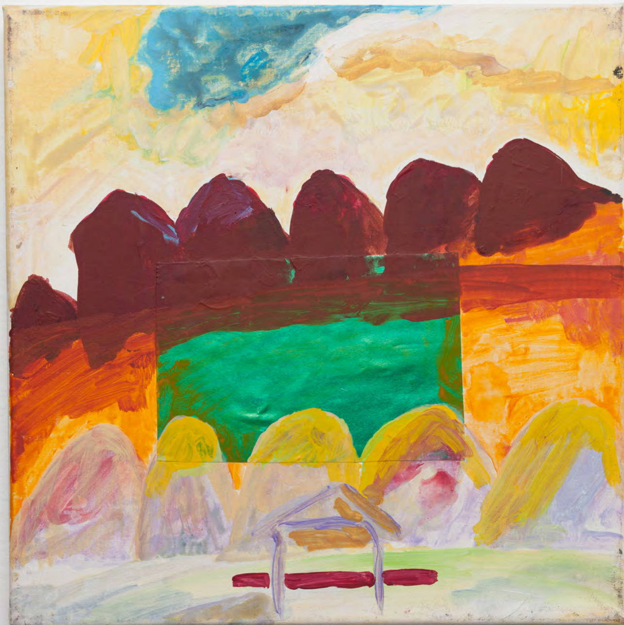
Marianna Papageorgiou Mountains, 2019 [MPPRA06] acrylic on canvas 30 x 30 cm