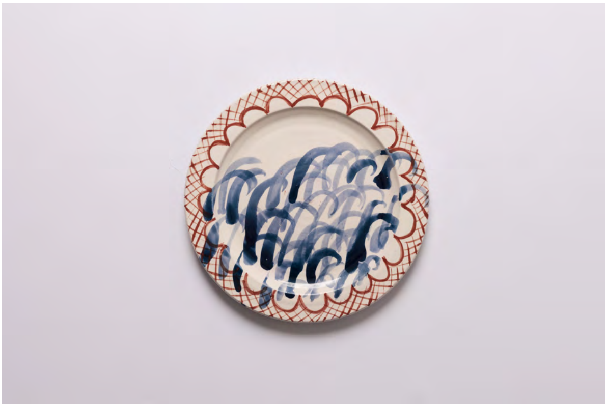
Marianna Papageorgiou Waves I, 2022 [MPRA33] Wheel thrown, hand painted ceramic plate 24 cm (diam.)