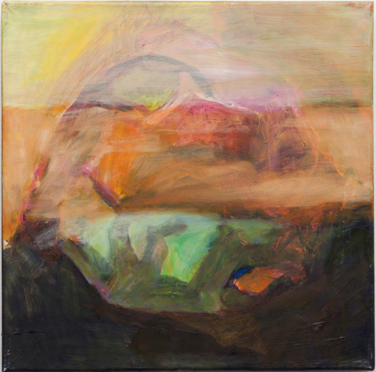
Marianna Papageorgiou Leopard, 2019 [MPPRA08] oil on canvas 30 x 30 cm