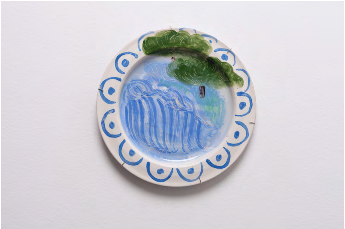
Marianna Papageorgiou Waterfall, 2022 [MPRA16] Wheel thrown, hand painted ceramic plate 27 cm (diam.)