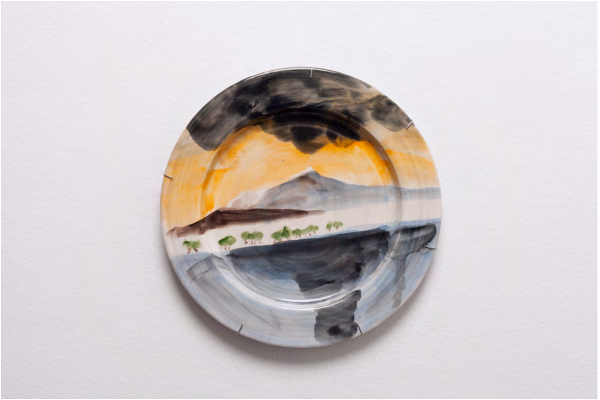
Marianna Papageorgiou Despotiko II, 2022 [MPRA05] Wheel thrown, hand painted ceramic plate 30 cm (diam.)