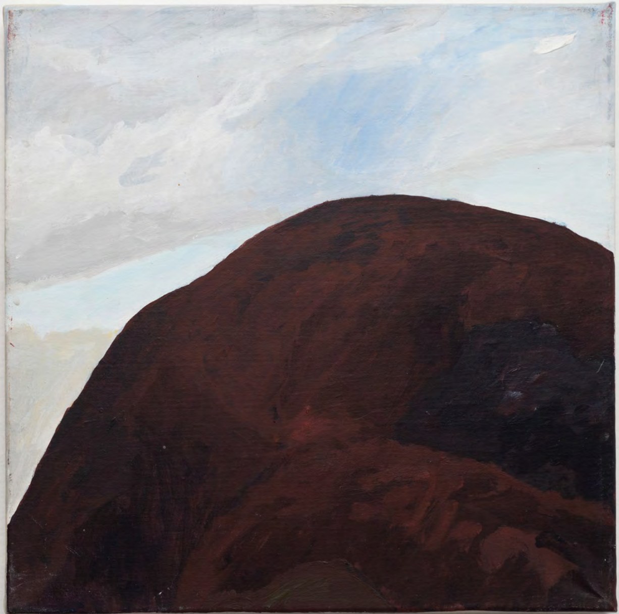
Marianna Papageorgiou Mountain, 2019 [MPPRA07] acrylic on canvas 30 x 30 cm