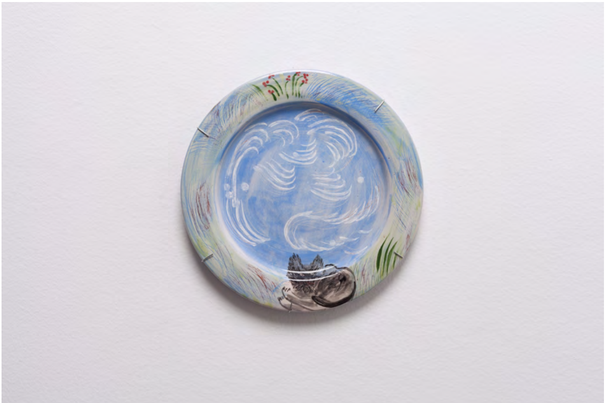
Marianna Papageorgiou Underwater, 2022 [MPRA26] Wheel thrown, hand painted ceramic plate 24 cm (diam.)