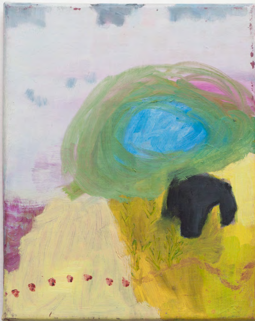
Marianna Papageorgiou Argos, 2019 [MPPRA02] oil on canvas 25 x 20 cm