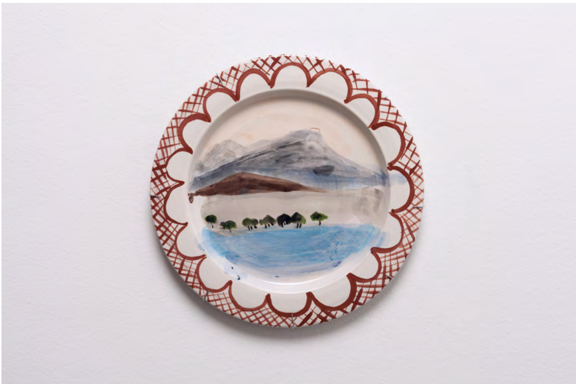
Marianna Papageorgiou Despotiko I, 2022 [MPRA02] Wheel thrown, hand painted ceramic plate 27 cm (diam.)