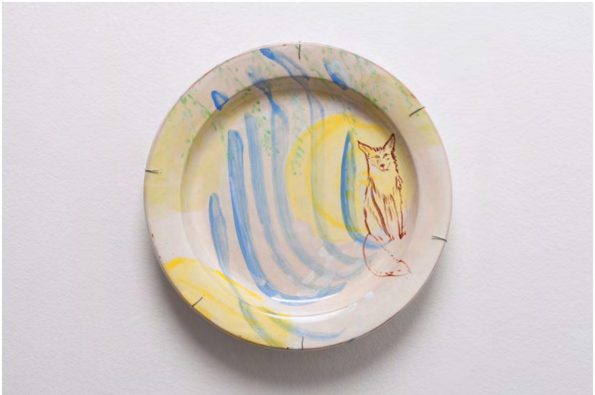
Marianna Papageorgiou Watching Fox II, 2022 [MPRA14] Wheel thrown, hand painted ceramic plate 29 cm (diam.)