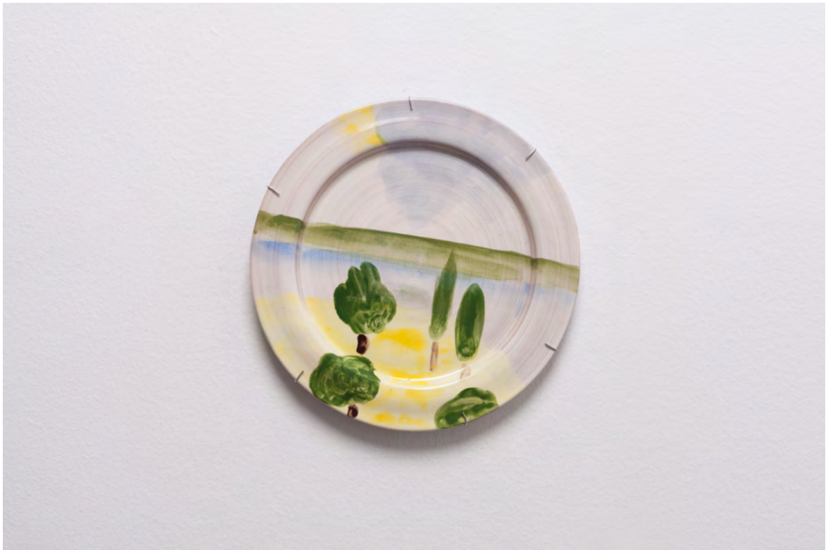
Marianna Papageorgiou Landscape II, 2022 [MPRA22] Wheel thrown, hand painted ceramic plate 23 cm (diam.)