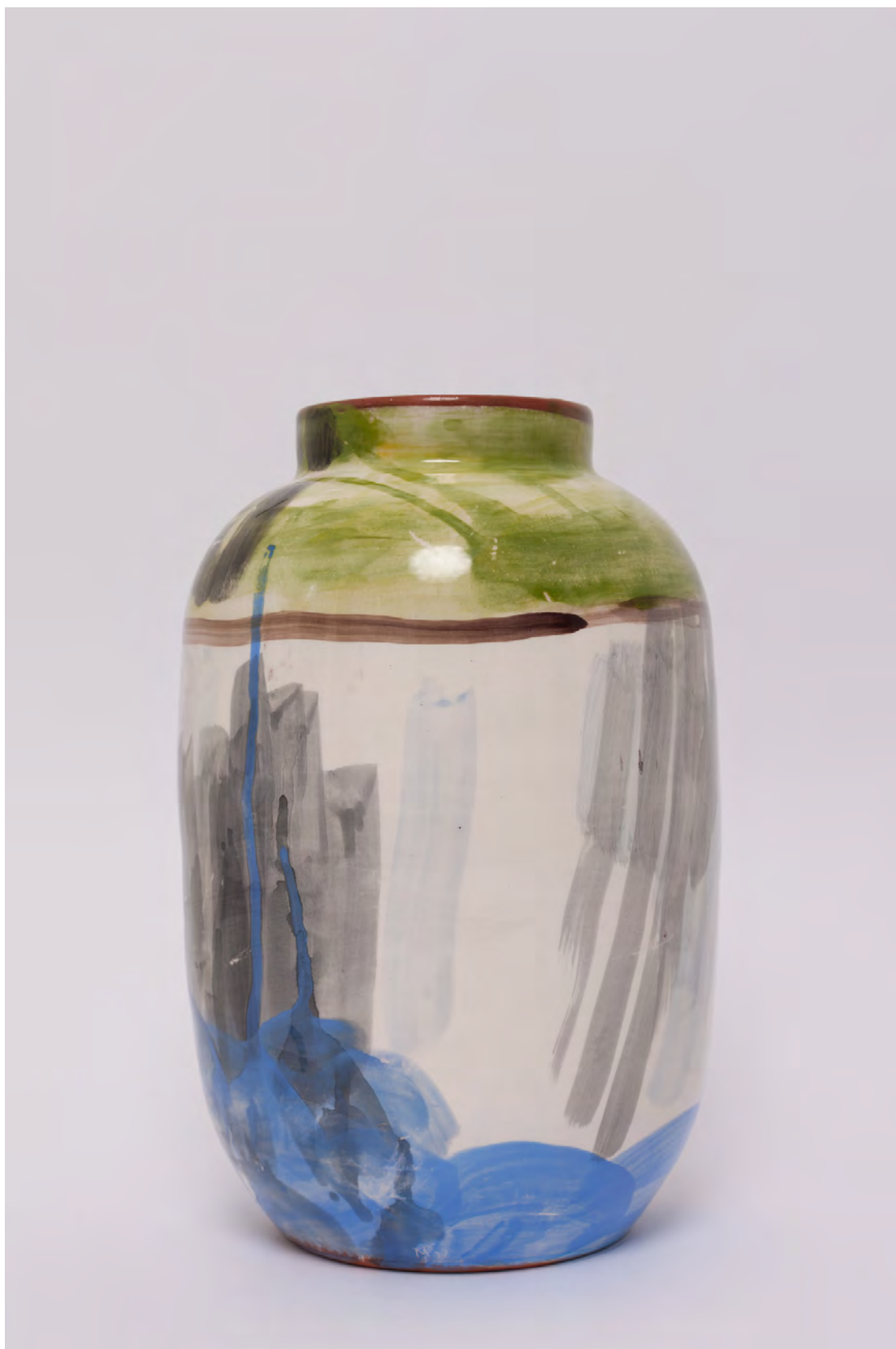
Marianna Papageorgiou Storm, 2022 [MPVRA06] Wheel thrown, hand painted ceramic vase H 32 X W 19 cm