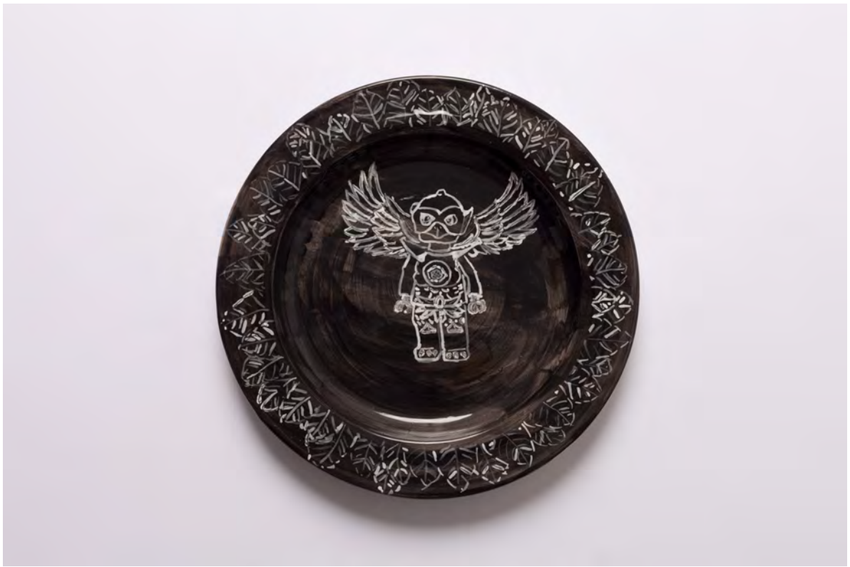
Marianna Papageorgiou Eagle, 2022 [MPRA41] Wheel thrown, hand painted ceramic plate 27 cm (diam.)