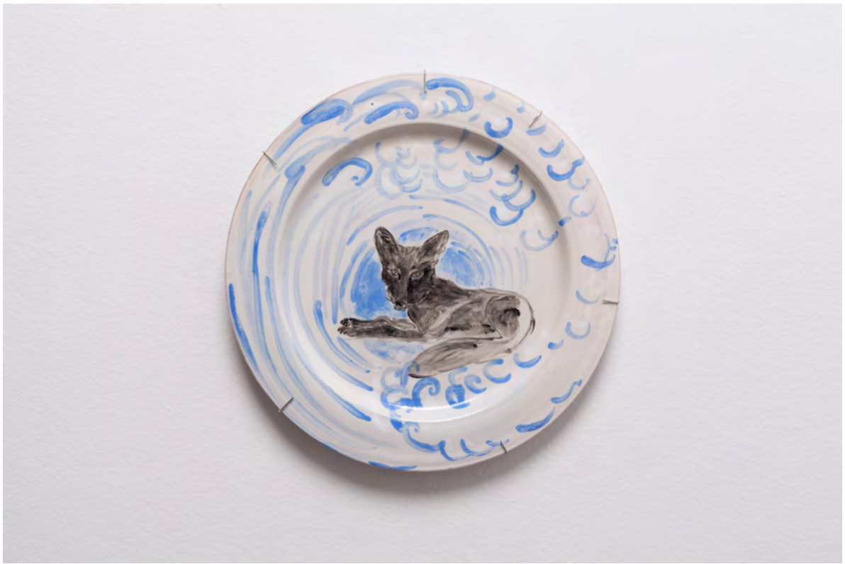
Marianna Papageorgiou Surf Fox, 2022 [MPRA15] Wheel thrown, hand painted ceramic plate 27 cm (diam.)