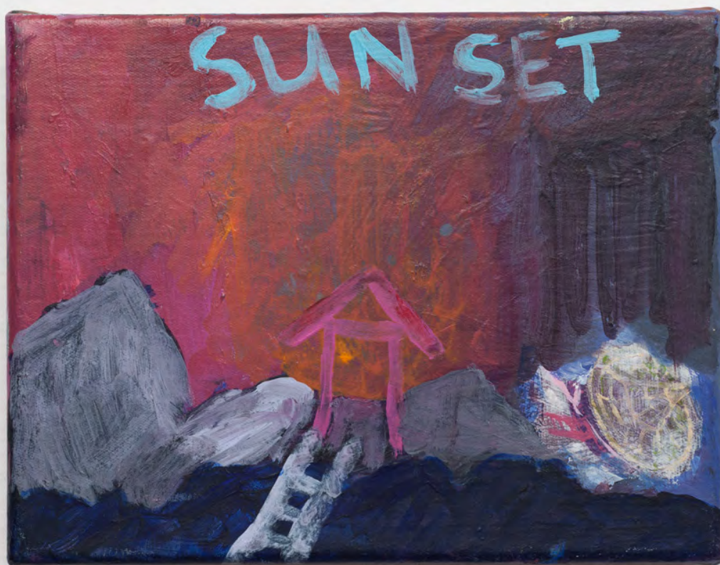
Marianna Papageorgiou Sunset, 2019 [MPPRA11] acrylic on canvas 15.5 x 20 cm