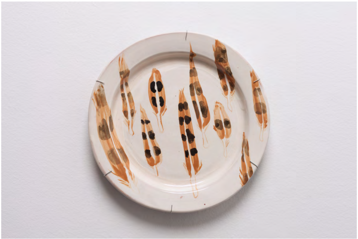
Marianna Papageorgiou Feathers, 2022 [MPRA07] Wheel thrown, hand painted ceramic plate 30 cm (diam.)