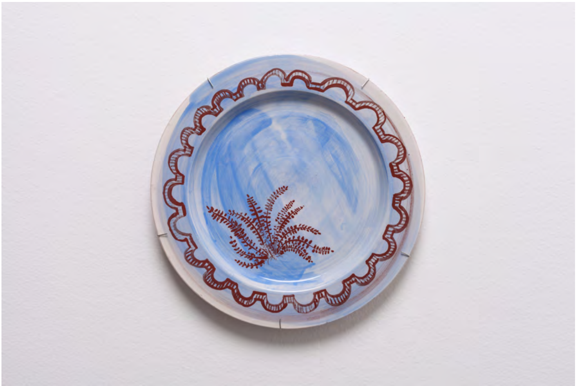
Marianna Papageorgiou Fern I, 2022 [MPRA01] Wheel thrown, hand painted ceramic plate 26 cm (diam.)