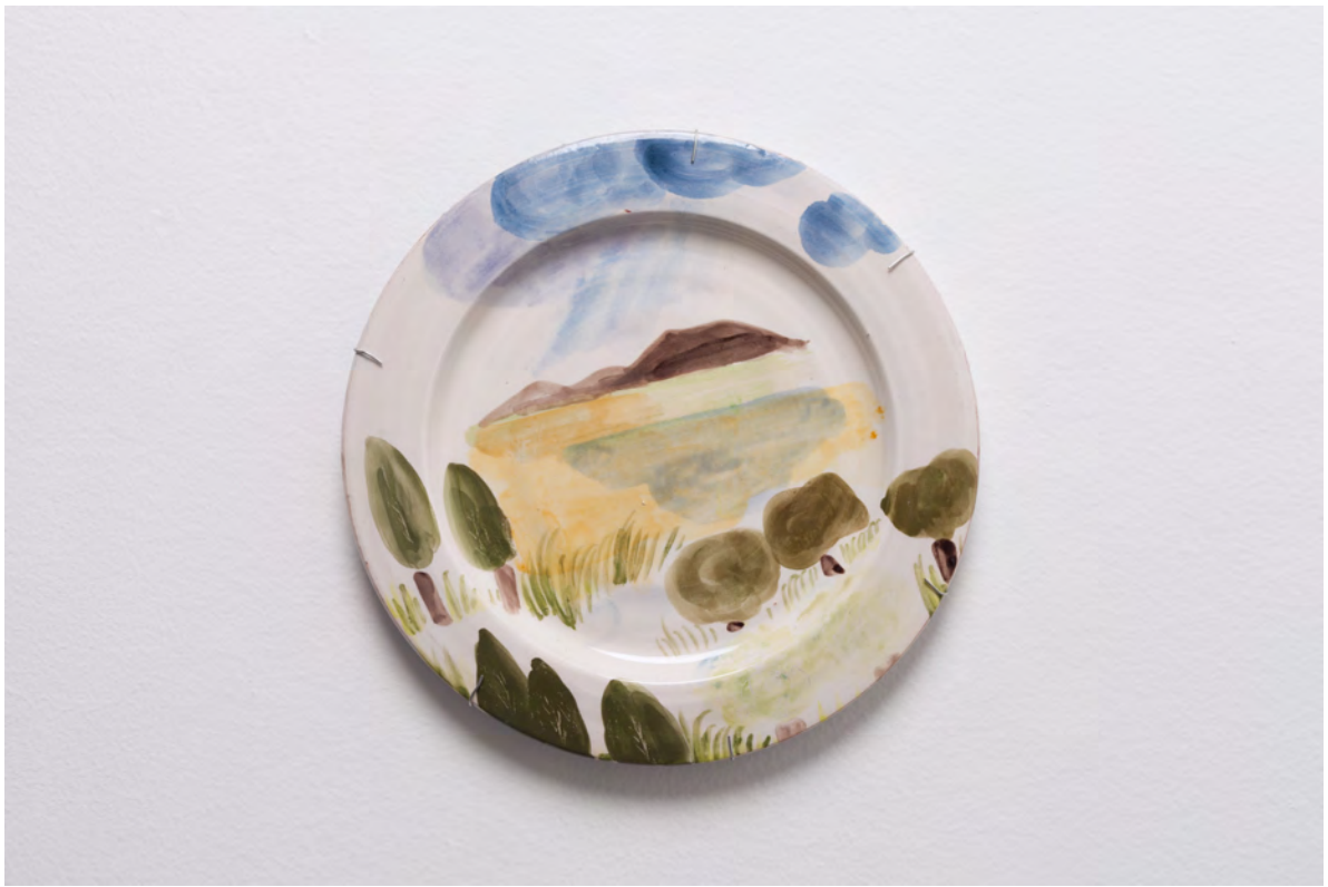
Marianna Papageorgiou Landscape I, 2022 [MPRA03] Wheel thrown, hand painted ceramic plate 27 cm (diam.)