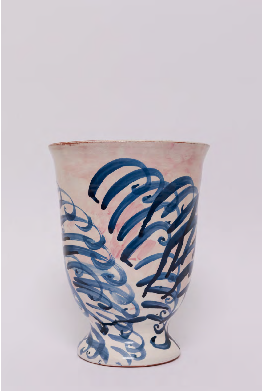
Marianna Papageorgiou Waves, 2022 [MPVRA02] Wheel thrown, hand painted ceramic vase H 28 X W 18 cm