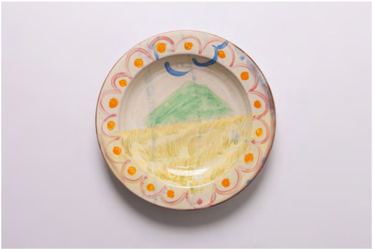
Marianna Papageorgiou Landscape IV, 2022 [MPRA37] Wheel thrown, hand painted ceramic plate 29 cm (diam.)