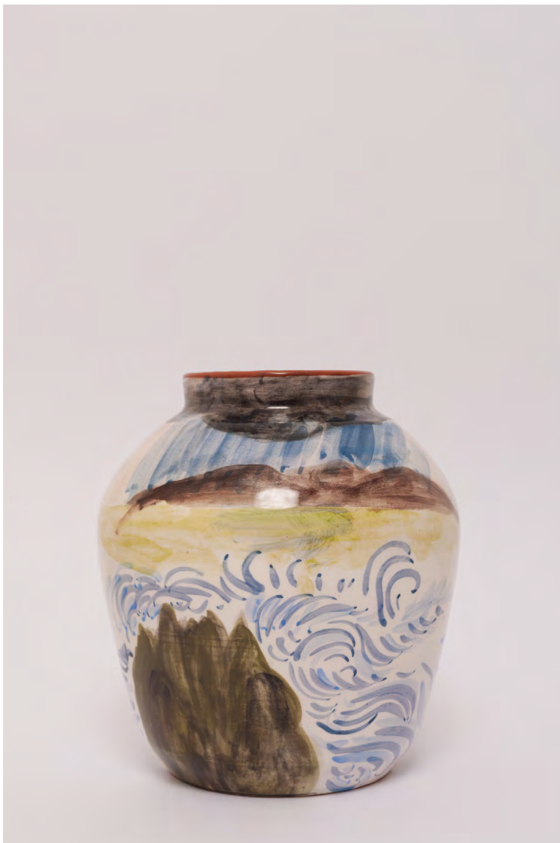
Marianna Papageorgiou Storm, 2022 [MPVRA03] Wheel thrown, hand painted ceramic vase H 24 X W 20 cm