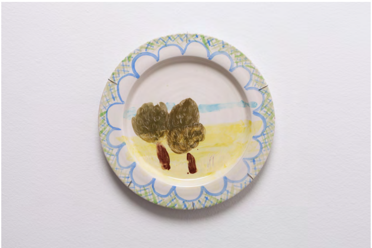
Marianna Papageorgiou Two Trees, 2022 [MPRA04] Wheel thrown, hand painted ceramic plate 27 cm (diam.)