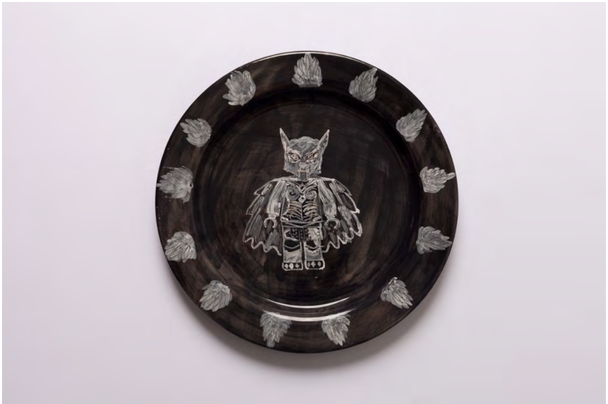
Marianna Papageorgiou Wolf, 2022 [MPRA40] Wheel thrown, hand painted ceramic plate 27 cm (diam.)