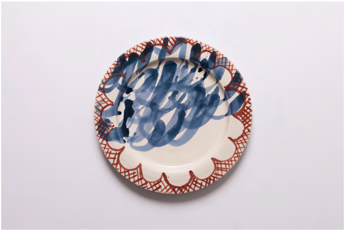
Marianna Papageorgiou Waves IV, 2022 [MPRA9] Wheel thrown, hand painted ceramic plate 27 cm (diam.)