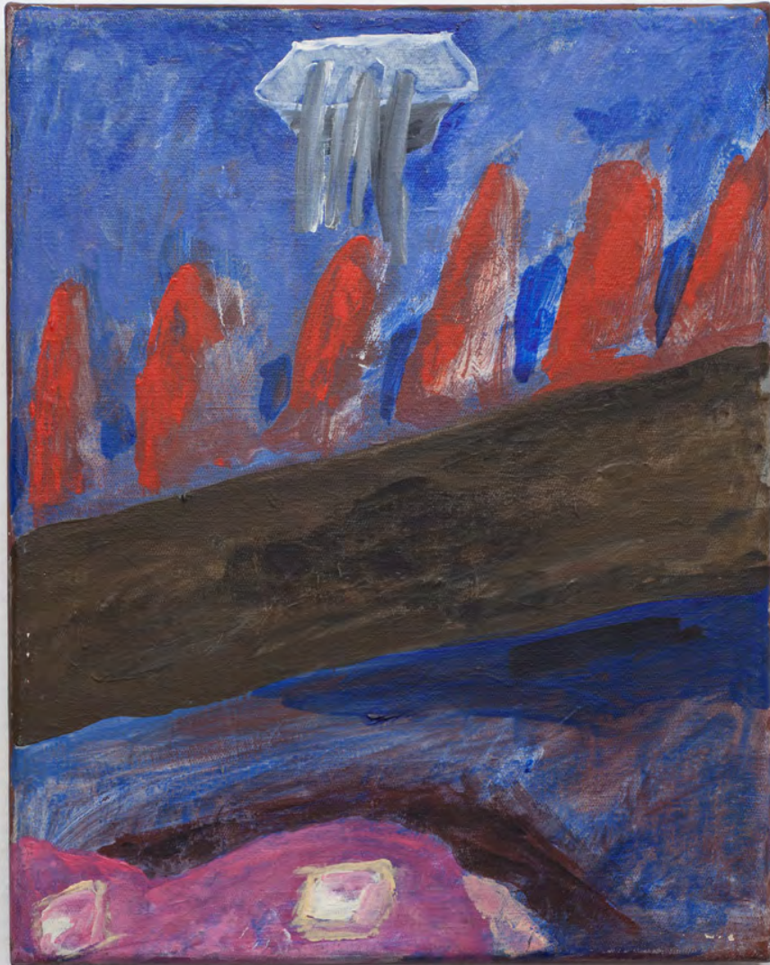
Marianna Papageorgiou River, 2019 [MPPRA10] acrylic on canvas 25 x 20 cm