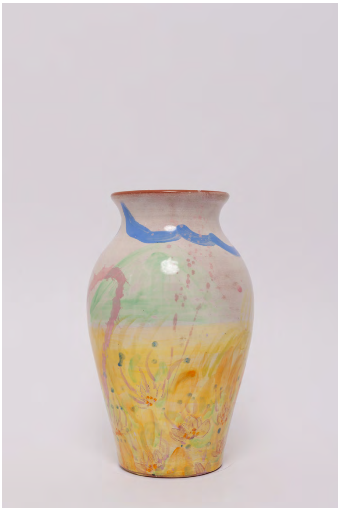
Marianna Papageorgiou Landscape, 2022 [MPVRA07] Wheel thrown, hand painted ceramic vase H 28 X W 16 cm