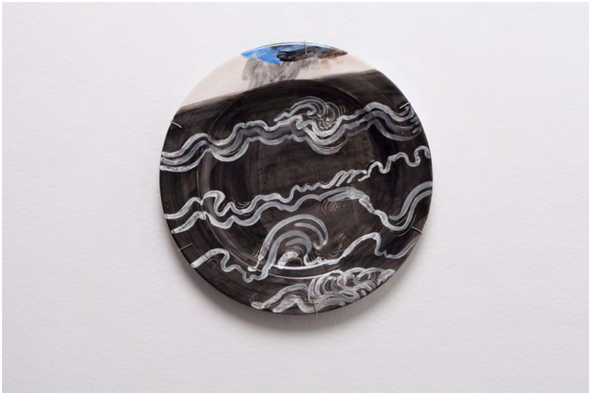
Marianna Papageorgiou Sound Waves, 2022 [MPRA20] Wheel thrown, hand painted ceramic plate 27 cm (diam.)