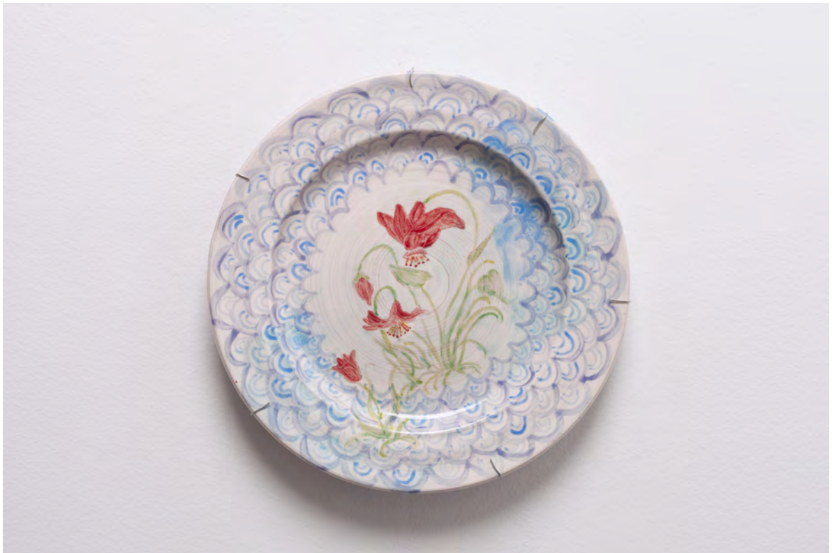
Marianna Papageorgiou Old Tulip, 2022 [MPRA10] Wheel thrown, hand painted ceramic plate 30 cm (diam.)