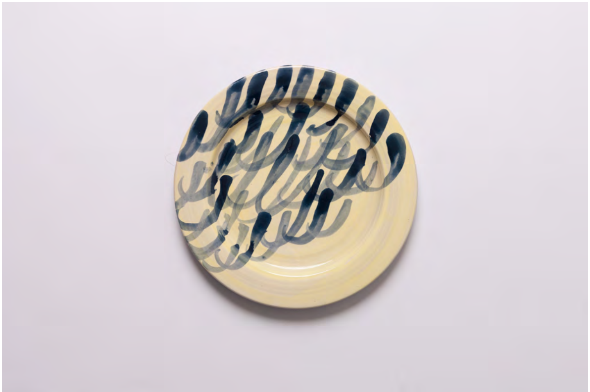
Marianna Papageorgiou Waves II, 2022 [MPRA34] Wheel thrown, hand painted ceramic plate 24 cm (diam.)