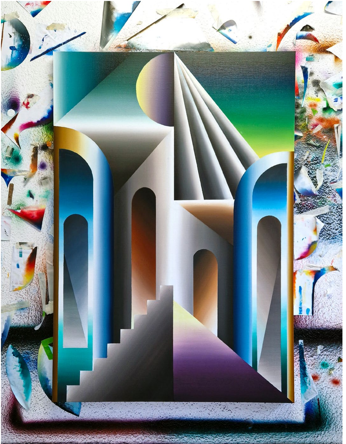
Florian & Michael Quistrebert, Untitled , 2023 Oil on canvas | Huile sur toile, 150 x 100 cm