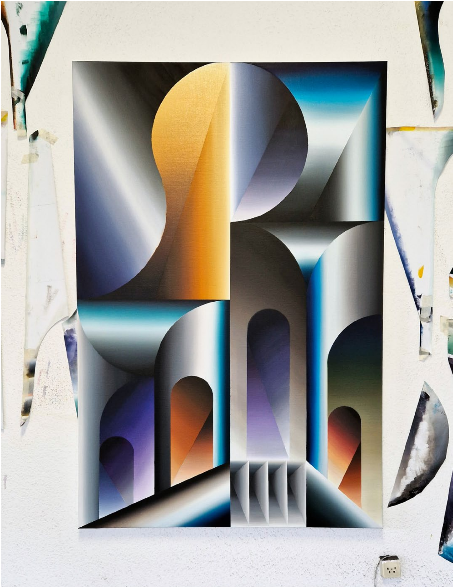
Florian & Michael Quistrebert, Untitled , 2023 Oil on canvas | Huile sur toile, 150 x 100 cm Courtesy of the artists and Crèveœur, Paris.