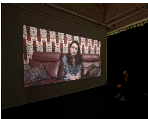
Kader Attia, The Body's Legacies Pt. 2: The Postcolonial Body , 2018