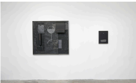
Torkwase Dyson, Distance, Flesh #6 (Liquid a Place) No. 82651 , 2022 et Enclosure/Encounter - Studies #3 (Hypershape) No. 82872 , 2022