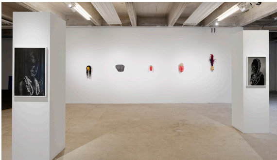
Zanele Muholi, Romuald Hazoumè in Prendre corps au monde , 2023