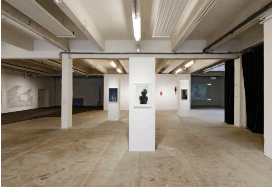
Vue de l'exposition Prendre corps au monde , 2023