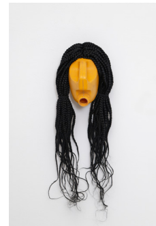
Romuald Hazoumè, Botero et Amina , 2020