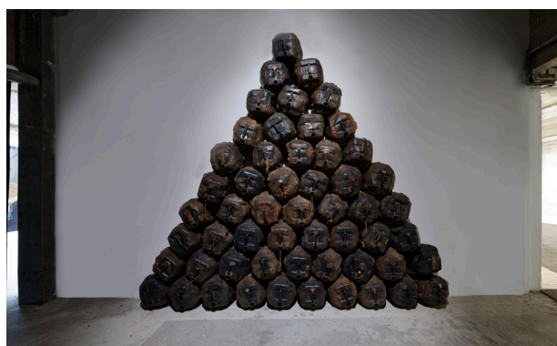
Romuald Hazoumè, Pièce montée , 2005