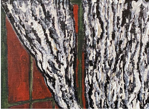
Stevie Dix, "A mental space", 2023, oil and beeswax on canvas on board, 30x24cm (detail)