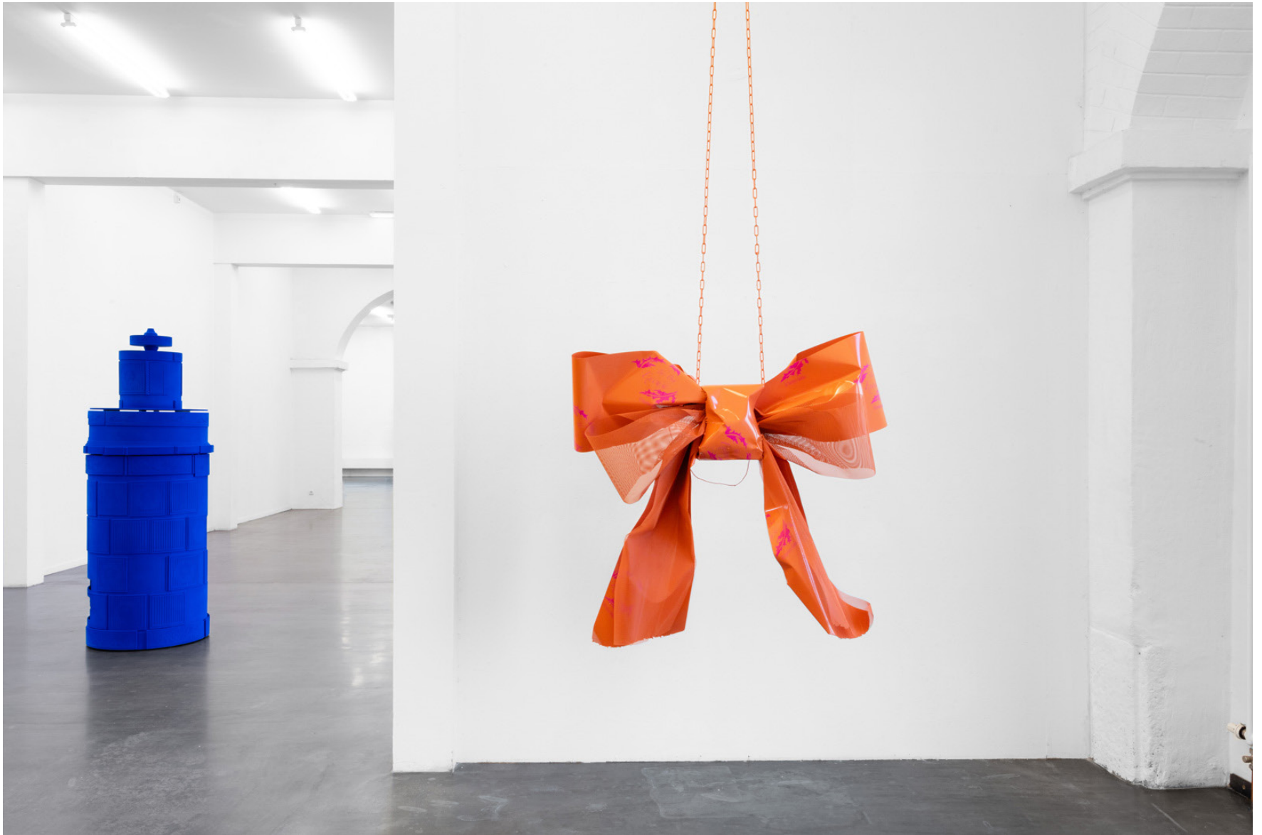
Hannah Sophie Dunkelberg, L'Esprit Nouveau , 2021, Kunstraum Potsdam, exhibition view.