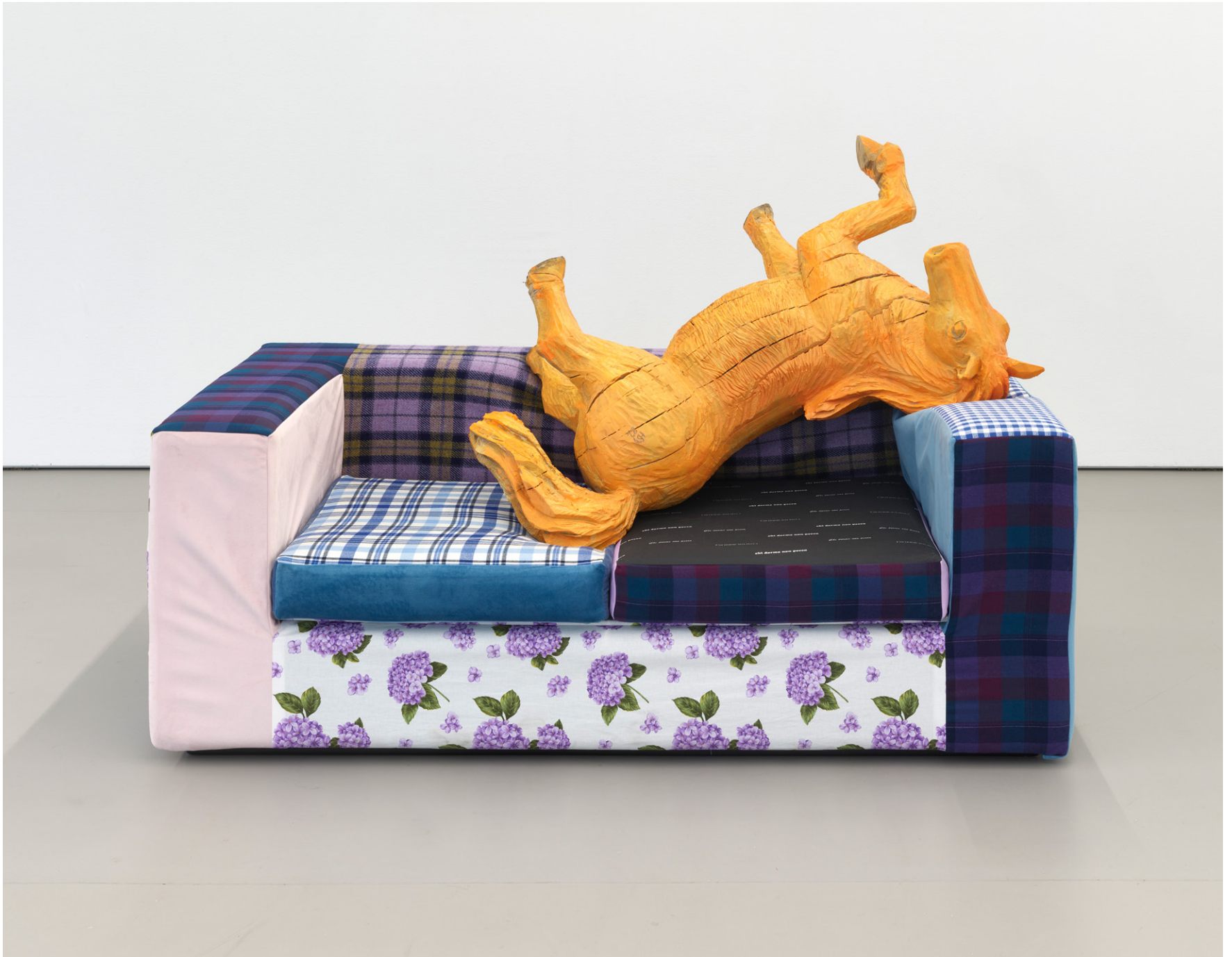
Hannah Sophie Dunkelberg, Müdes Pferd , 2022, sofa, digital print on fabric, lacquer, sessile oak, 108 x 148 x 88 cm.