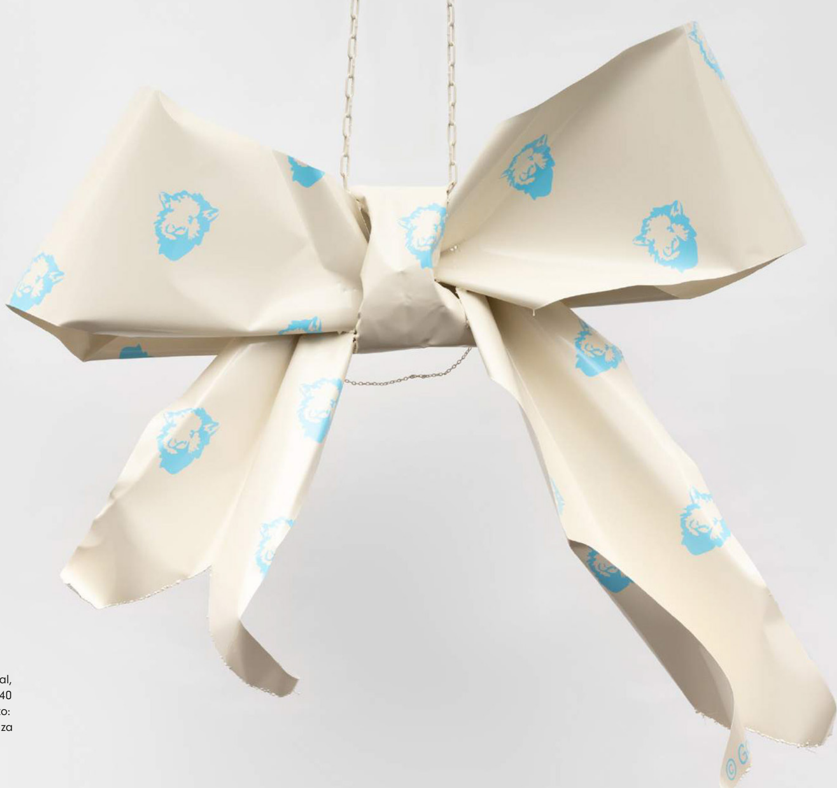
Hannah Sophie Dunkelberg, THE BIG EXCUSE , 2021, powdercoated metal, self-adhesive foil, 140 x 125 x 40 cm.