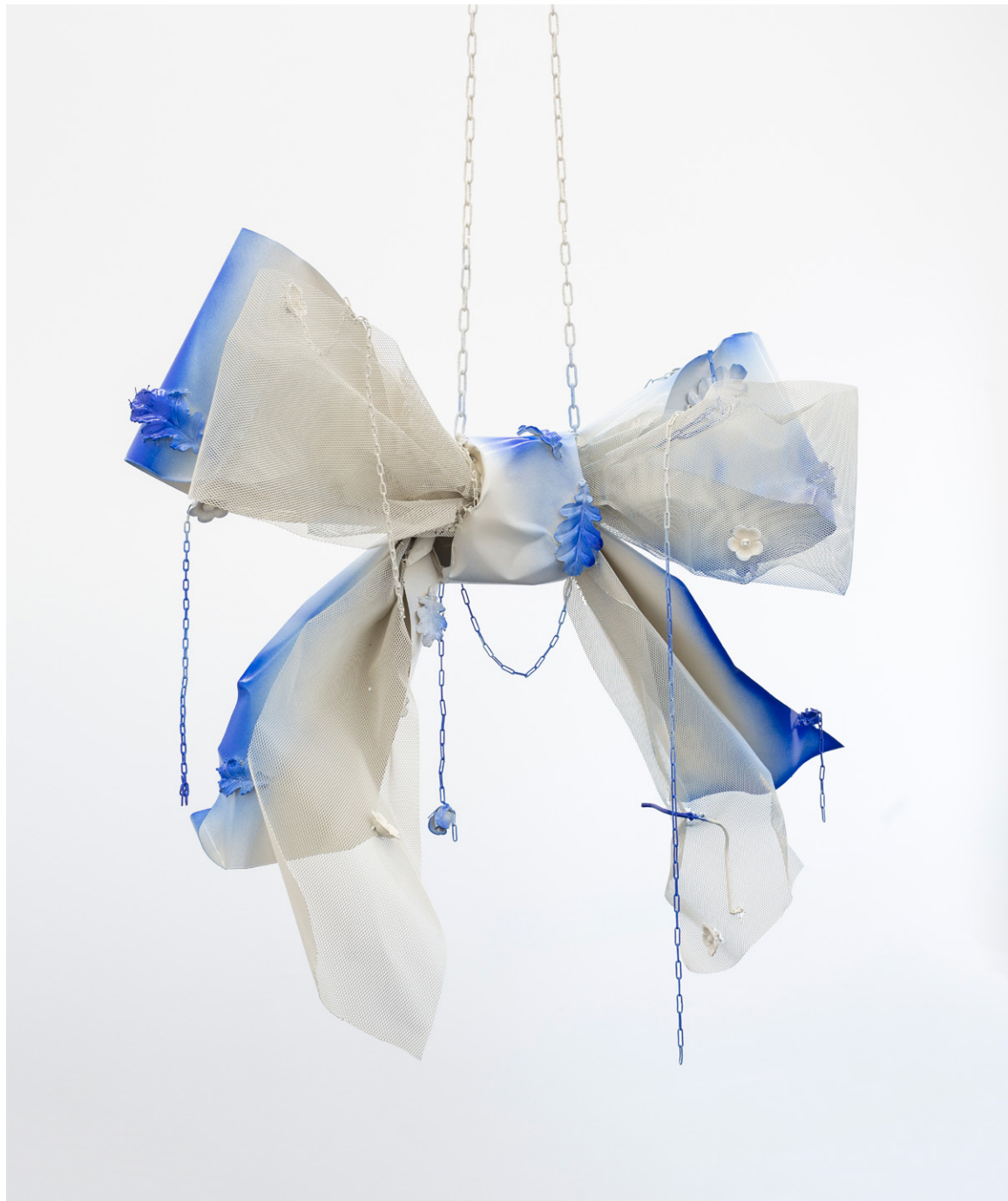
Hannah Sophie Dunkelberg Altweiberknoten II , 2022 powdercoated metal 115 x 115 x 50 cm