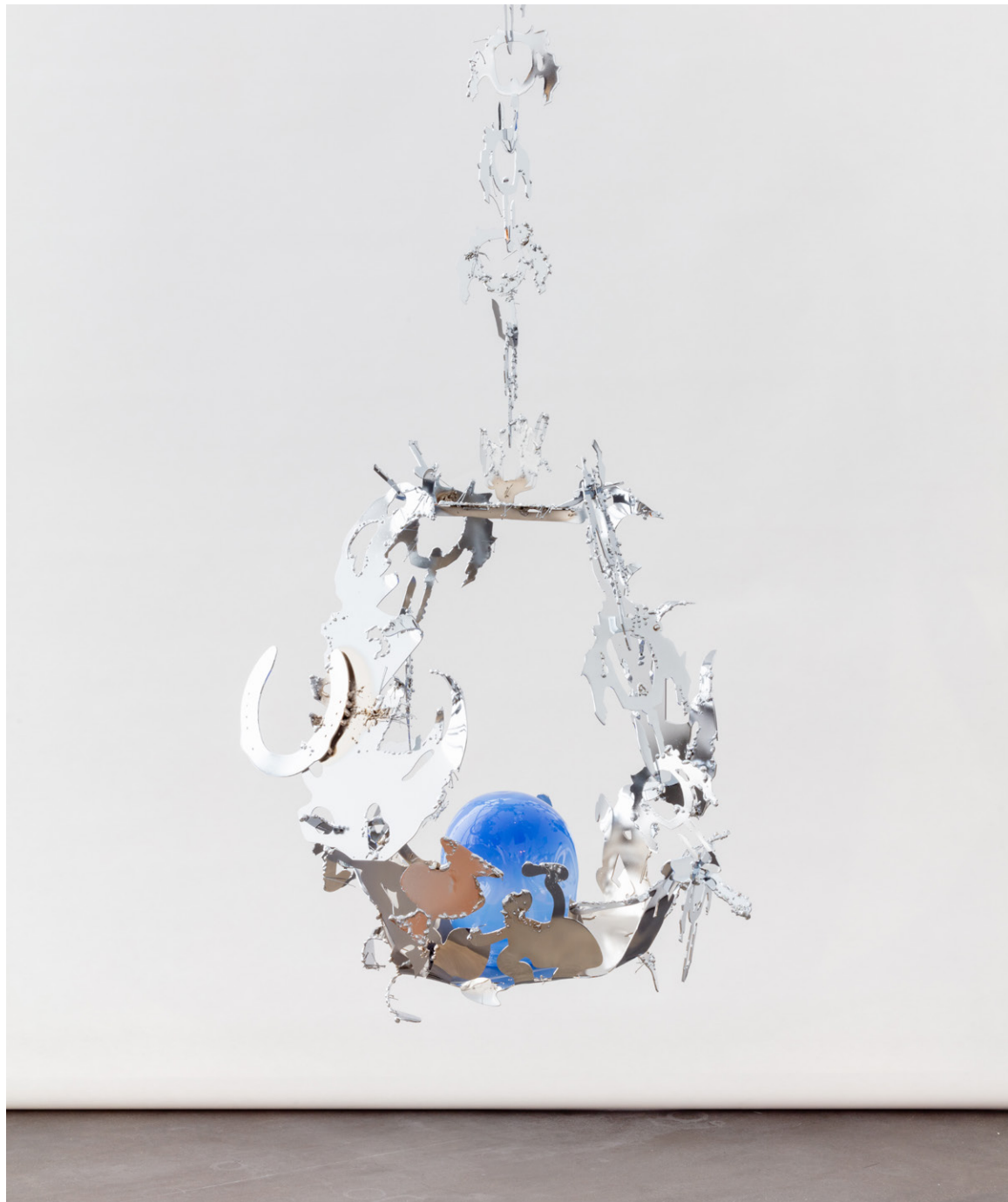
Hannah Sophie Dunkelberg, Beletage , 2021, steel, glass, dimensions variable.