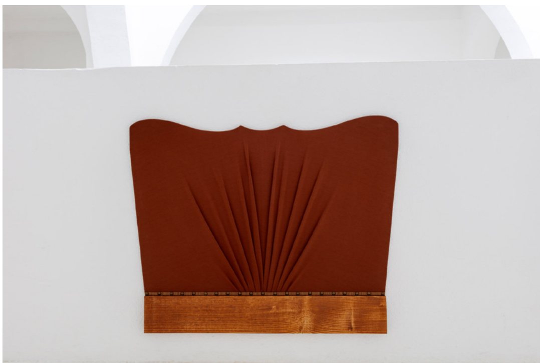
Vue de l'exposition Josy's Club de Pierre-Olivier Arnaud et Denis Savary, centre d'art contemporain - la synagogue de Delme, 2023.