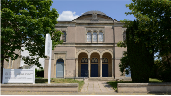
CAC - la synagogue de Delme.