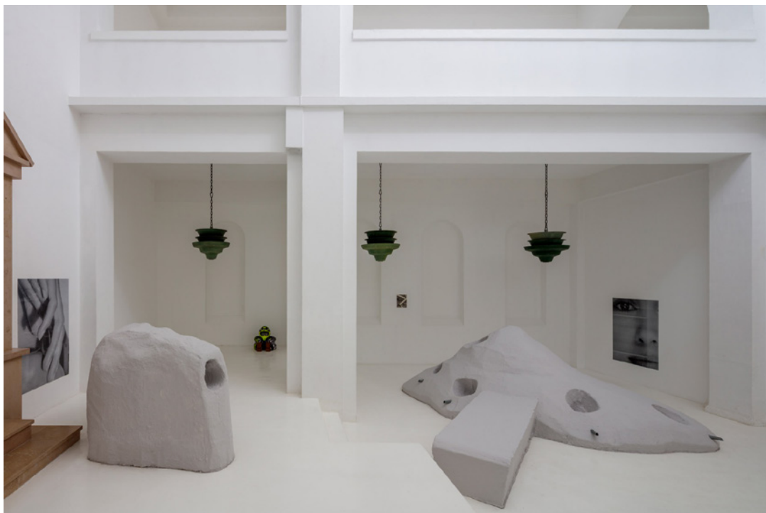
Vue de l'exposition Josy's Club de Pierre-Olivier Arnaud et Denis Savary, centre d'art contemporain - la synagogue de Delme, 2023.