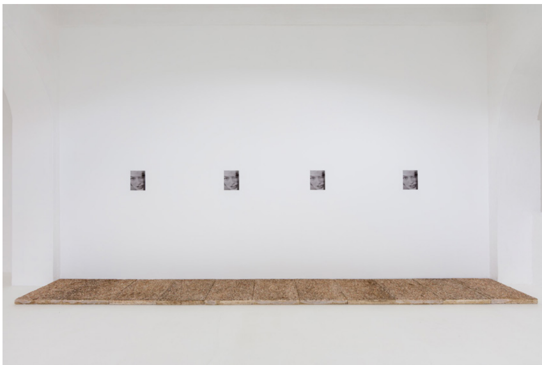
Vue de l'exposition Josy's Club de Pierre-Olivier Arnaud et Denis Savary, centre d'art contemporain - la synagogue de Delme, 2023.