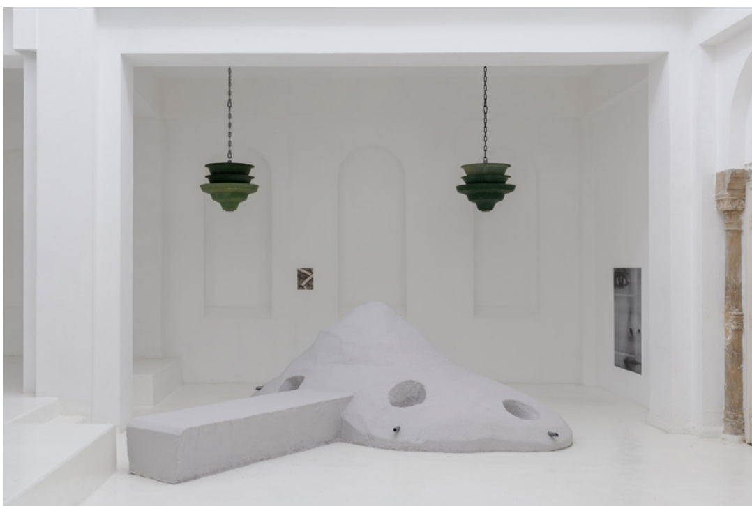
Vue de l'exposition Josy's Club de Pierre-Olivier Arnaud et Denis Savary, centre d'art contemporain - la synagogue de Delme, 2023.