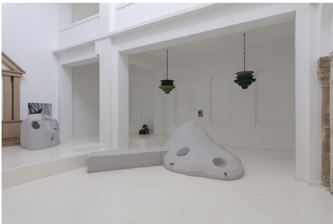
Vue de l'exposition Josy's Club de Pierre-Olivier Arnaud et Denis Savary, centre d'art contemporain - la synagogue de Delme, 2023.