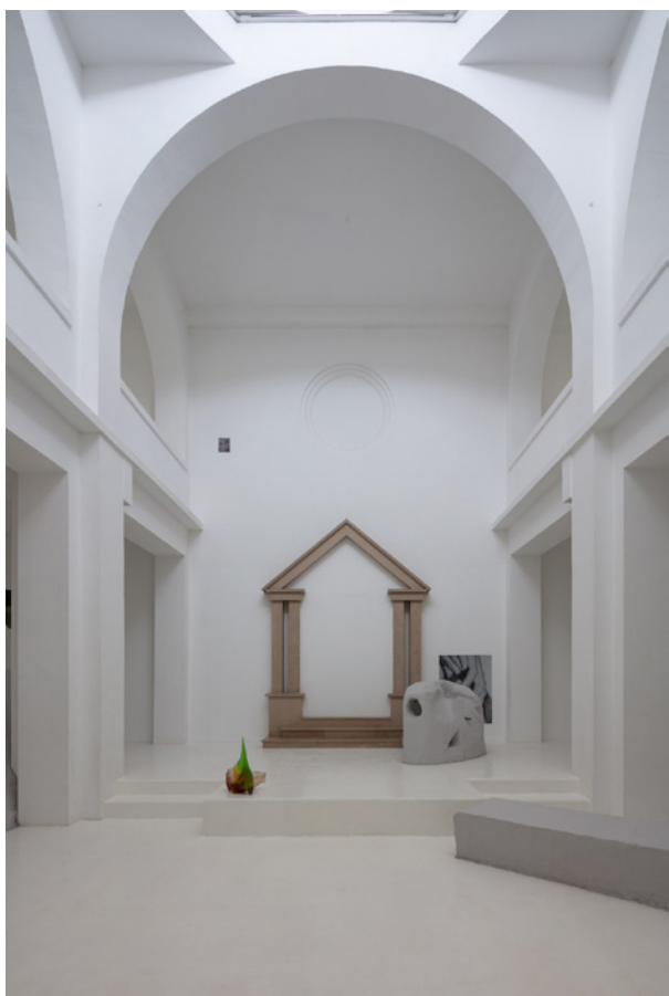
Vues de l'exposition Josy's Club de Pierre-Olivier Arnaud et Denis Savary, centre d'art contemporain - la synagogue de Delme, 2023.