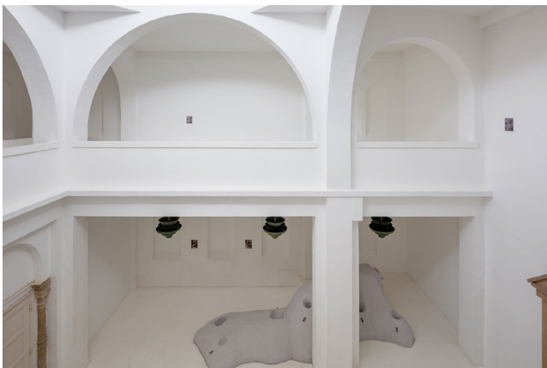
Vue de l'exposition Josy's Club de Pierre-Olivier Arnaud et Denis Savary, centre d'art contemporain - la synagogue de Delme, 2023.