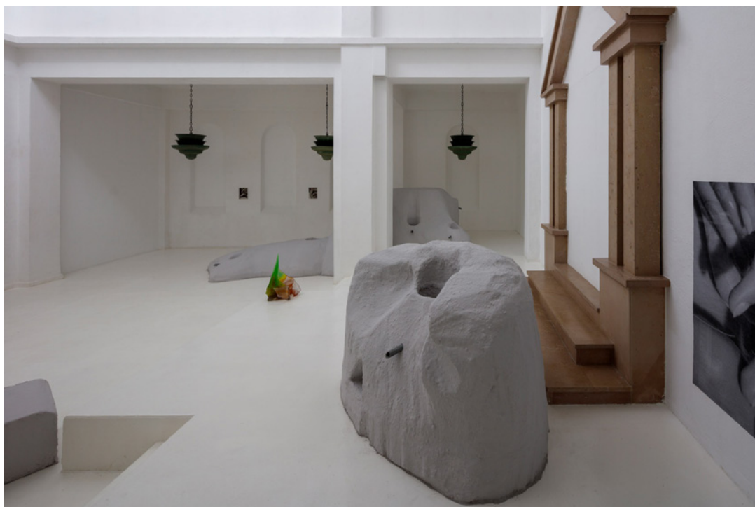
Vue de l'exposition Josy's Club de Pierre-Olivier Arnaud et Denis Savary, centre d'art contemporain - la synagogue de Delme, 2023.