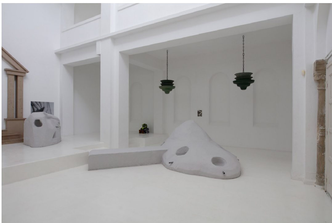
Vue de l'exposition Josy's Club de Pierre-Olivier Arnaud et Denis Savary, centre d'art contemporain - la synagogue de Delme, 2023.