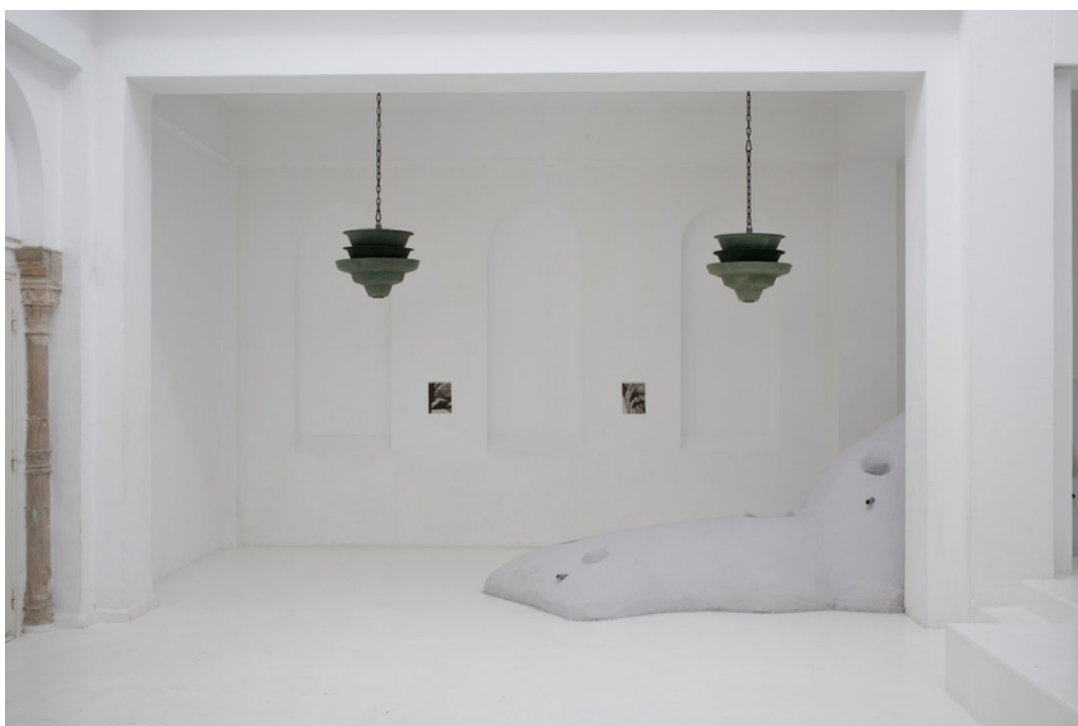
Vue de l'exposition Josy's Club de Pierre-Olivier Arnaud et Denis Savary, centre d'art contemporain - la synagogue de Delme, 2023.