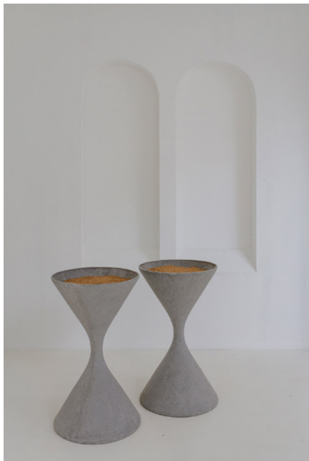
Vues de l'exposition Josy's Club de Pierre-Olivier Arnaud et Denis Savary, centre d'art contemporain - la synagogue de Delme, 2023.