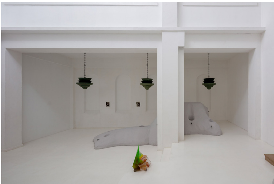
Vue de l'exposition Josy's Club de Pierre-Olivier Arnaud et Denis Savary, centre d'art contemporain - la synagogue de Delme, 2023.