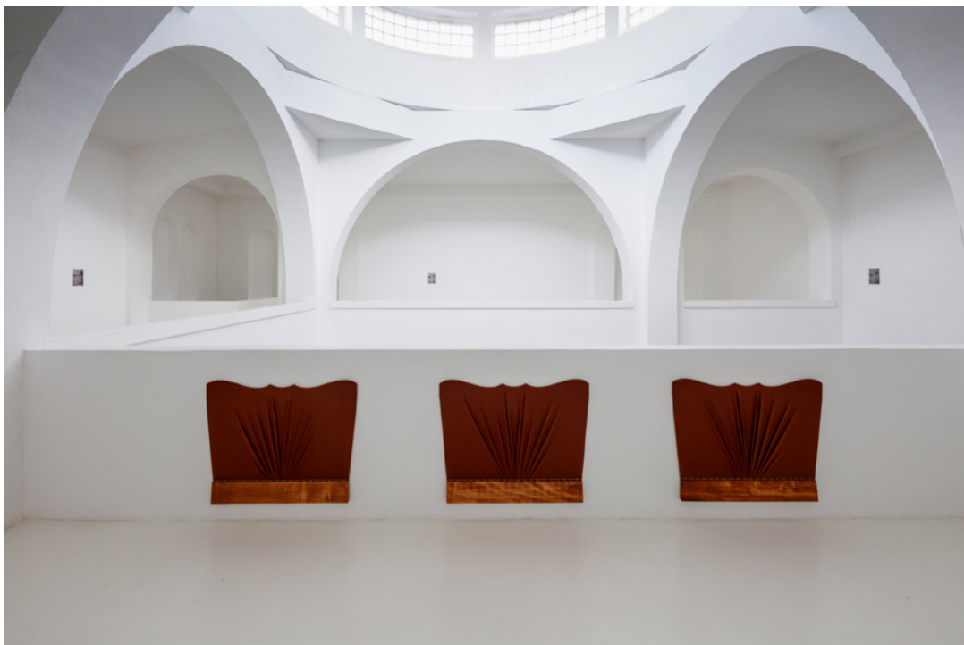
Vue de l'exposition Josy's Club de Pierre-Olivier Arnaud et Denis Savary, centre d'art contemporain - la synagogue de Delme, 2023.