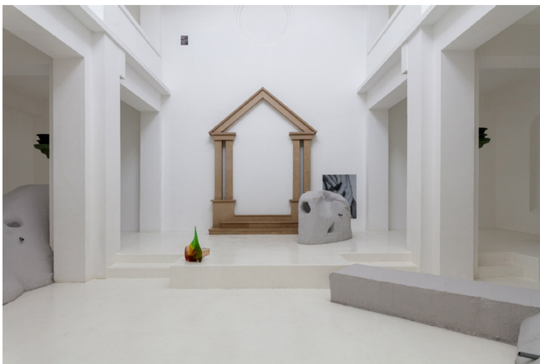
Vue de l'exposition Josy's Club de Pierre-Olivier Arnaud et Denis Savary, centre d'art contemporain - la synagogue de Delme, 2023.