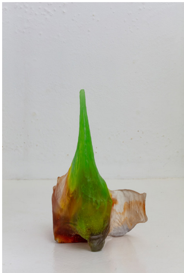
Vues de l'exposition Josy's Club de Pierre-Olivier Arnaud et Denis Savary, centre d'art contemporain - la synagogue de Delme, 2023.