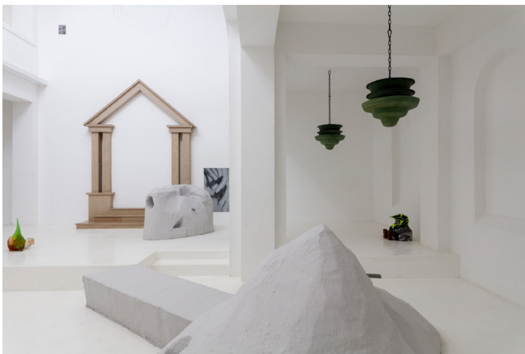
Vue de l'exposition Josy's Club de Pierre-Olivier Arnaud et Denis Savary, centre d'art contemporain - la synagogue de Delme, 2023.