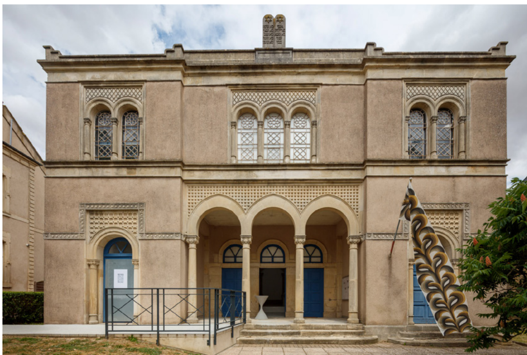
Vue de l'exposition Josy's Club de Pierre-Olivier Arnaud et Denis Savary, centre d'art contemporain - la synagogue de Delme, 2023.

Visuels en haute définition téléchargeables dans l'espace presse sur le site www.cac-synagoguedelme.org (identifiant et mot de passe sur demande).