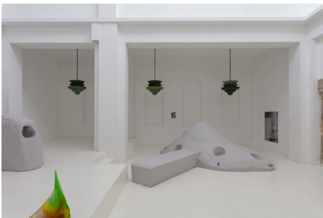
Vue de l'exposition Josy's Club de Pierre-Olivier Arnaud et Denis Savary, centre d'art contemporain - la synagogue de Delme, 2023.