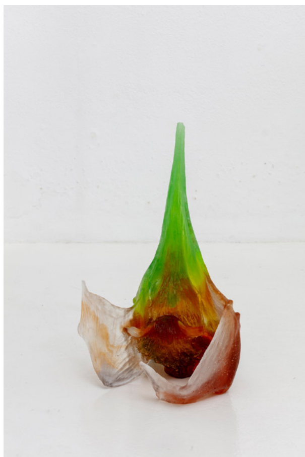
Vues de l'exposition Josy's Club de Pierre-Olivier Arnaud et Denis Savary, centre d'art contemporain - la synagogue de Delme, 2023.