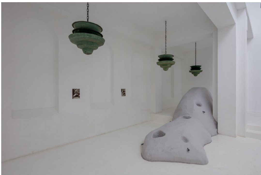
Vue de l'exposition Josy's Club de Pierre-Olivier Arnaud et Denis Savary, centre d'art contemporain - la synagogue de Delme, 2023.