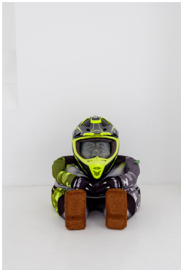
Vues de l'exposition Josy's Club de Pierre-Olivier Arnaud et Denis Savary, centre d'art contemporain - la synagogue de Delme, 2023.