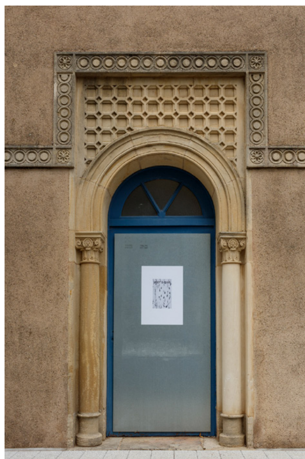
Vues de l'exposition Josy's Club de Pierre-Olivier Arnaud et Denis Savary, centre d'art contemporain - la synagogue de Delme, 2023.