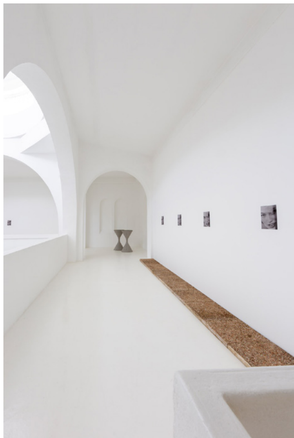
Vues de l'exposition Josy's Club de Pierre-Olivier Arnaud et Denis Savary, centre d'art contemporain - la synagogue de Delme, 2023.