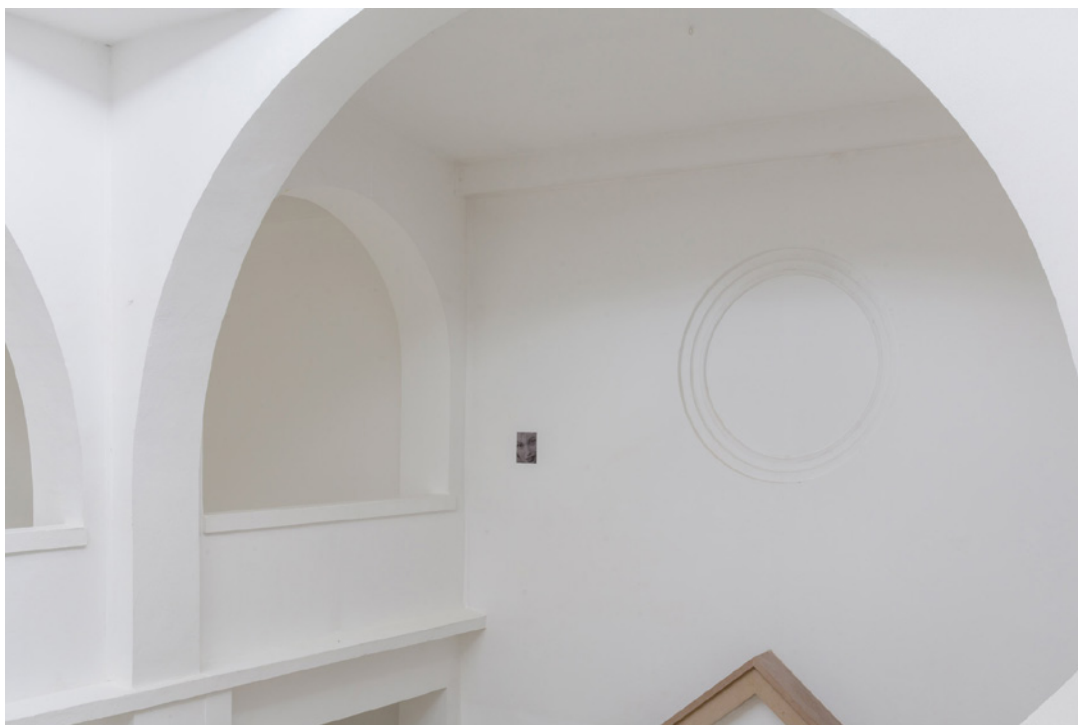
Vue de l'exposition Josy's Club de Pierre-Olivier Arnaud et Denis Savary, centre d'art contemporain - la synagogue de Delme, 2023.