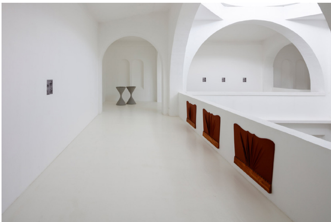
Vue de l'exposition Josy's Club de Pierre-Olivier Arnaud et Denis Savary, centre d'art contemporain - la synagogue de Delme, 2023.