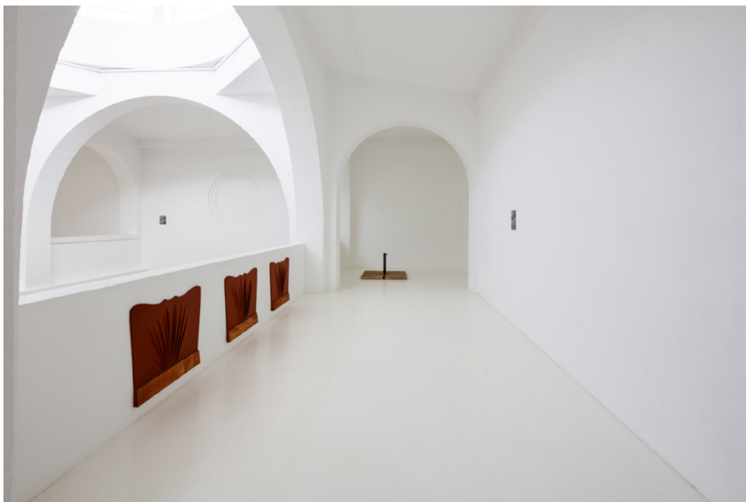
Vue de l'exposition Josy's Club de Pierre-Olivier Arnaud et Denis Savary, centre d'art contemporain - la synagogue de Delme, 2023.