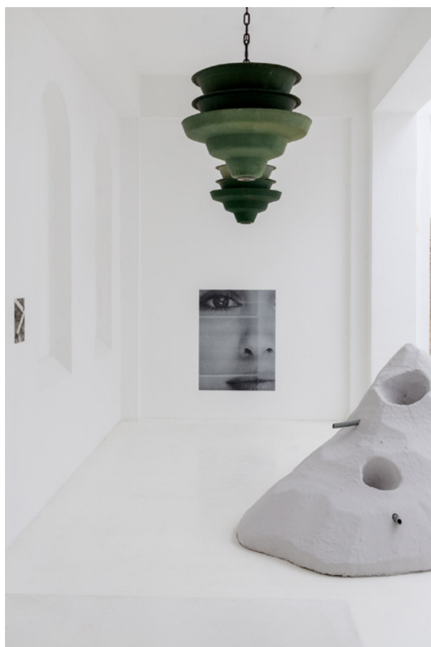
Vues de l'exposition Josy's Club de Pierre-Olivier Arnaud et Denis Savary, centre d'art contemporain - la synagogue de Delme, 2023.