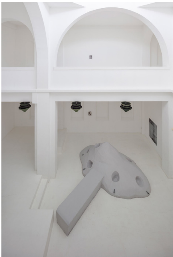
Vues de l'exposition Josy's Club de Pierre-Olivier Arnaud et Denis Savary, centre d'art contemporain - la synagogue de Delme, 2023.