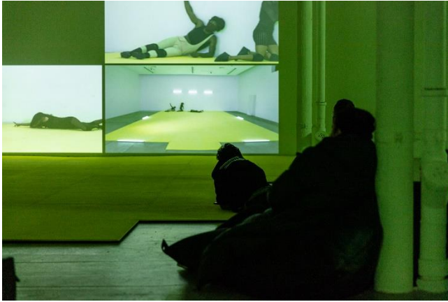
09_LigiaLewis_deaderthandead LIGIA LEWIS deader than dead, 2020

Mixed-Media-Performance dokumentiert auf HD-Video, Farbe, Ton, 19:39 Min. / Mixed- media performance documented on HD video, color, sound, 19:39 min.