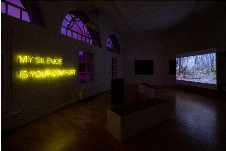
17_01_An Overture of Grief and Joy_ Photo Marek Kruszewski An Overture of Grief and Joy, 2022, Exhibition view Kunstverein Braunschweig 2022 Courtesy: die Künstlerinnen und Grandfilm / the artist and Grandfilm