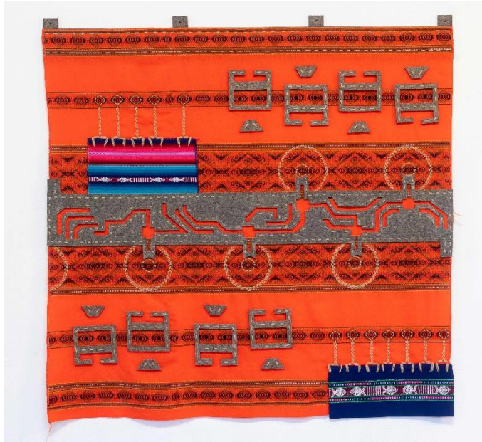
12_MarcelaMoraga_SunsetatTailingsDam MARCELA MORAGA Sunset at the Tailings Dam , 2019 mit Wolle und Garn bestickte Awayo und Filz Größe: 110 x 110 cm