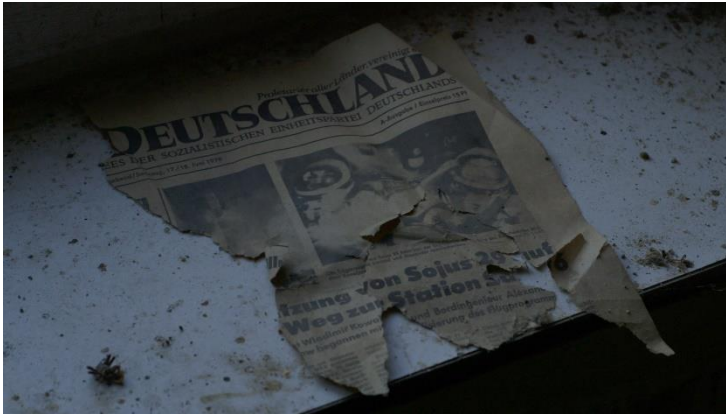
15_UteAdamczewski_Zustand undGelände UTE ADAMCZEWSKI Zustand und Gelände, 2021 Dokumentarfilm, 118 Min. / Documentary, 118 min. Videostill