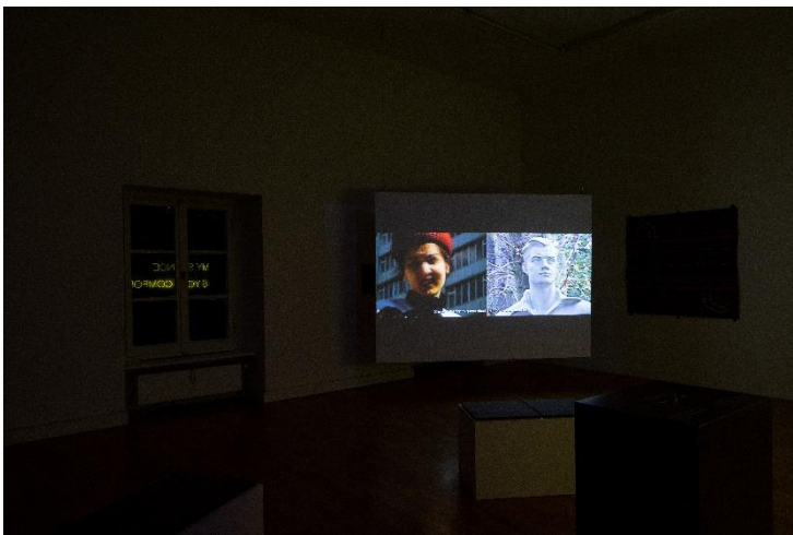
16_An Overture of Grief and Joy_ An Overture of Grief and Joy, 2022, Exhibition view Kunstverein Braunschweig 2022