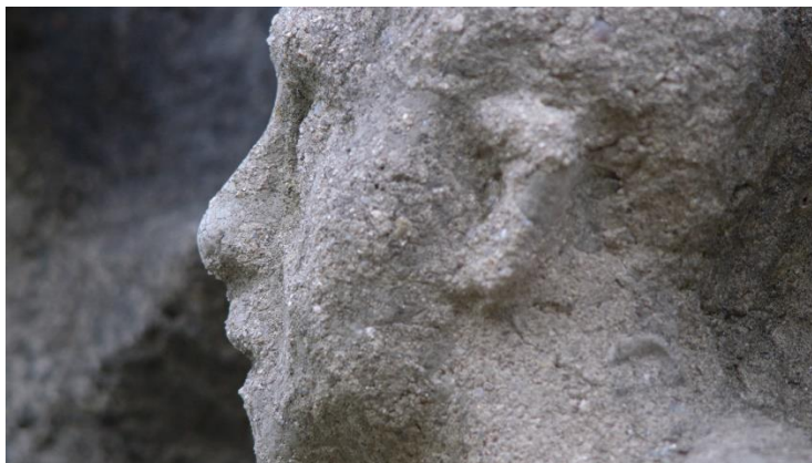
13_UteAdamczewski_Zustand undGelände UTE ADAMCZEWSKI Zustand und Gelände , 2021 Dokumentarfilm, 118 Min. / Documentary, 118 min. Videostill