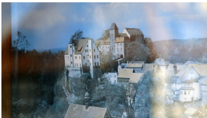
14_UteAdamczewski_Zustand undGelände UTE ADAMCZEWSKI Zustand und Gelände , 2021 Dokumentarfilm, 118 Min. / Documentary, 118 min. Videostill