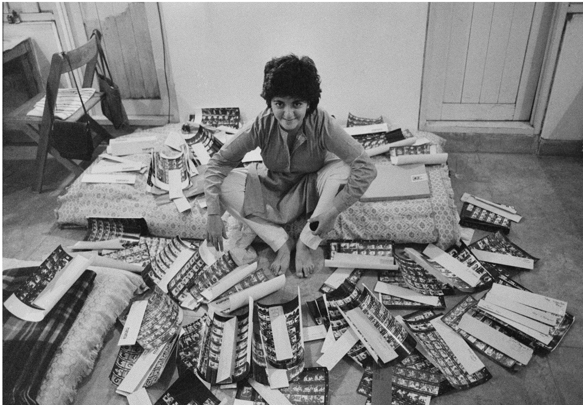
Dayanita Singh Let's See , 2021