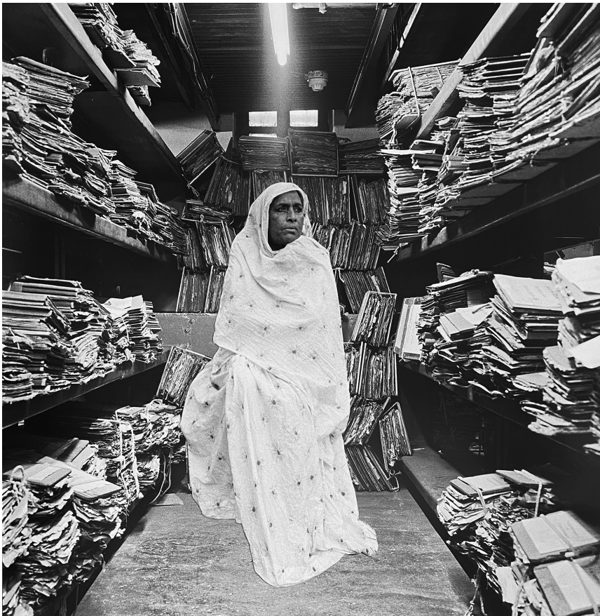
Dayanita Singh, Mona Montage VII , 2021