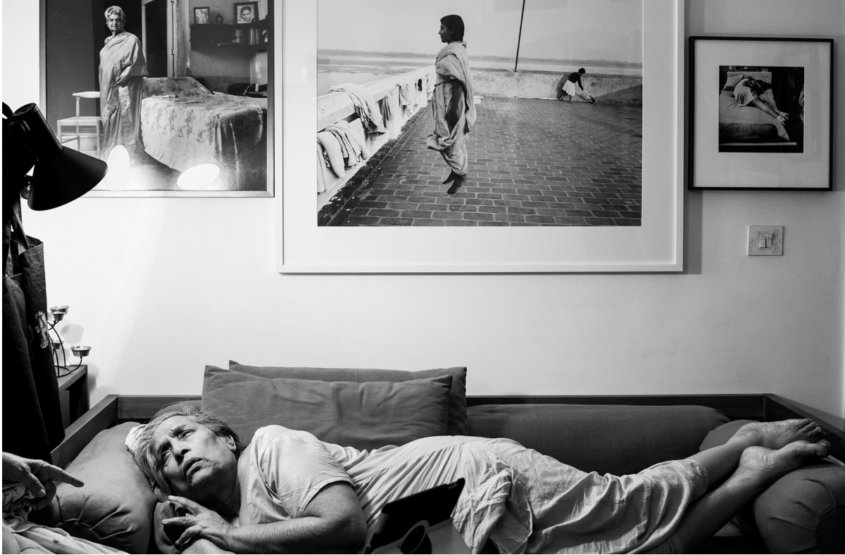
Dayanita Singh Museum of Chance , 2013 © Dayanita Singh