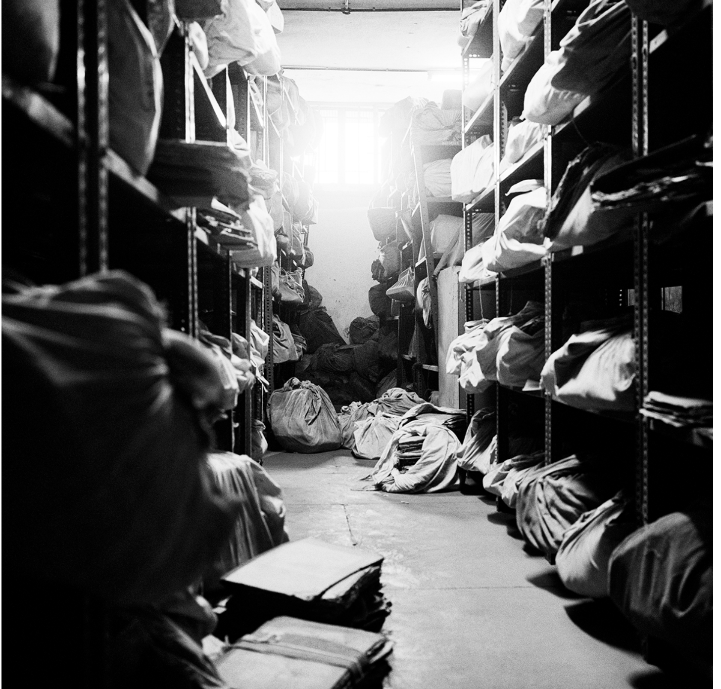
Dayanita Singh, File Museum , 2012 © Dayanita Singh