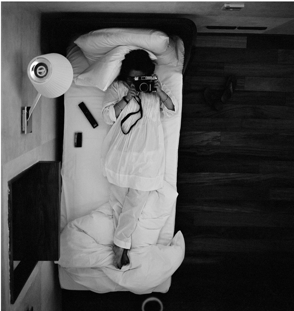
Dayanita Singh Museum of Chance , 2013