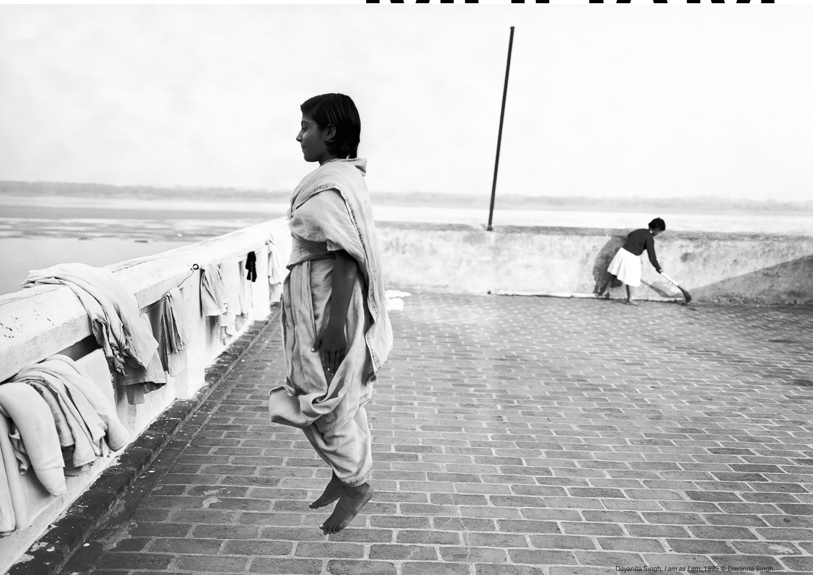
Dayanita Singh, I am as I am , 1999

Dossier de presse Pressedossier Press Kit