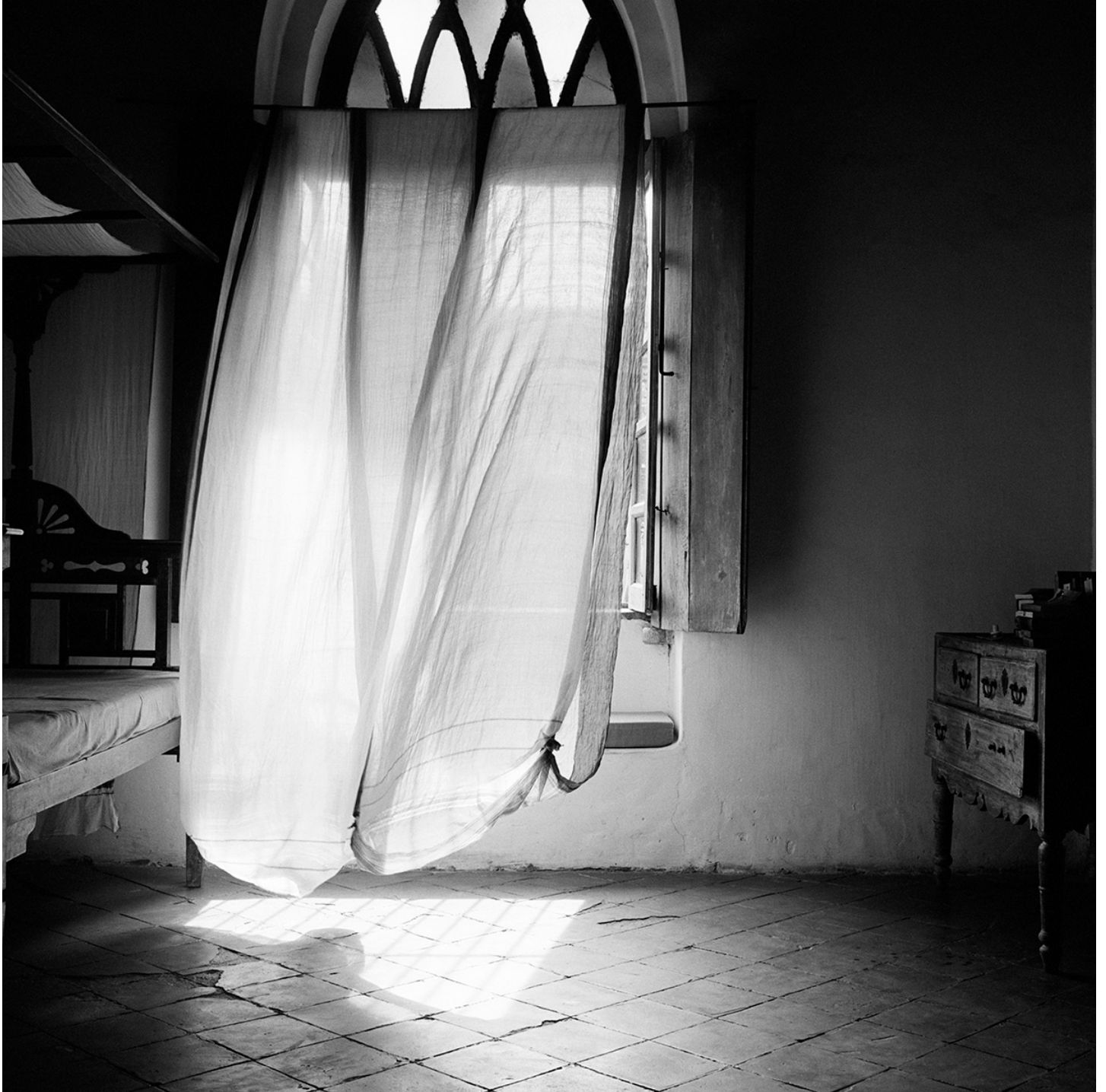
Dayanita Singh, Museum of Chance , 2013