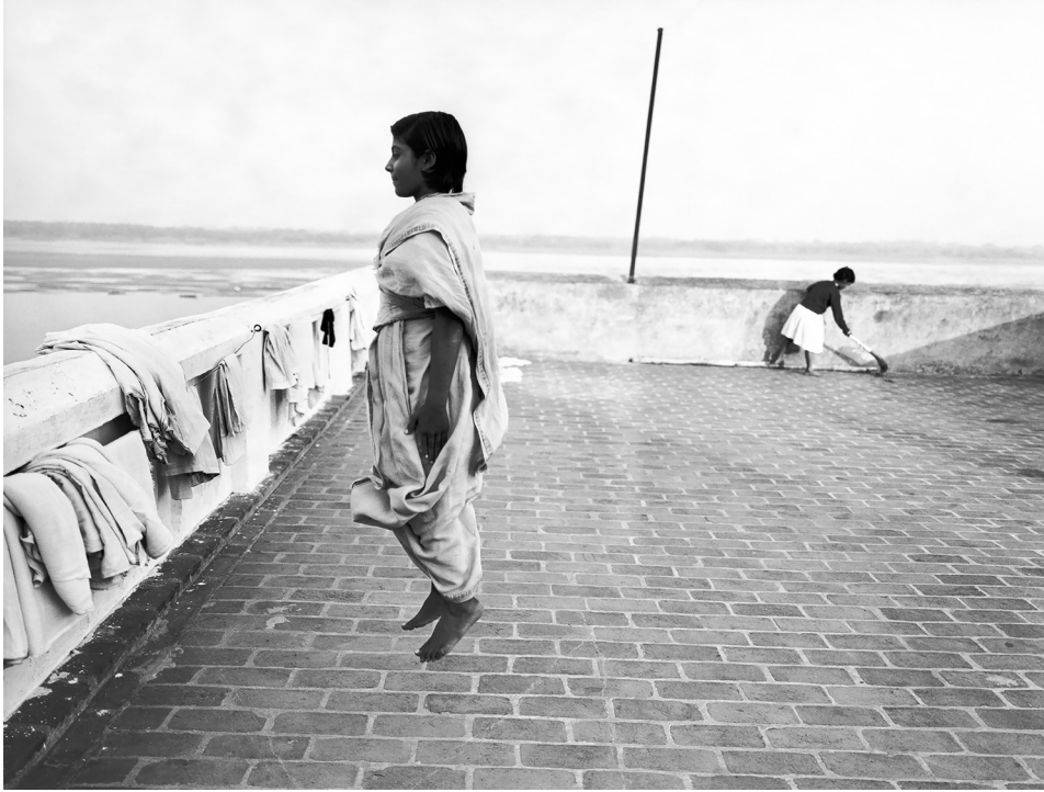
Dayanita Singh, I am as I am , 1999 © Dayanita Singh