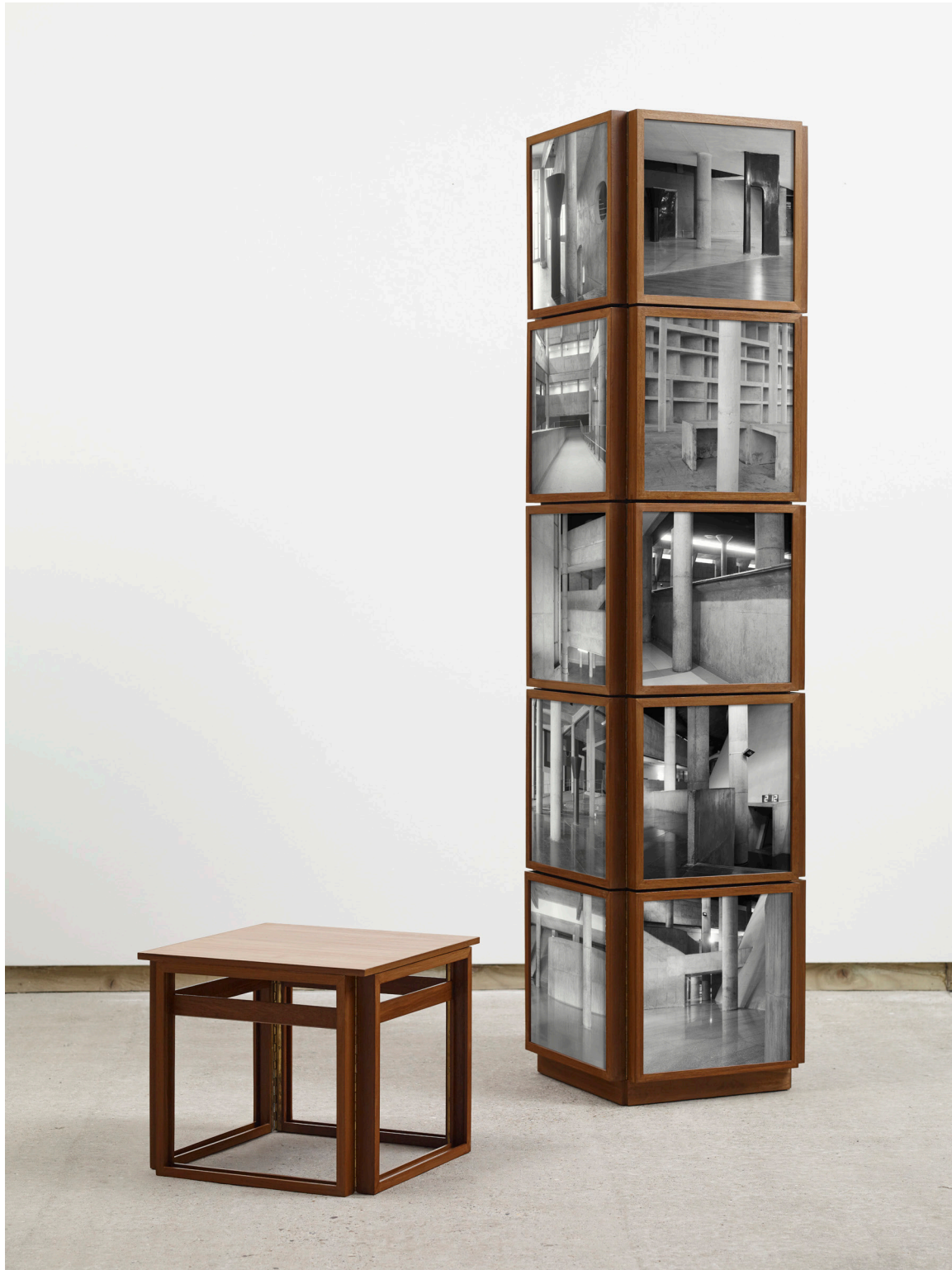
Dayanita Singh, Corbu Pillar , 2021