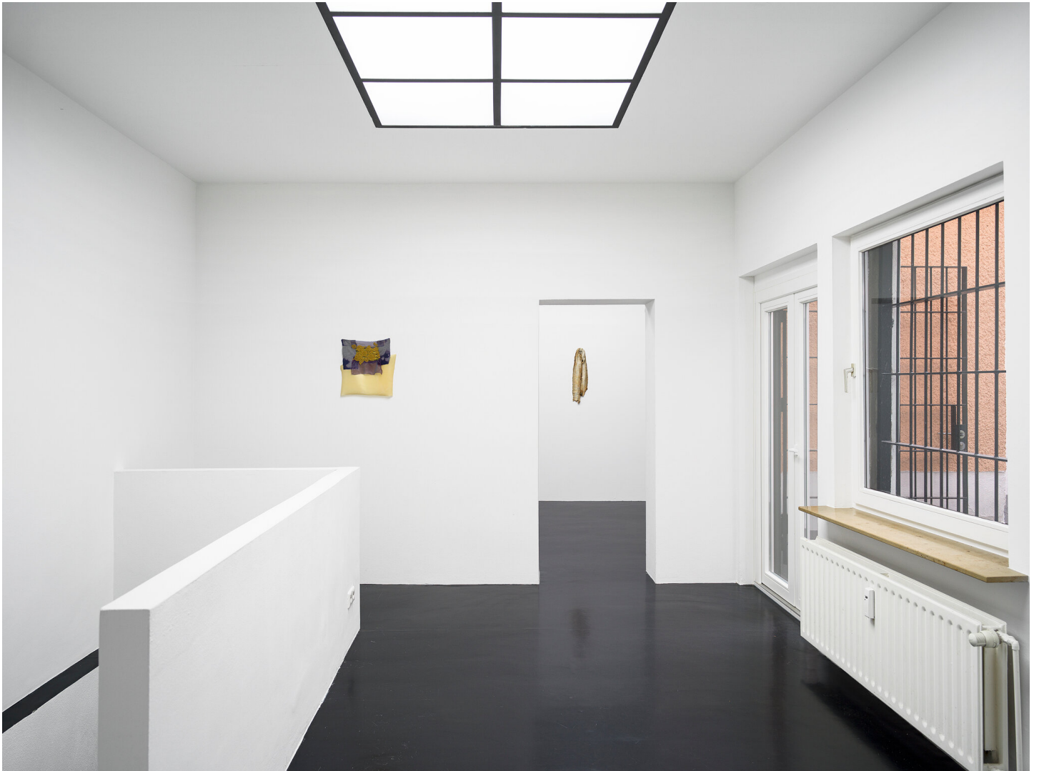
Mutti raucht wieder September 01 - November 04, 2023