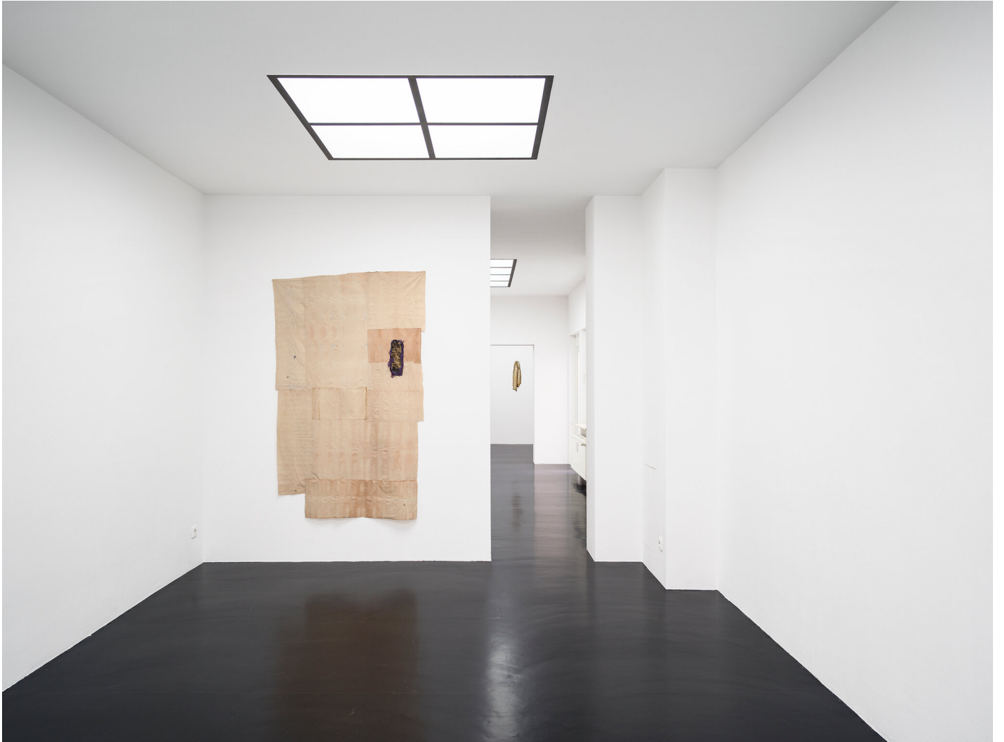
Mutti raucht wieder September 01 - November 04, 2023