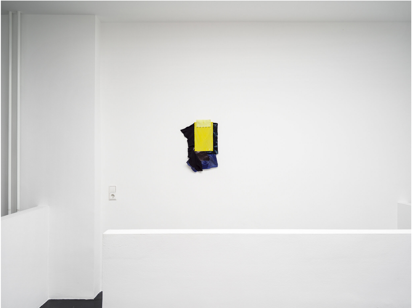
Mutti raucht wieder September 01 - November 04, 2023