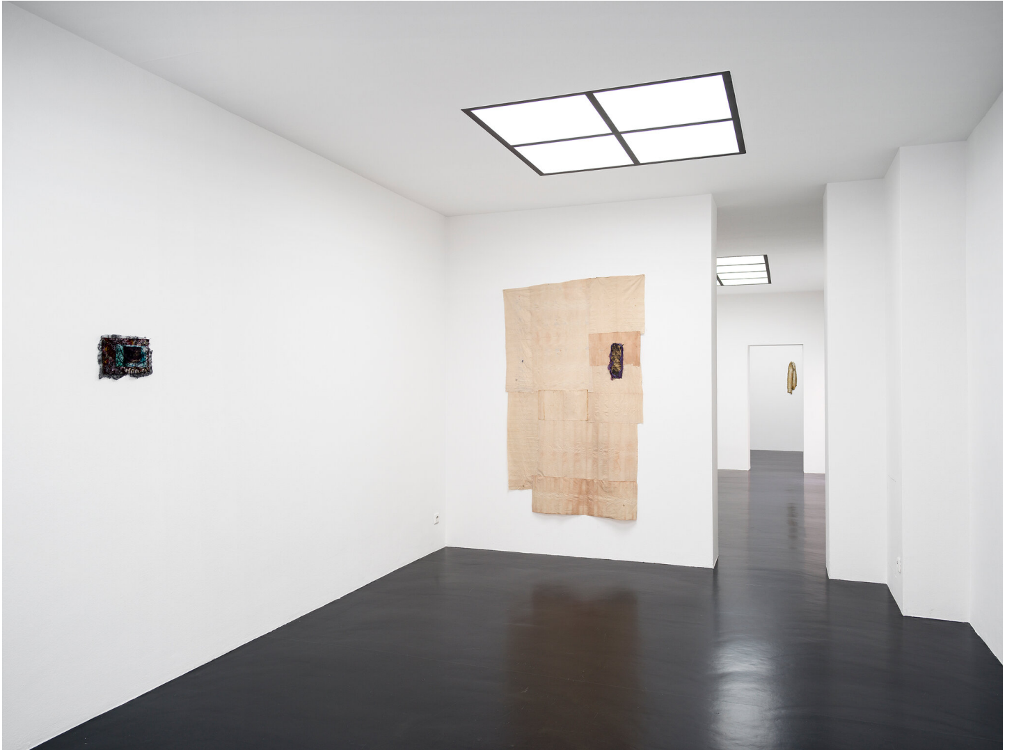
Mutti raucht wieder September 01 - November 04, 2023