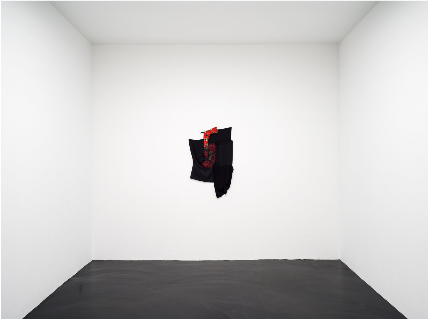
Mutti raucht wieder September 01 - November 04, 2023