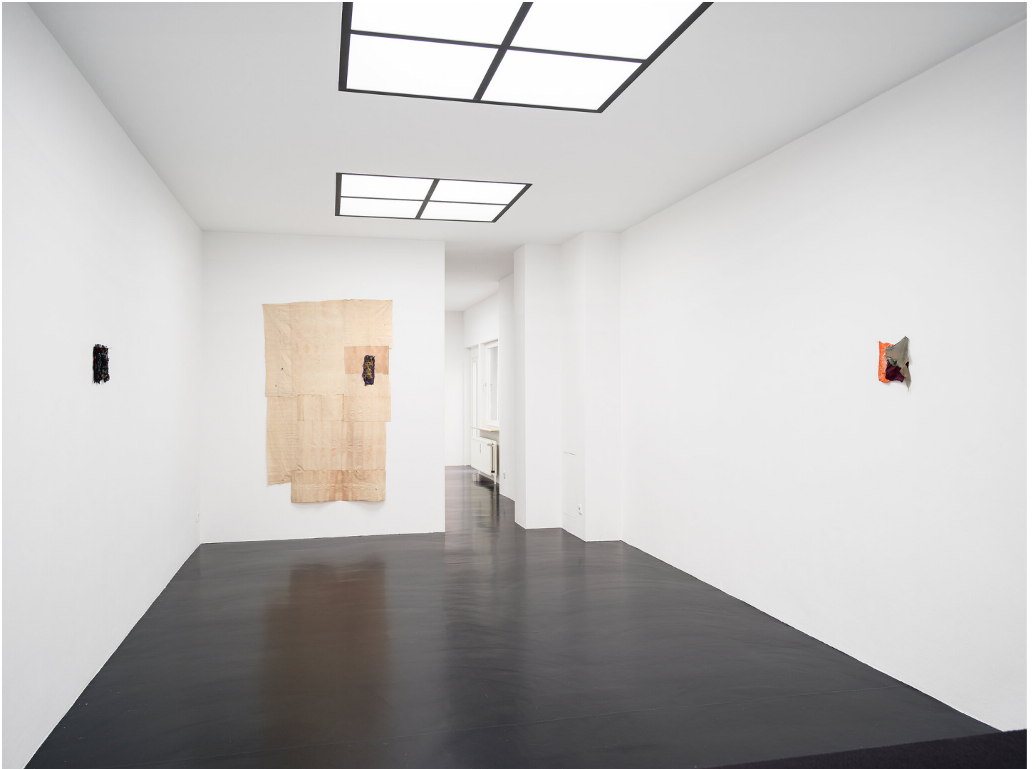
Mutti raucht wieder September 01 - November 04, 2023