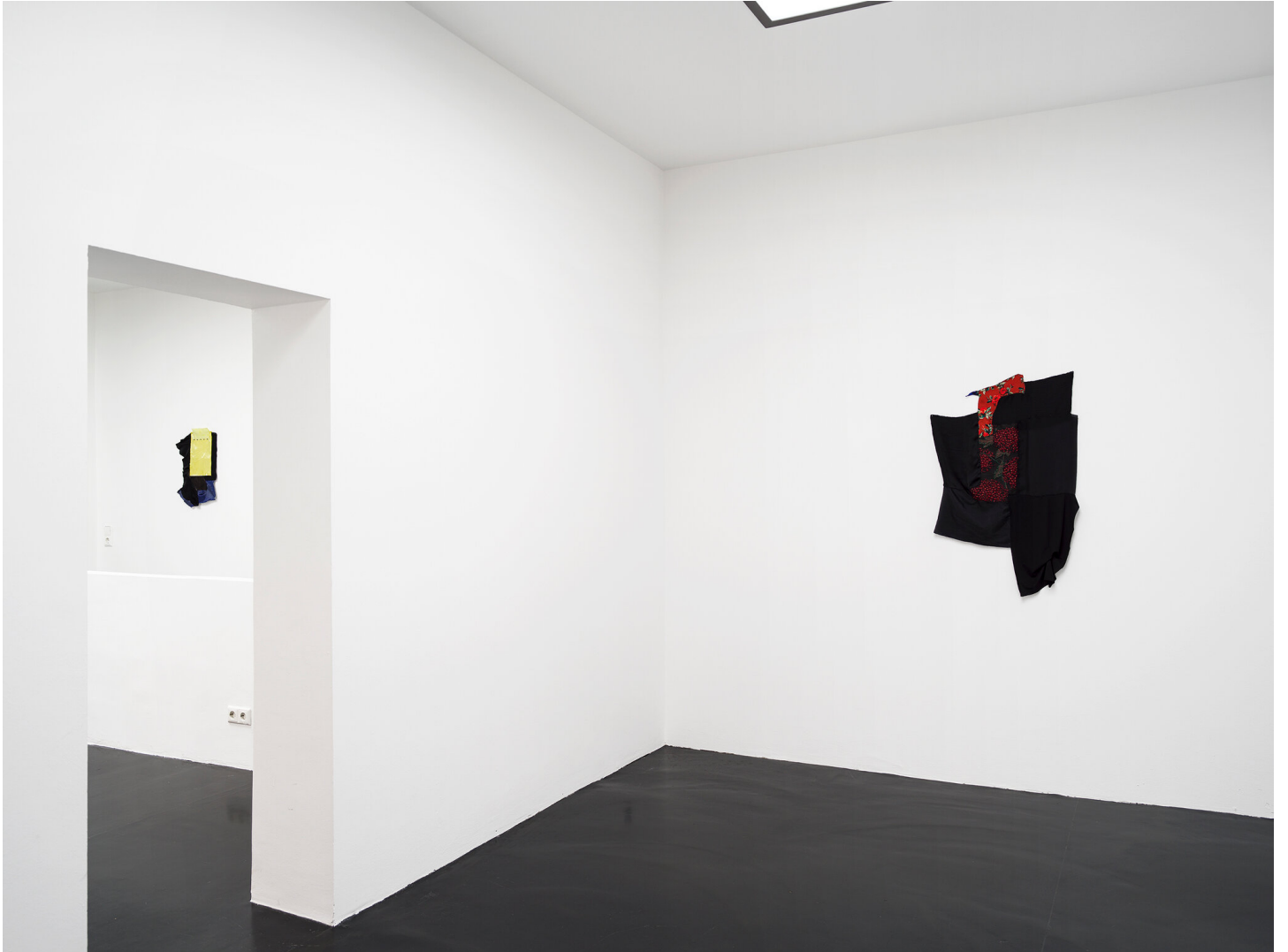
Mutti raucht wieder September 01 - November 04, 2023