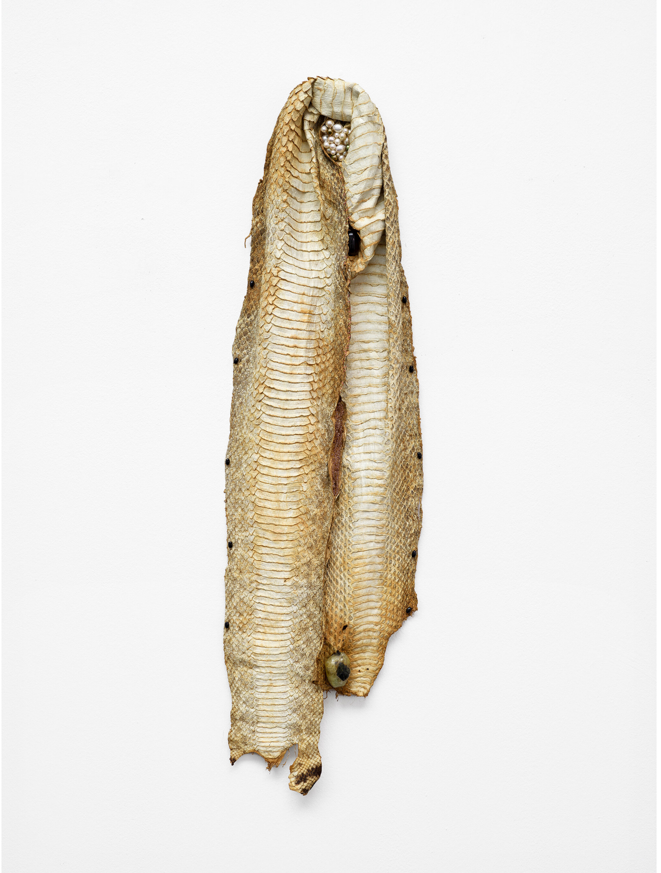
Anna Virnich Untitled , 2023 Snake skin, cultured pearls, glass beads, stone 65 × 18 × 3,5 cm (25 5/8" × 7 1/8" × 1 3/8")