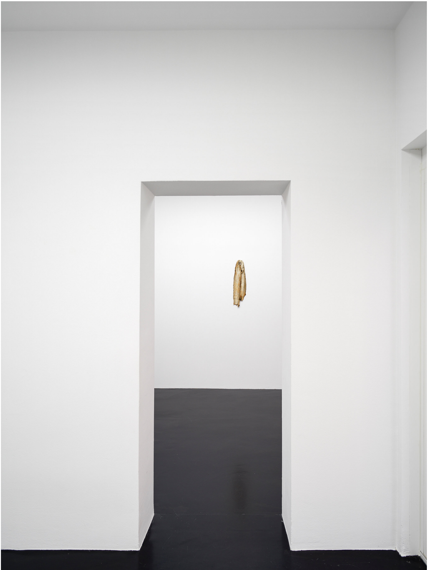
Mutti raucht wieder September 01 - November 04, 2023