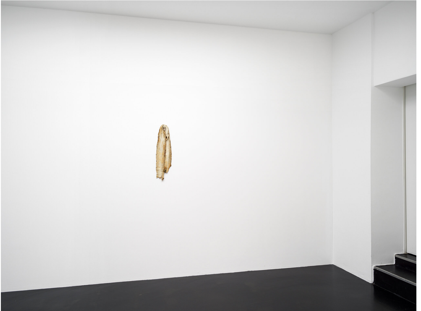
Mutti raucht wieder September 01 - November 04, 2023