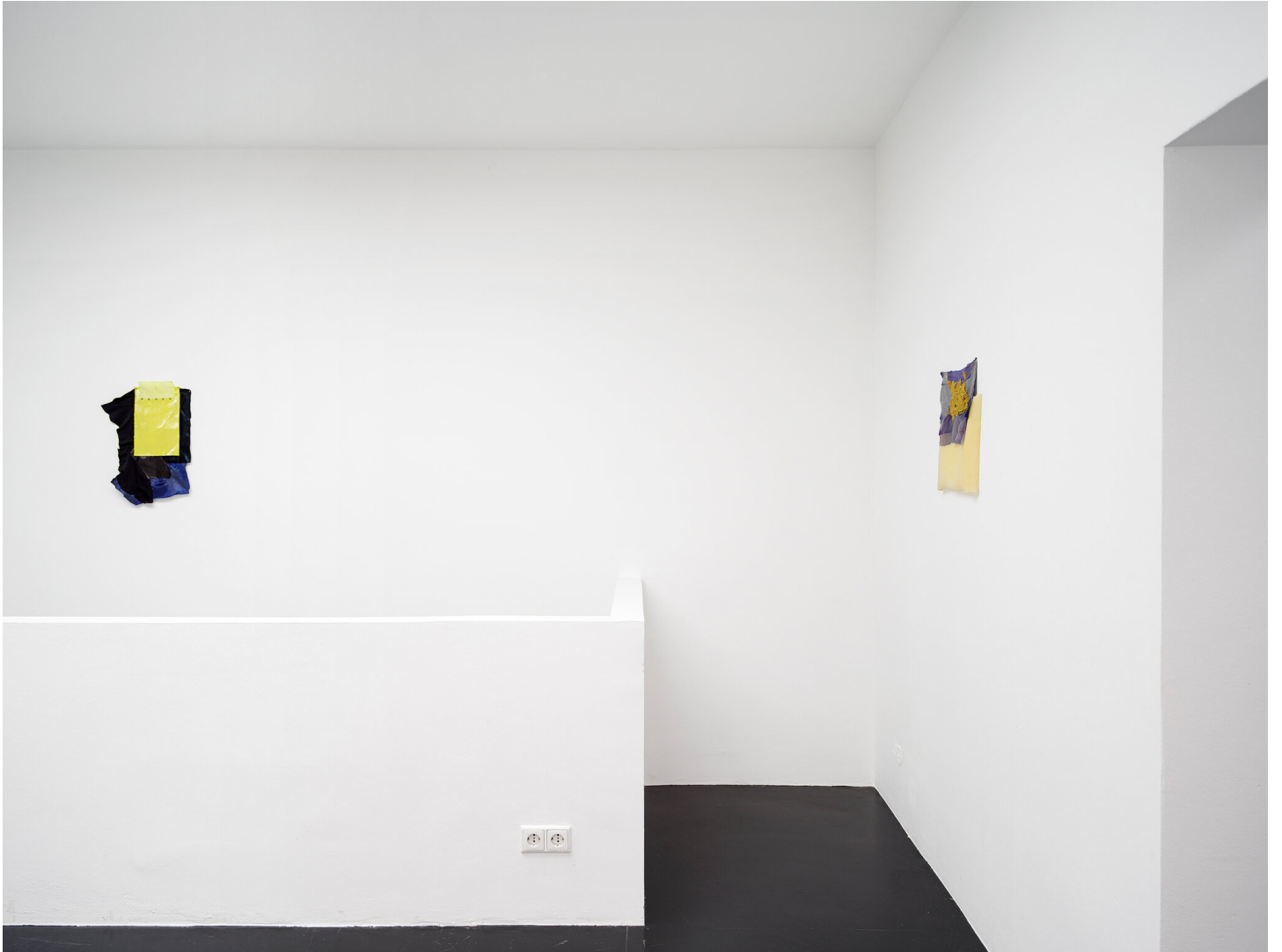
Mutti raucht wieder September 01 - November 04, 2023