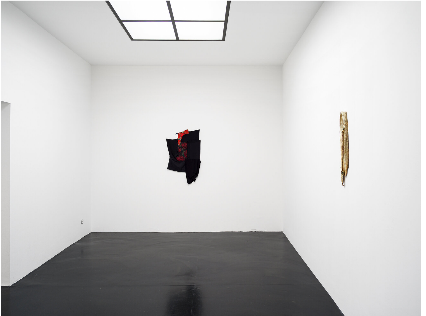
Mutti raucht wieder September 01 - November 04, 2023