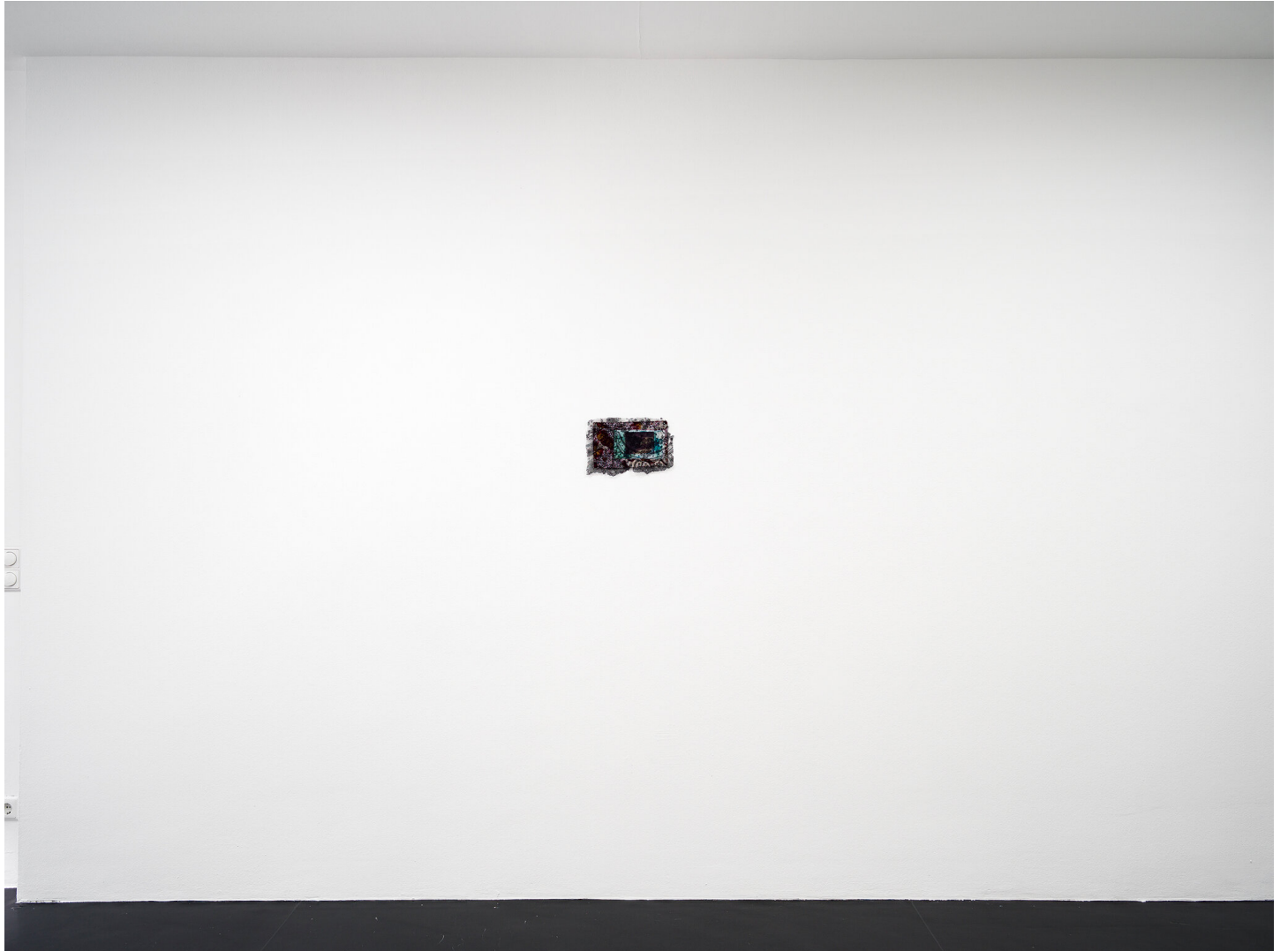
Mutti raucht wieder September 01 - November 04, 2023