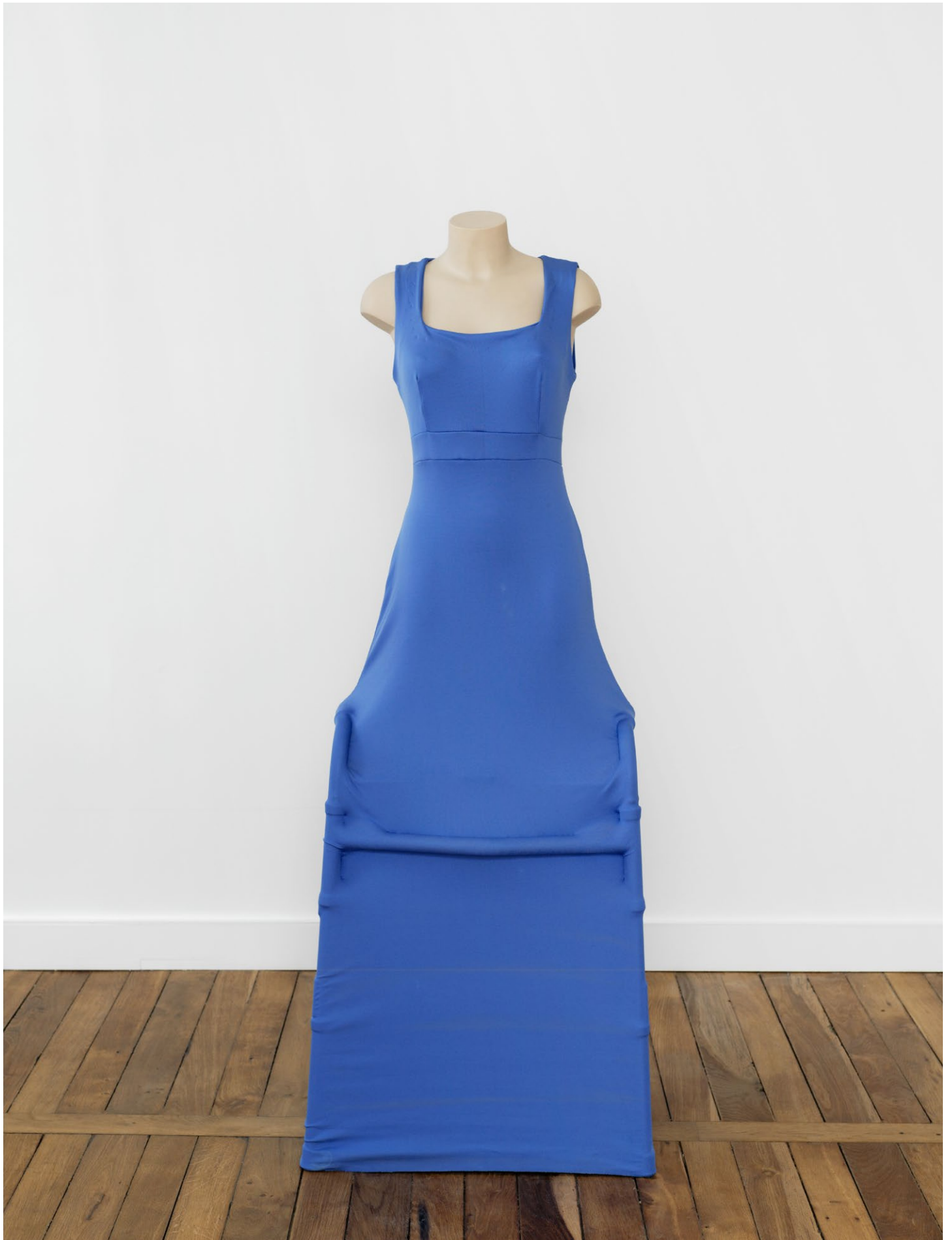
Shana Moulton, OSAM = She is healed , 2013 Walker, mannequin, fabric, 163 × 52 × 35 cm Courtesy the artist and Crève-cœur, Paris. Photo: Aurélien Mole