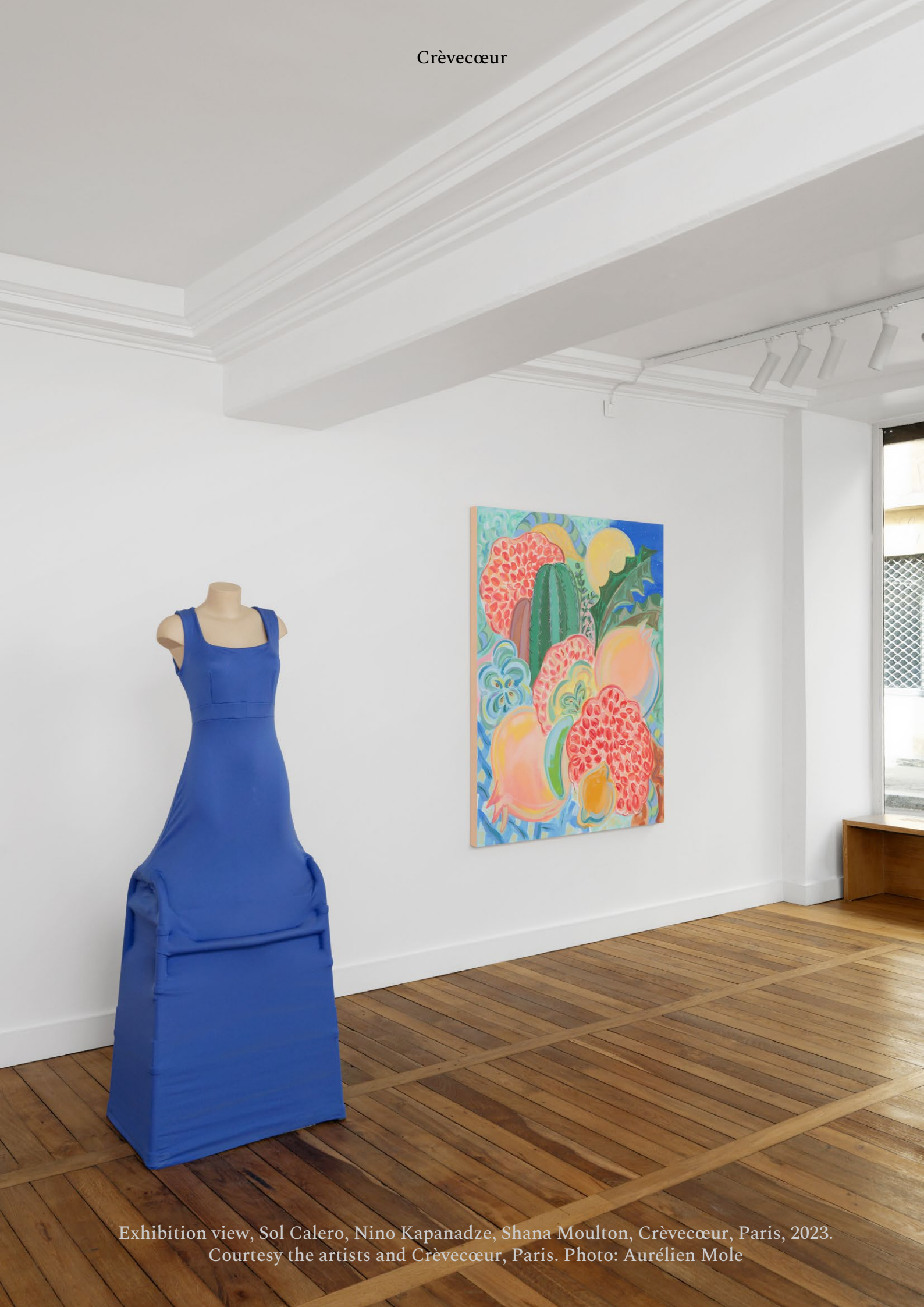
Exhibition view, Sol Calero, Nino Kapanadze, Shana Moulton, Crèvecœur, Paris, 2023.