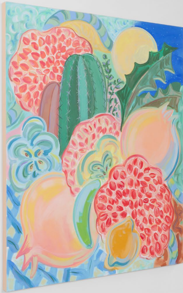
Exhibition view, Sol Calero, Nino Kapanadze, Shana Moulton, Crèveœur, Paris, 2023.