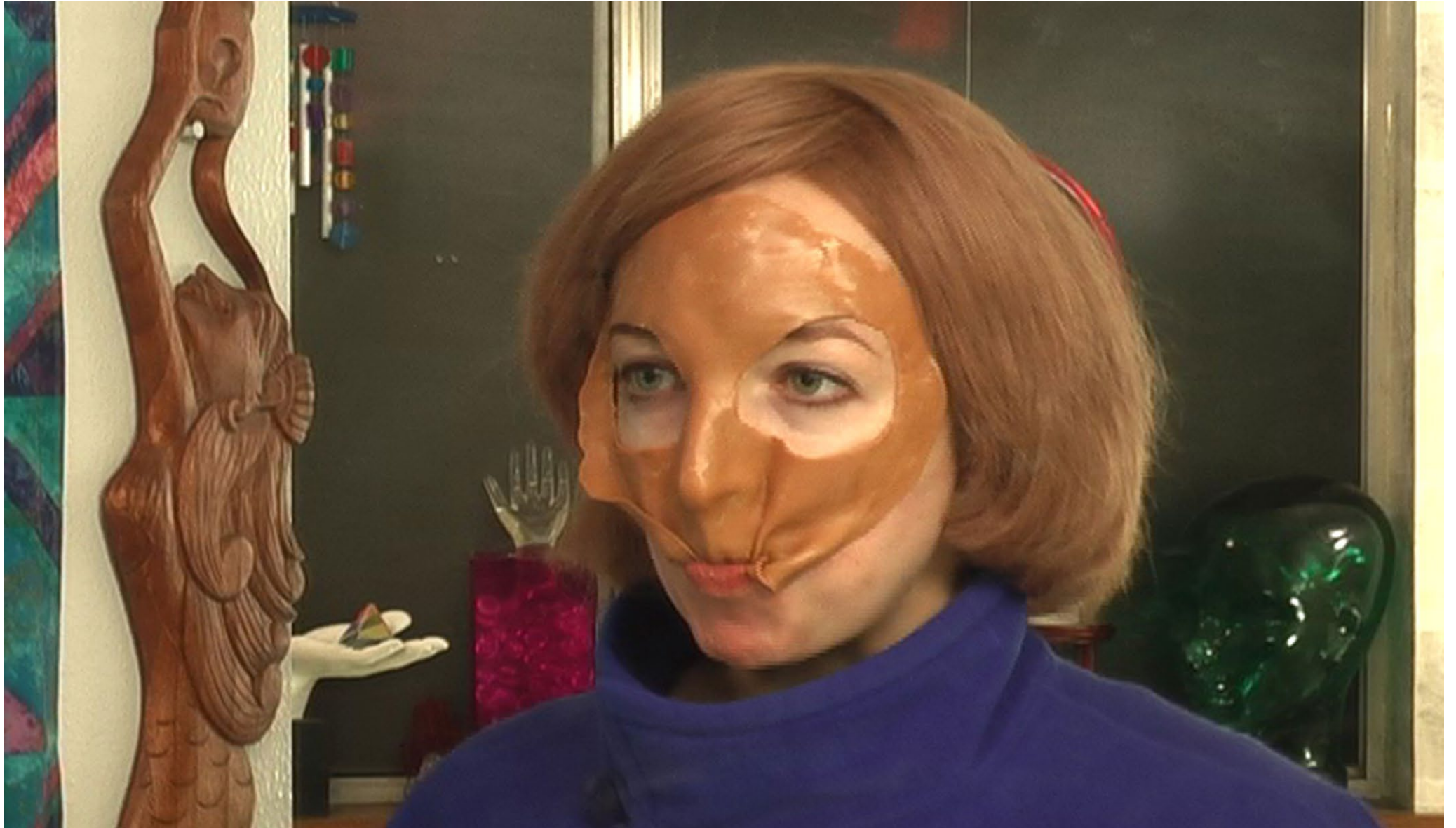
Shana Moulton, Sand Saga , 2008 Video SD 4:3, 10:29 min, 2/3 + 2 AP