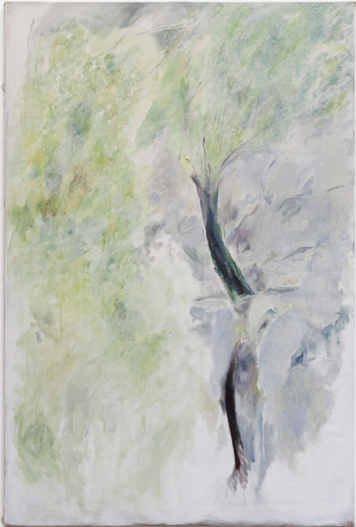
Nino Kapanadze Tree, tree, dry and green, 2022 Oil on linen, 195 × 130 cm