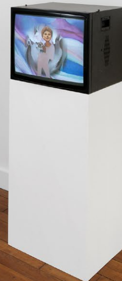
Exhibition view, Sol Calero, Nino Kapanadze, Shana Moulton , Crèvecœur, Paris, 2023.