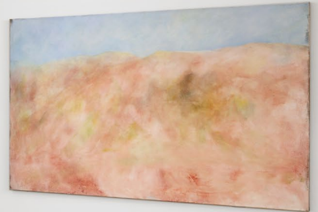
Exhibition view, Sol Calero, Nino Kapanadze, Shana Moulton , Crèveœur, Paris, 2023.