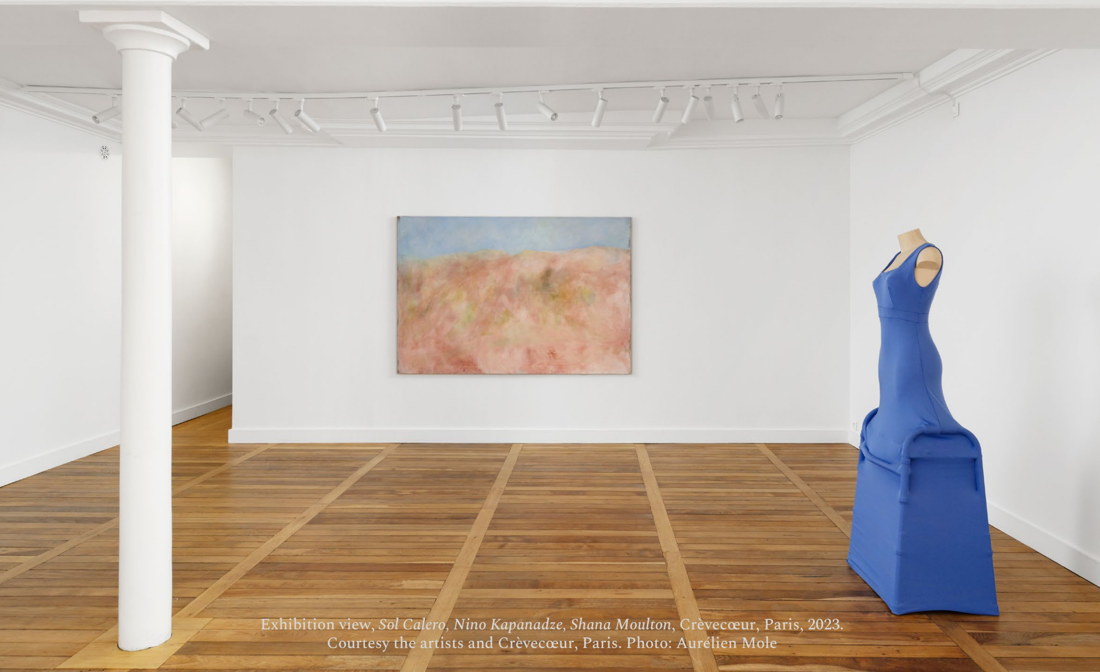
Exhibition view, Sol Calero, Nino Kapanadze, Shana Moulton , Crèveœur, Paris, 2023.