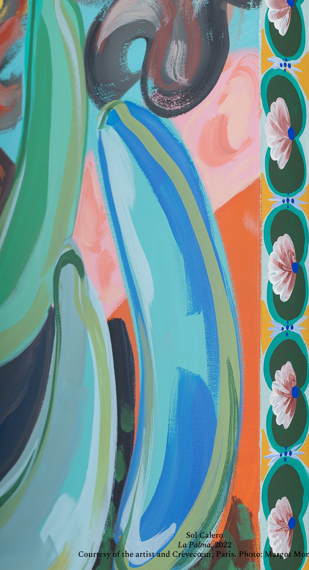
Sol Calero La Palma , 2022