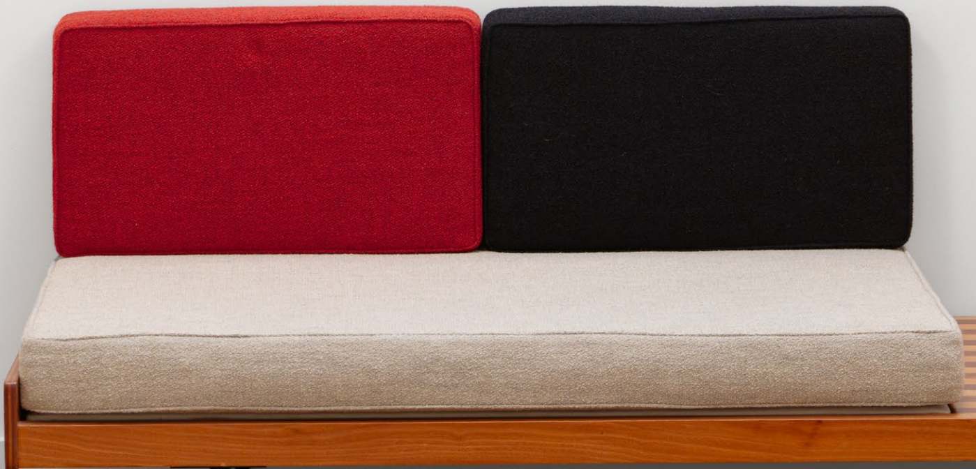
Exhibition view, Sol Calero, Nino Kapanadze, Shana Moulton, Crèveœur, Paris, 2023.