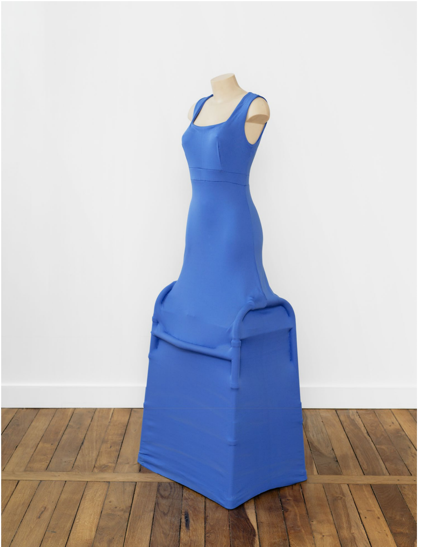
Shana Moulton, OSAM = She is healed , 2013 Courtesy the artist and Crève-cœur, Paris. Photo: Aurélien Mole