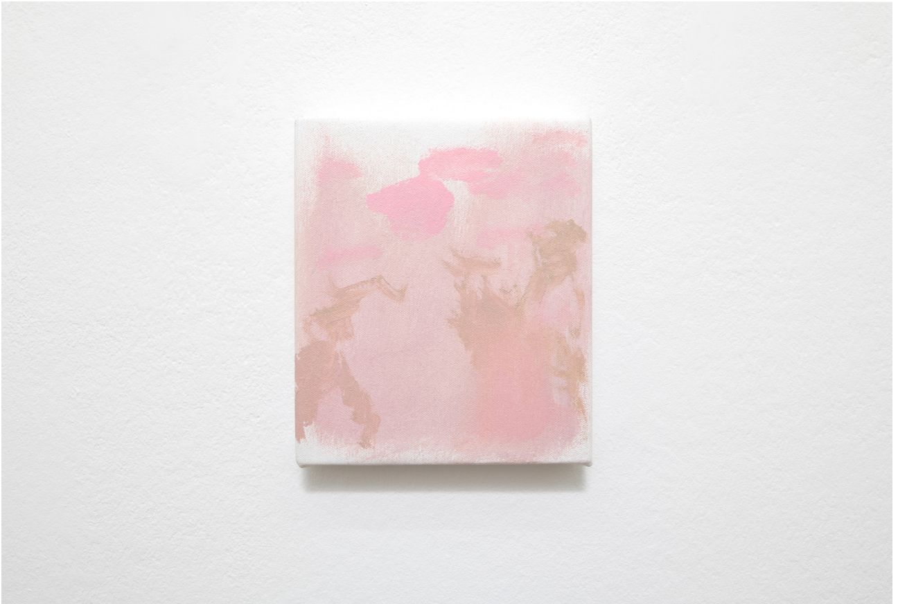
Hudson Valley (Sunset) , 2022 Oil on canvas 18,5 x 15,5 cm