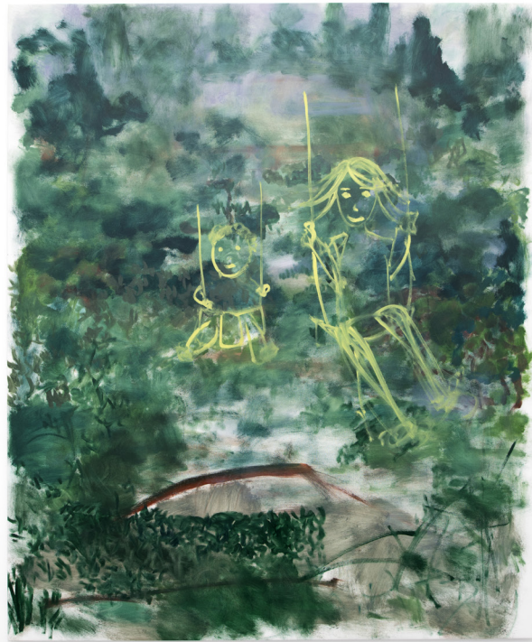
Swinging , 2021 Oil on canvas 220 x 183 cm