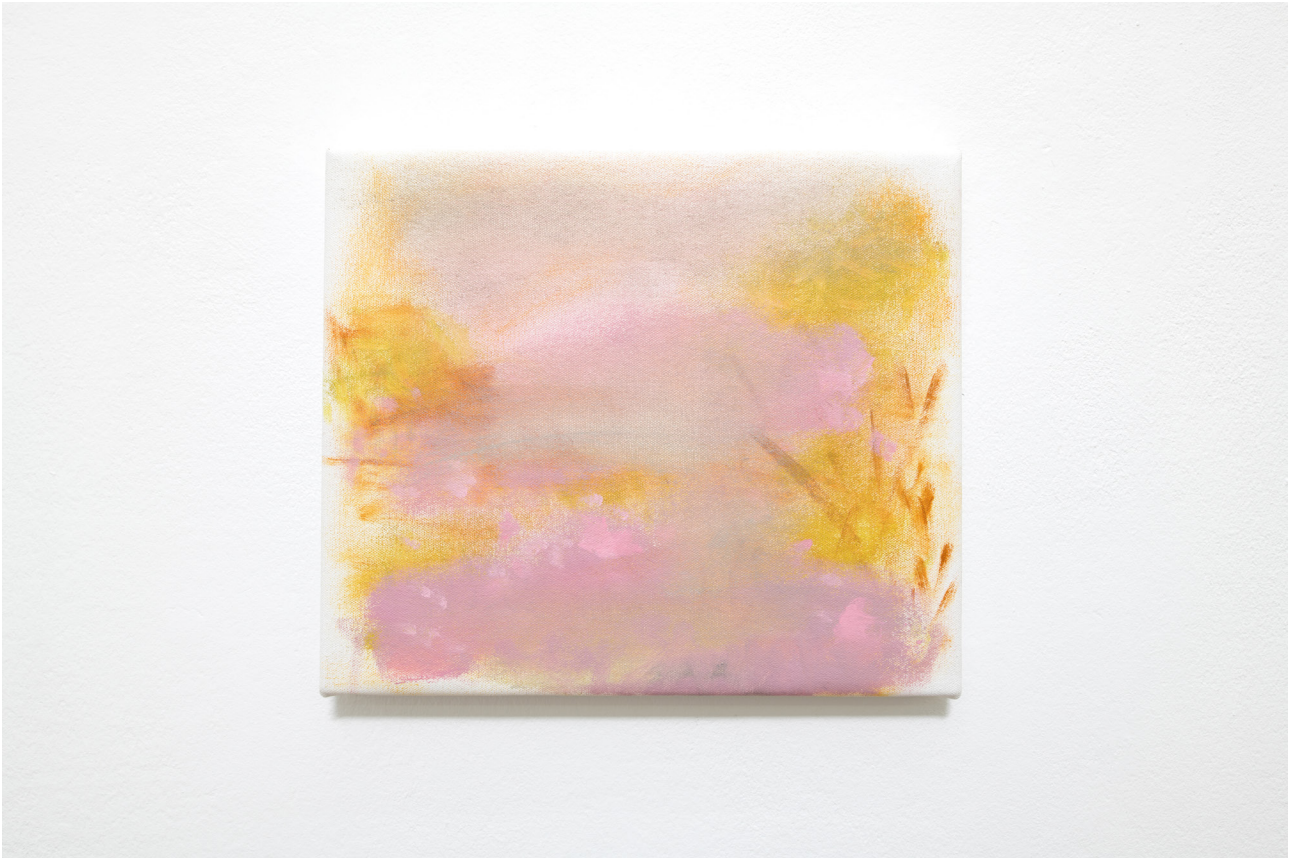
Westchester (Hawaii), 2022 Oil on canvas 28,5 x 33 cm