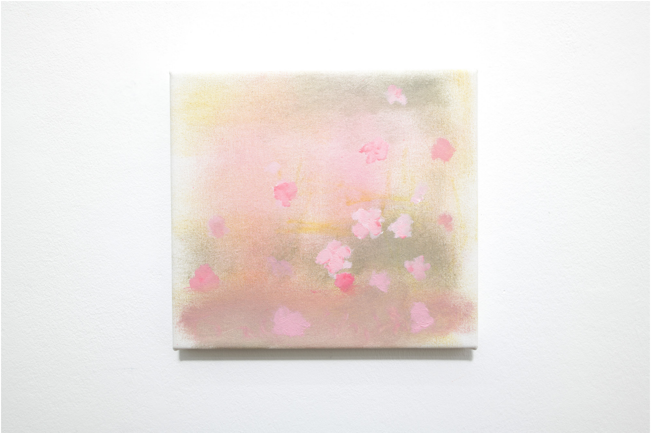
Hudson River (Oahu), 2022 Oil on canvas 28,5 x 31 cm