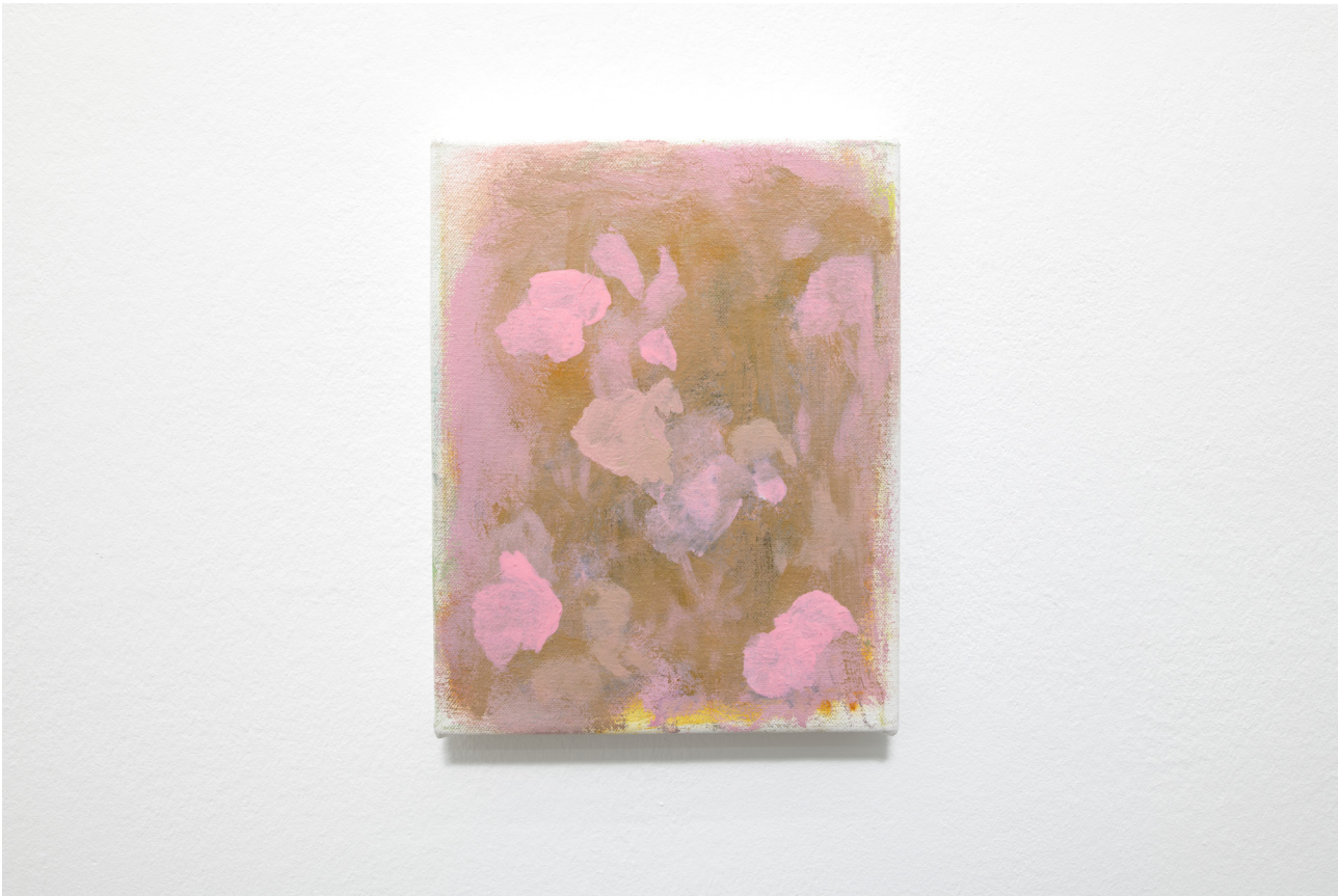
Flowers, 2022 Oil on canvas 23,5 x 18,5 cm