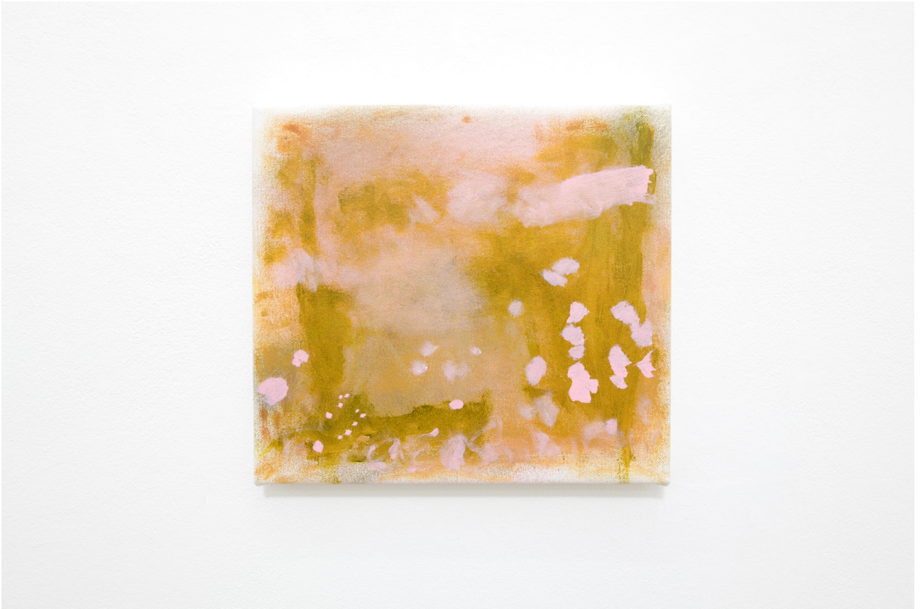
Sleepy Hollow (Maui) , 2022 Oil on canvas 28,5 x 31 cm