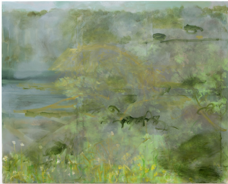
Hometown, 2021 Oil on canvas 136 x 170 cm