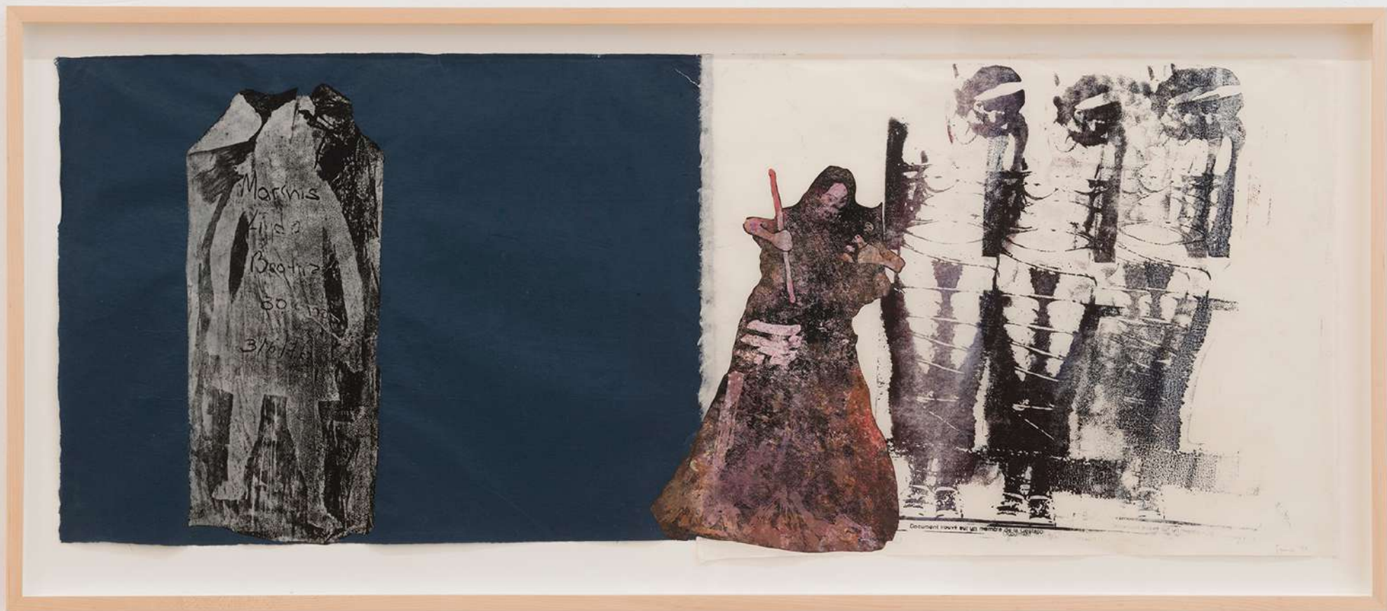
Death Figure/Gestapo , 1994 Handprinting and printed collage on paper 49,5 x 125,7 cm (19 ½ x 49 ½ inches)