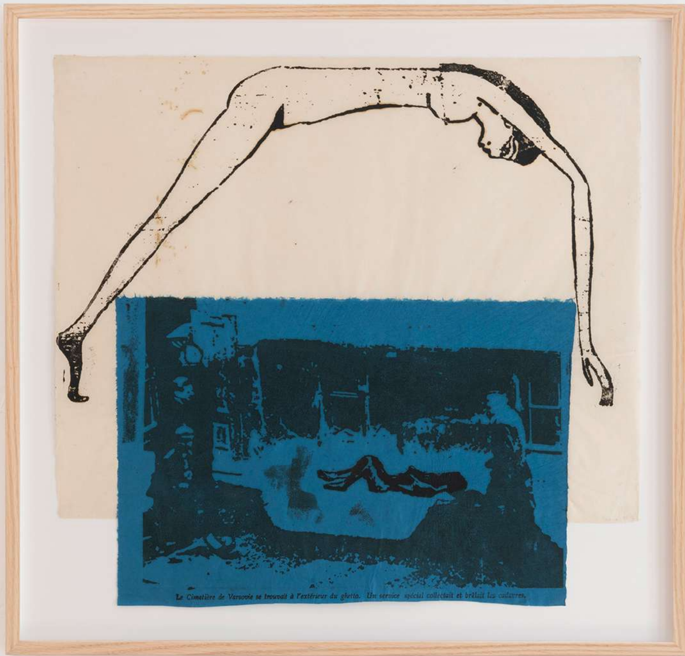
Nancy Spero The Goddess Nut / Le Cimetière de Varsovie... , 1995-96 Handprinting and printed collage on paper 58,4 × 61,6 cm