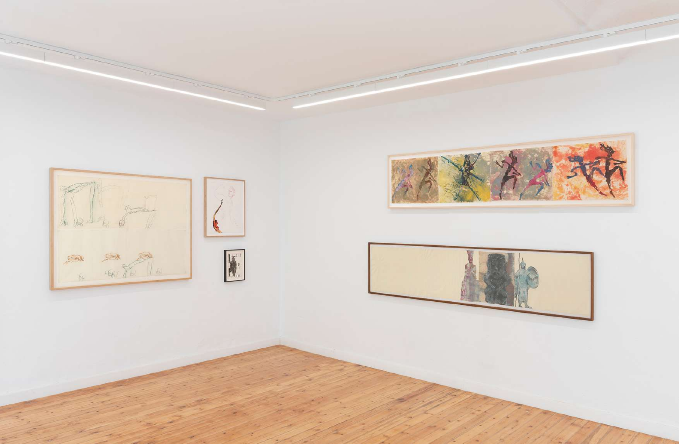
Vista de la instalación en NoguerasBlanchard Madrid