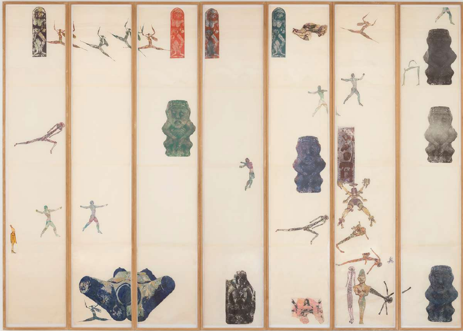
Nancy Spero Propitiatory , 1993 Grupo de siete paneles; impresión manual y collage impreso sobre papel 289 x 405,3 x 4,6 cm