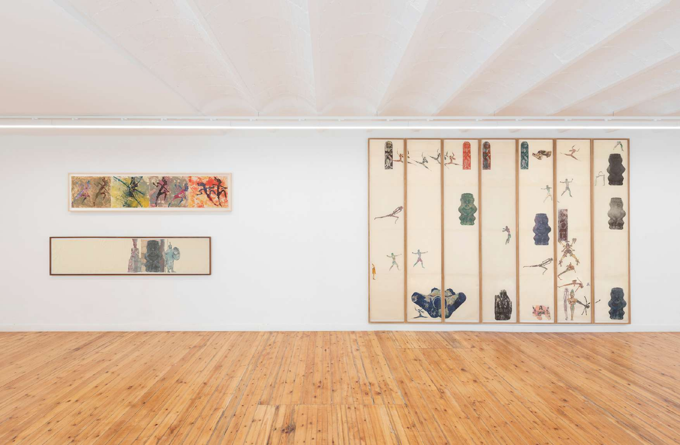
Vista de la instalación en NoguerasBlanchard Madrid