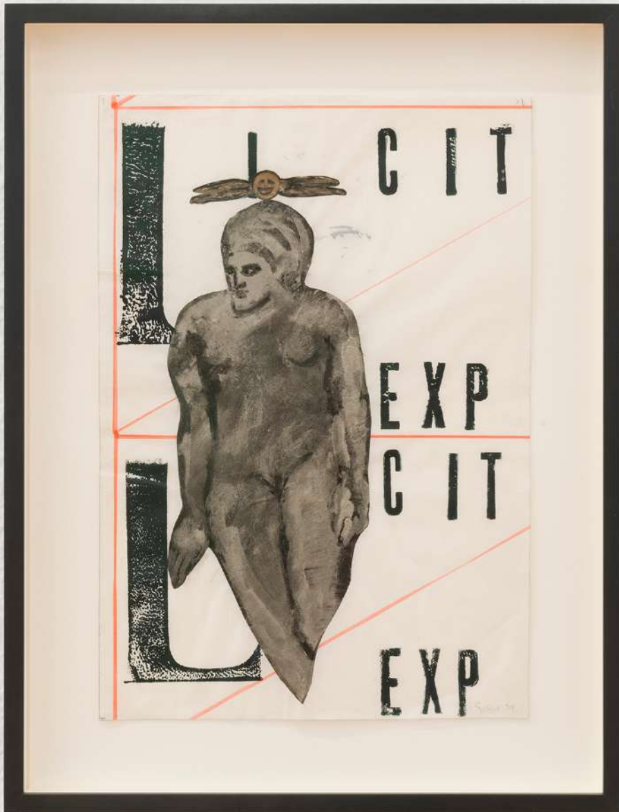
Nancy Spero Licit Exp , 1974 Handprinting and gouache collage on paper 38,7 x 29 x 4,1 cm