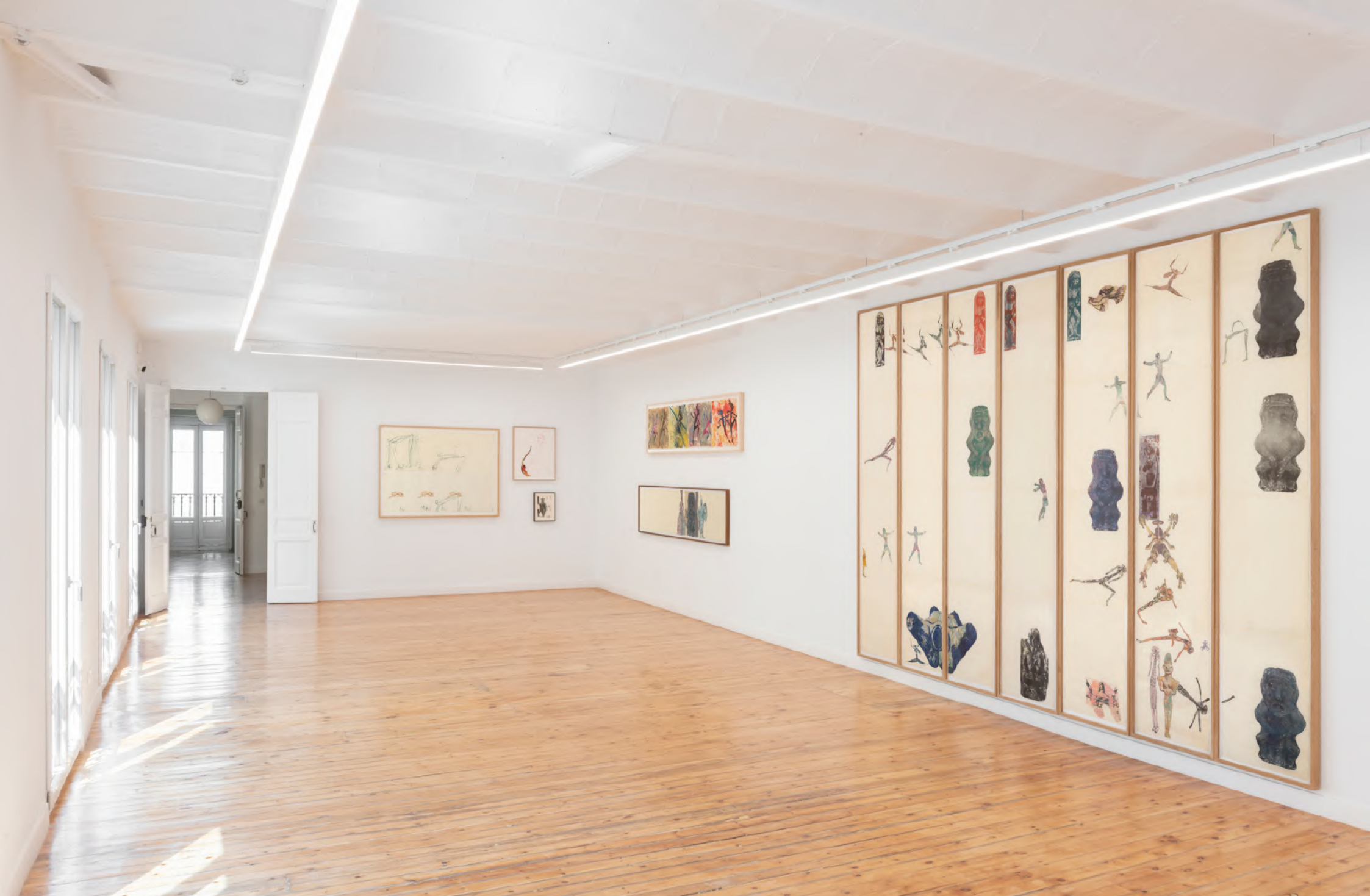
Vista de la instalación en NoguerasBlanchard Madrid