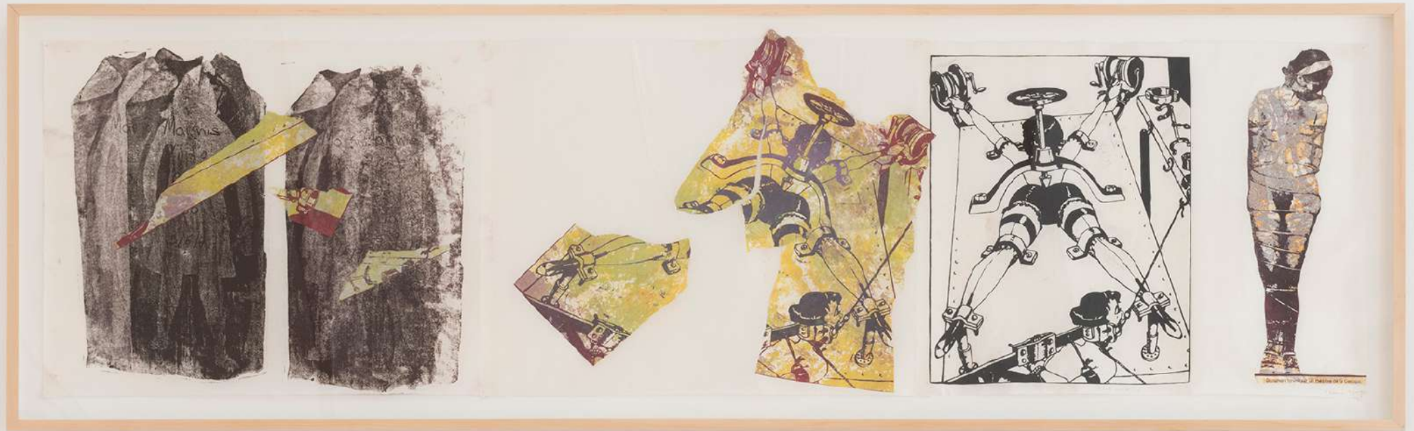
Nancy Spero Real Politics , 1991-92 Handprinting and printed collage on paper 49,5 × 182,9 cm (19 ½ × 72 inches)