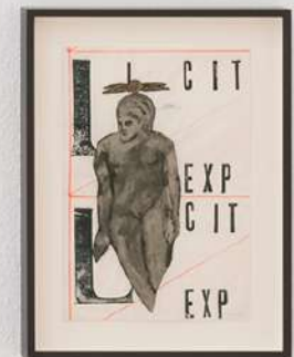
Vista de la instalación en NoguerasBlanchard Madrid