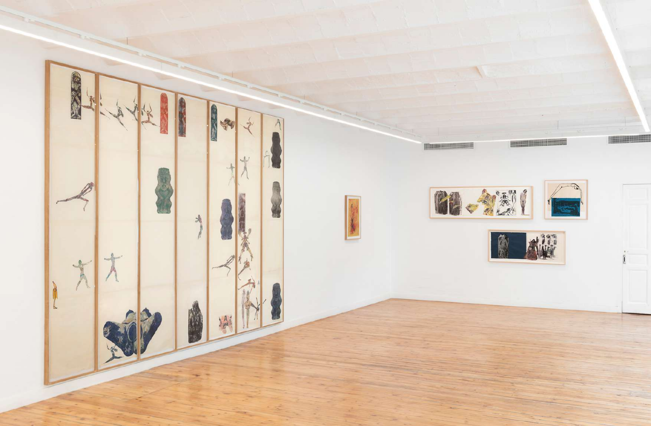
Vista de la instalación en NoguerasBlanchard Madrid