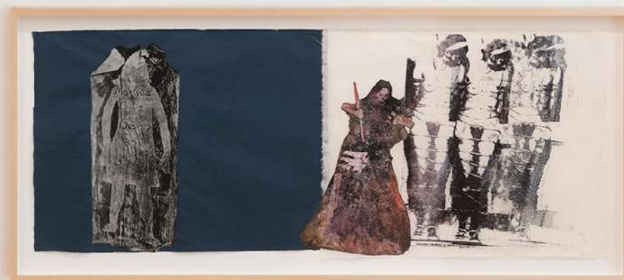
Vista de la instalación en NoguerasBlanchard Madrid