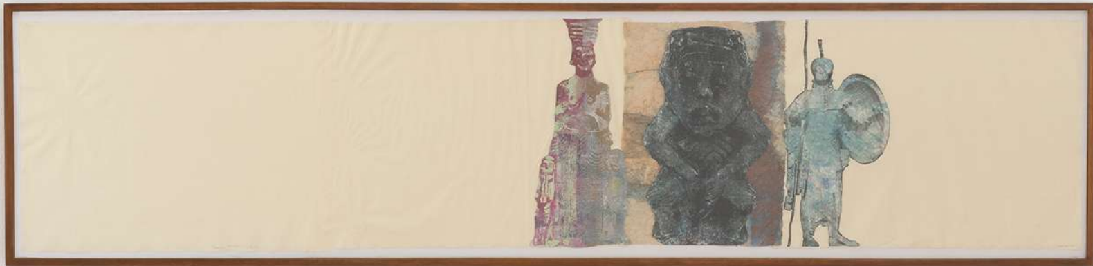
Vista de la instalación en NoguerasBlanchard Madrid