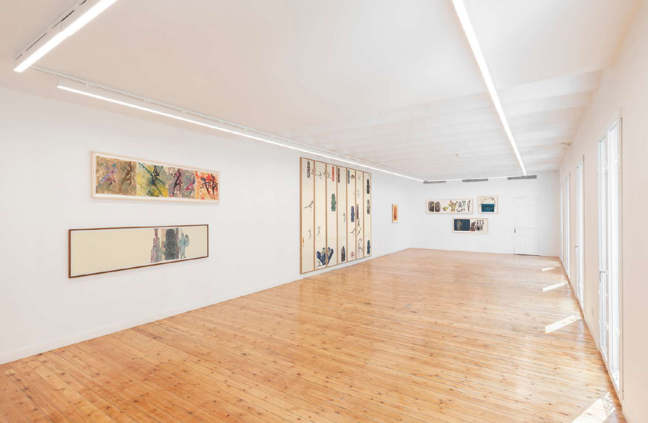
Vista de la instalación en NoguerasBlanchard Madrid