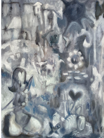
Past Master, 2023