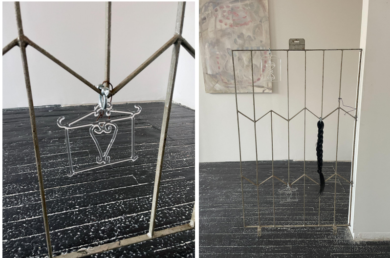
Sheol ii, 2023 Borosilicate Glass 4.25 x 5.25 inches