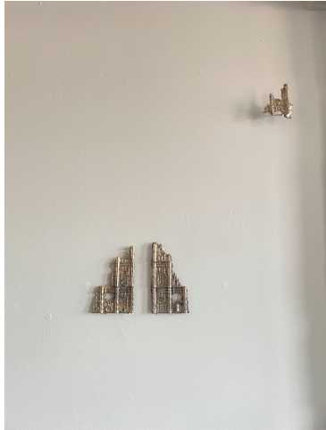
Bergmeister Bismuth 16 x 11 x 1 inches