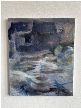
Bone Ranch, 2023