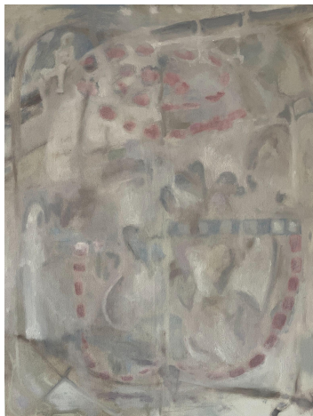
Spring confusion, 2023 Oil on Canvas 41x32 inches