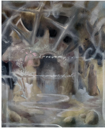
Gate 7, 2023 Oil on Canvas 20x24 inches