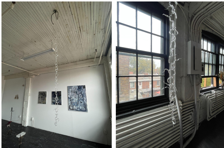
Fetter of Cocytus, 2023 Borosilicate Glass 48 x 4 inches