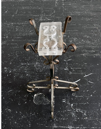
Tzimtzum (The Sacred Void), 2023