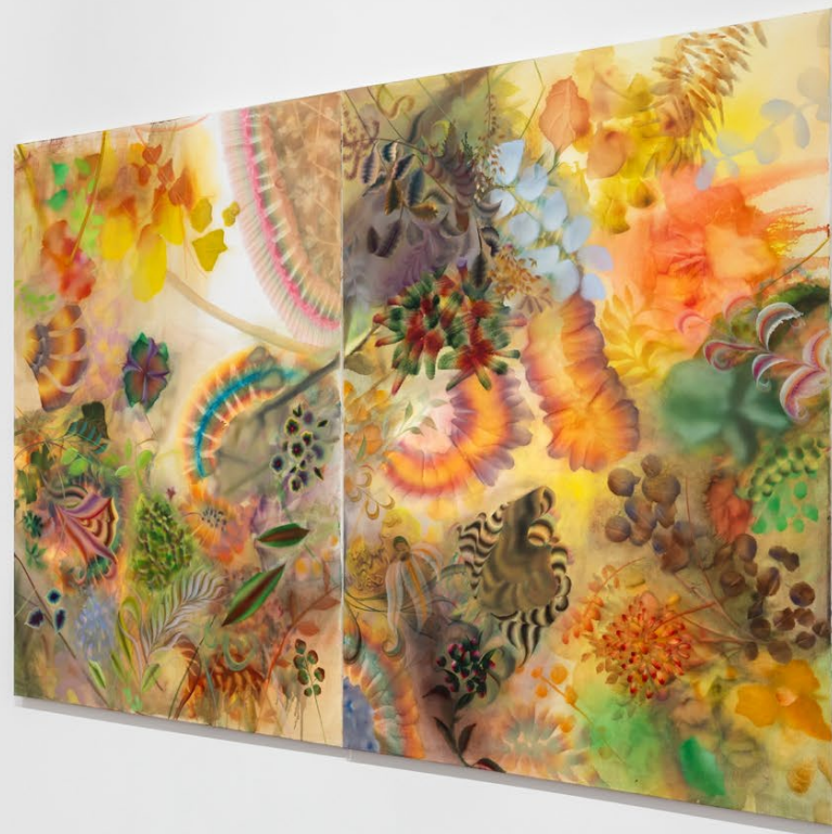
Exhibition views, Autumn Ramsey , 5 Rue de Beaune, 2023.