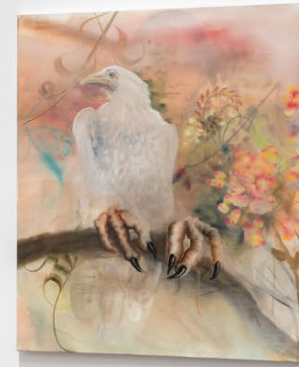
Exhibition views, Autumn Ramsey , 5 Rue de Beaune, 2023.