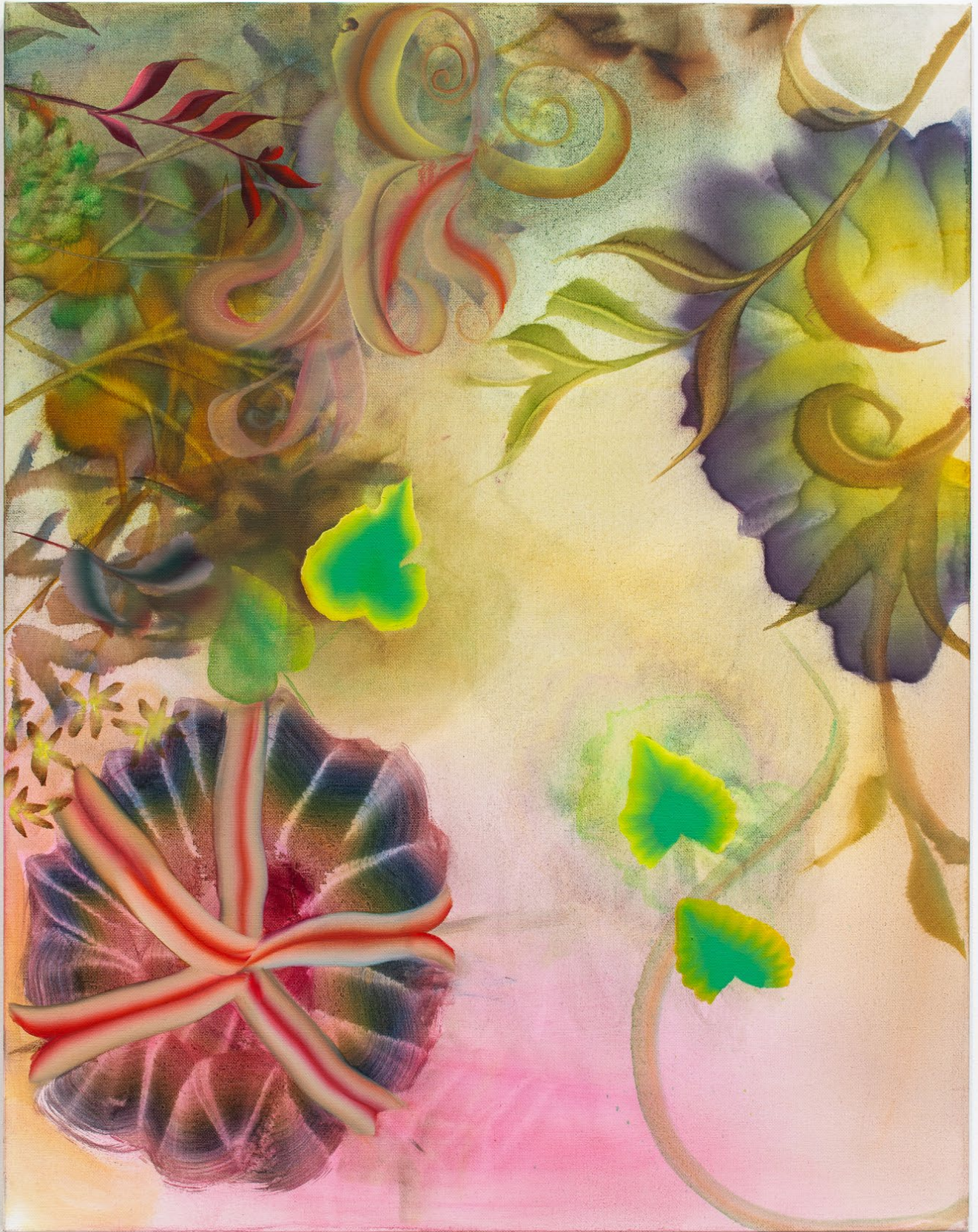
Blush , 2022 , Oil on canvas 71 x 56 cm | 28 x 22 inches

Courtesy of the artist and Crèveœur, Paris. Photo: Martin Argyroglo