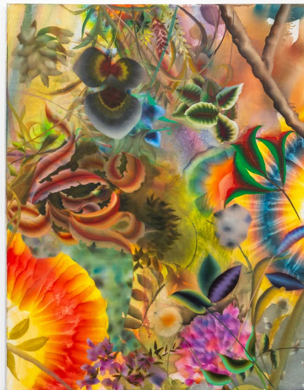
Exhibition views, Autumn Ramsey , 5 Rue de Beaune, 2023.