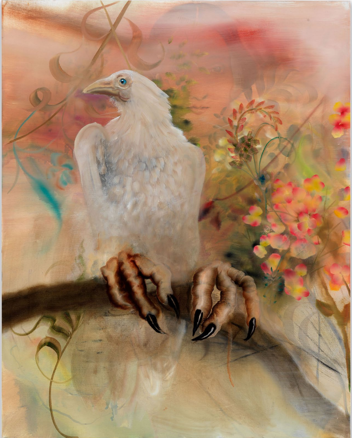
Exit , 2021, Oil on canvas 76 x 61 cm | 30 x 24 inches