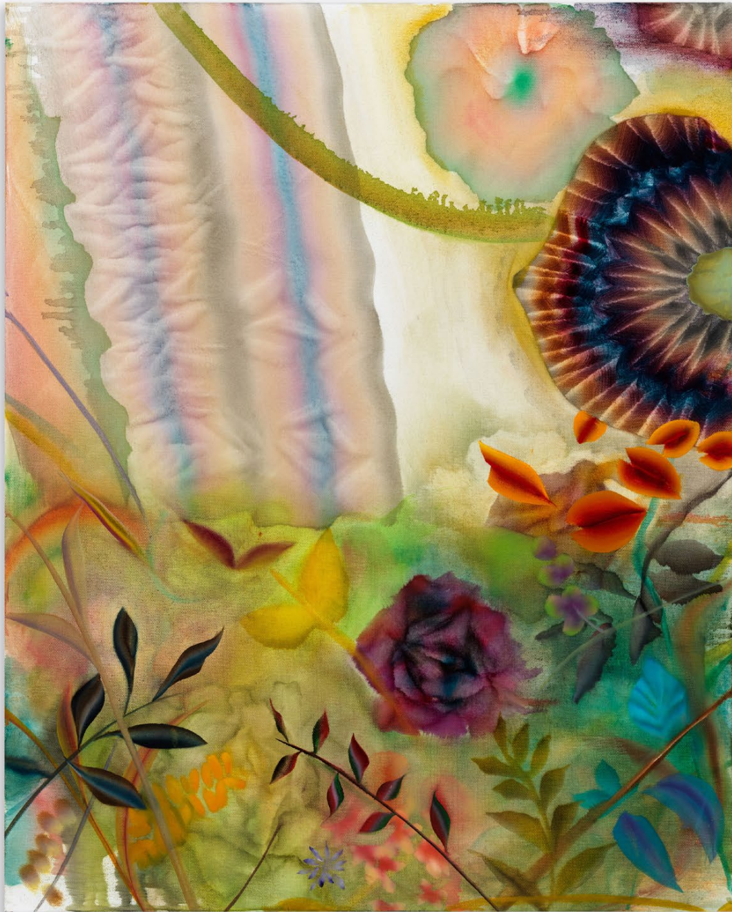
True Vine , 2023, Oil on canvas 76 x 61 cm | 30 x 24 inches