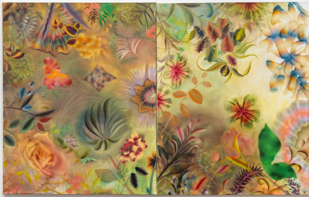
Exhibition views, Autumn Ramsey , 5 Rue de Beaune, 2023.