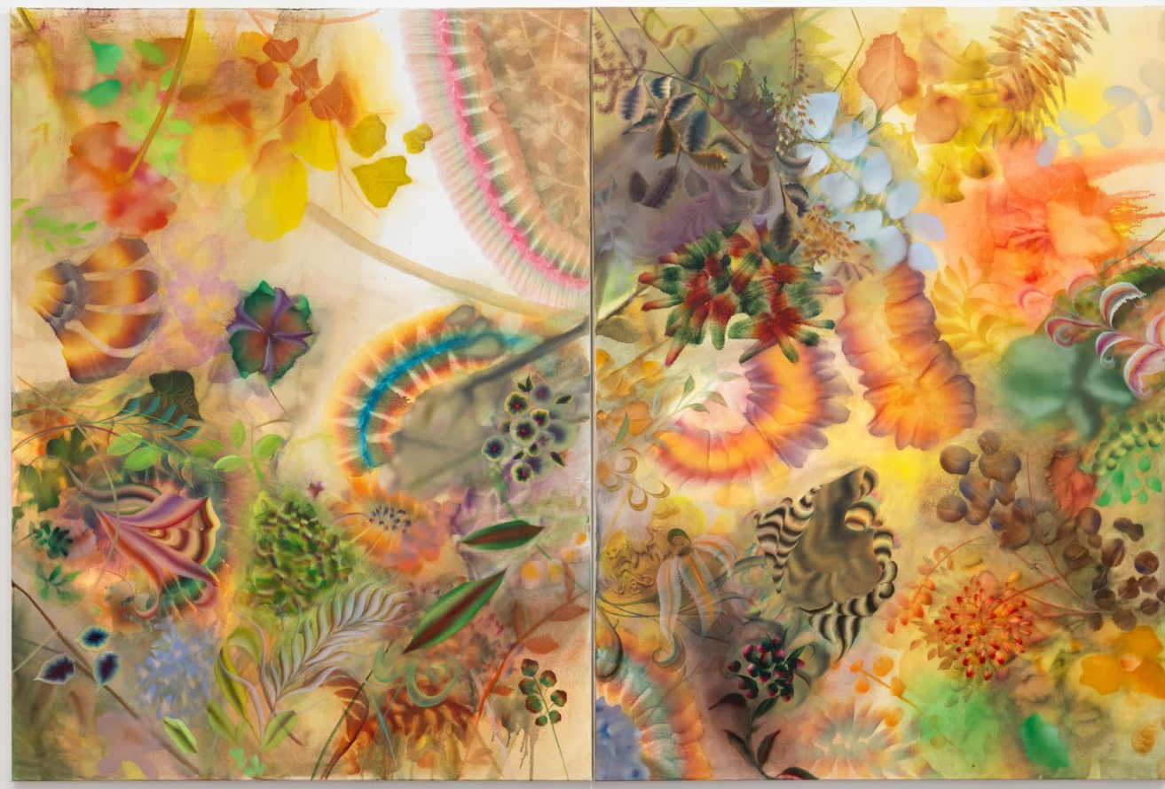
Exhibition views, Autumn Ramsey , 5 Rue de Beaune, 2023.