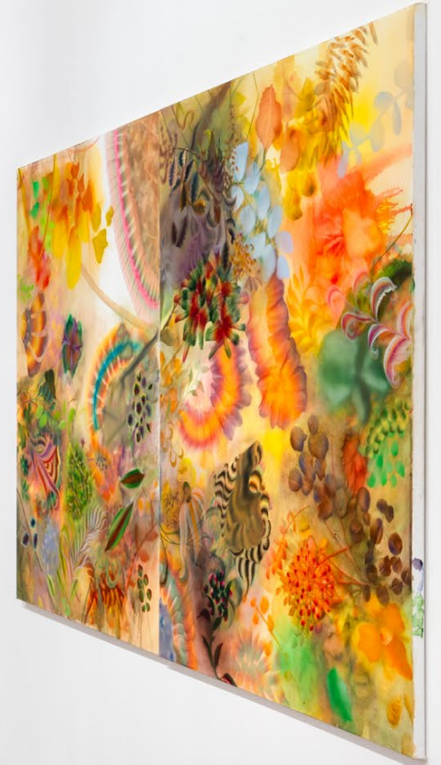
Exhibition views, Autumn Ramsey , 5 Rue de Beaune, 2023.