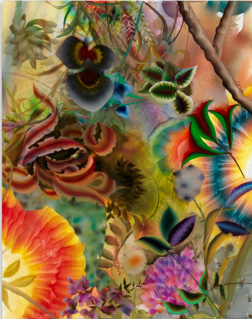
The Myth of Venus , 2023, Oil on canvas 71 x 56 cm | 28 x 22 inches