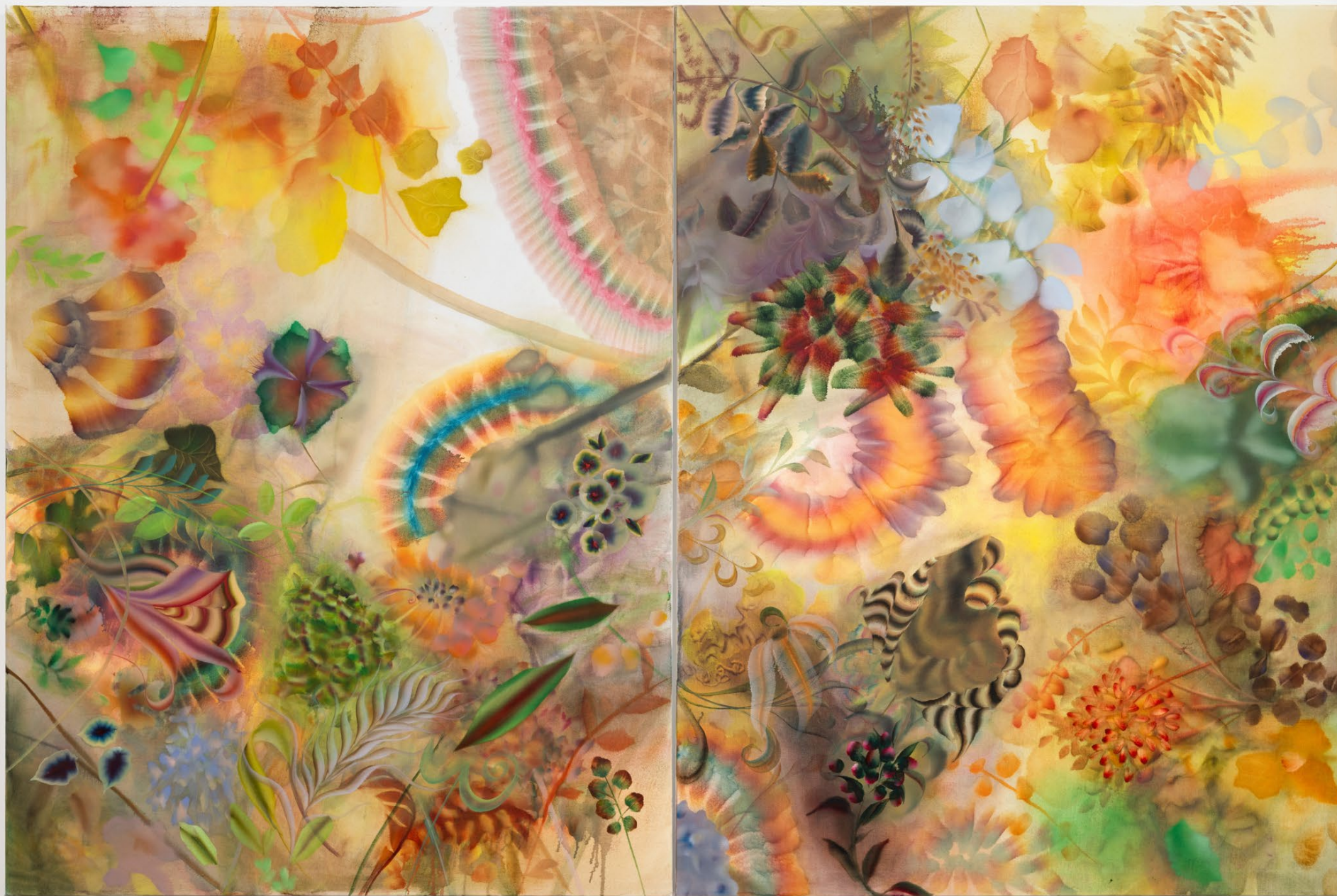
Sirens , 2023, Oil on canvas 2 panels, 122 x 91,5 cm | 48 x 36 inches, each Courtesy of the artist and Crèvecœur, Paris. Photo: Martin Argyroglo