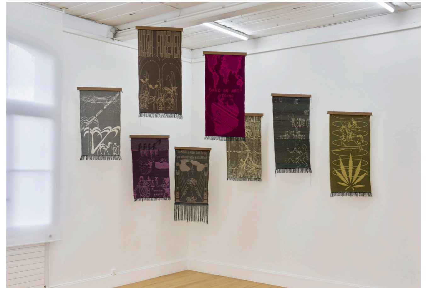
Exhibition view, Charlotte Johannesson, Save as art?, Kunsthalle Friart Fribourg, 2023.

The exhibition also includes a selection of screened digital images in the form of slideshows, as well as a display of archives that help to understand the pioneering and experimental nature of her production.