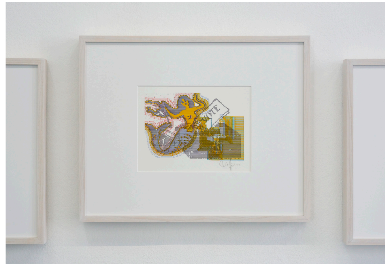
Charlotte Johannesson, Vote, 1984.