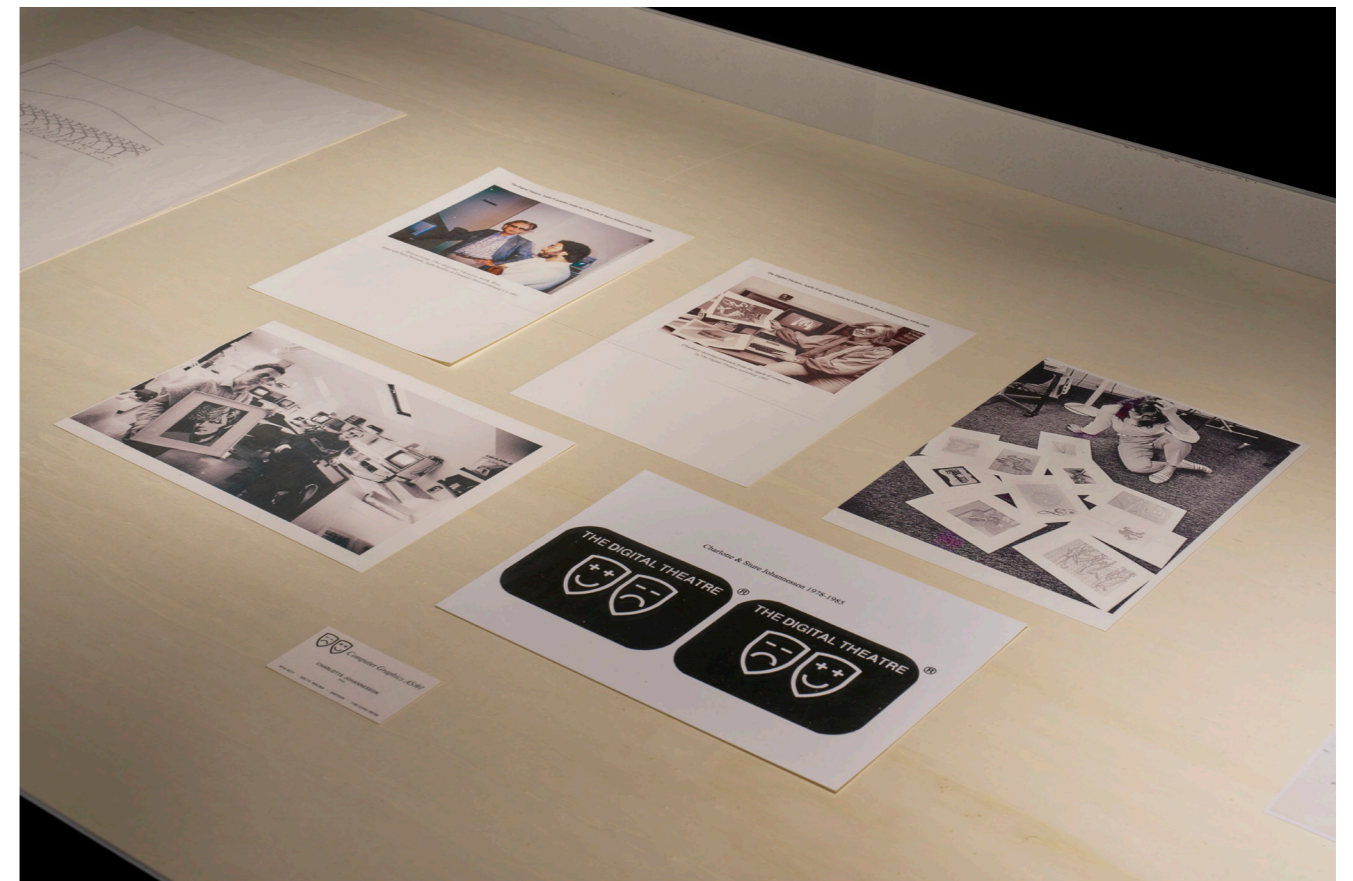
Display case, Archives Digital Theatre, Charlotte Johannesson, Save as art? , Kunsthalle Friart Fribourg, 2023.