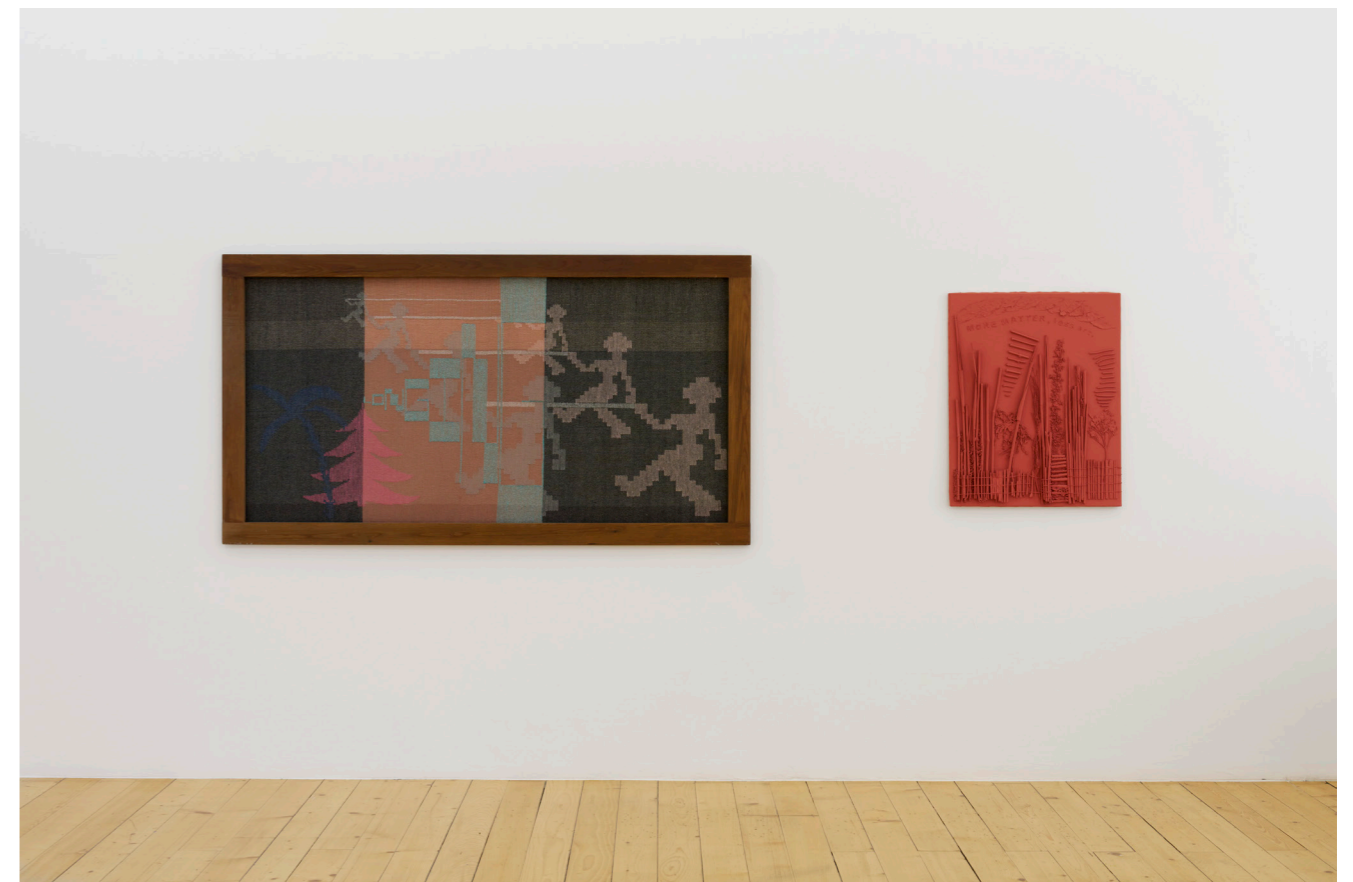
Installation view, Charlotte Johannesson, Longing , c. 1970 ; More Matter, Less Art , 2018, Kunsthalle Friart Fribourg, 2023.