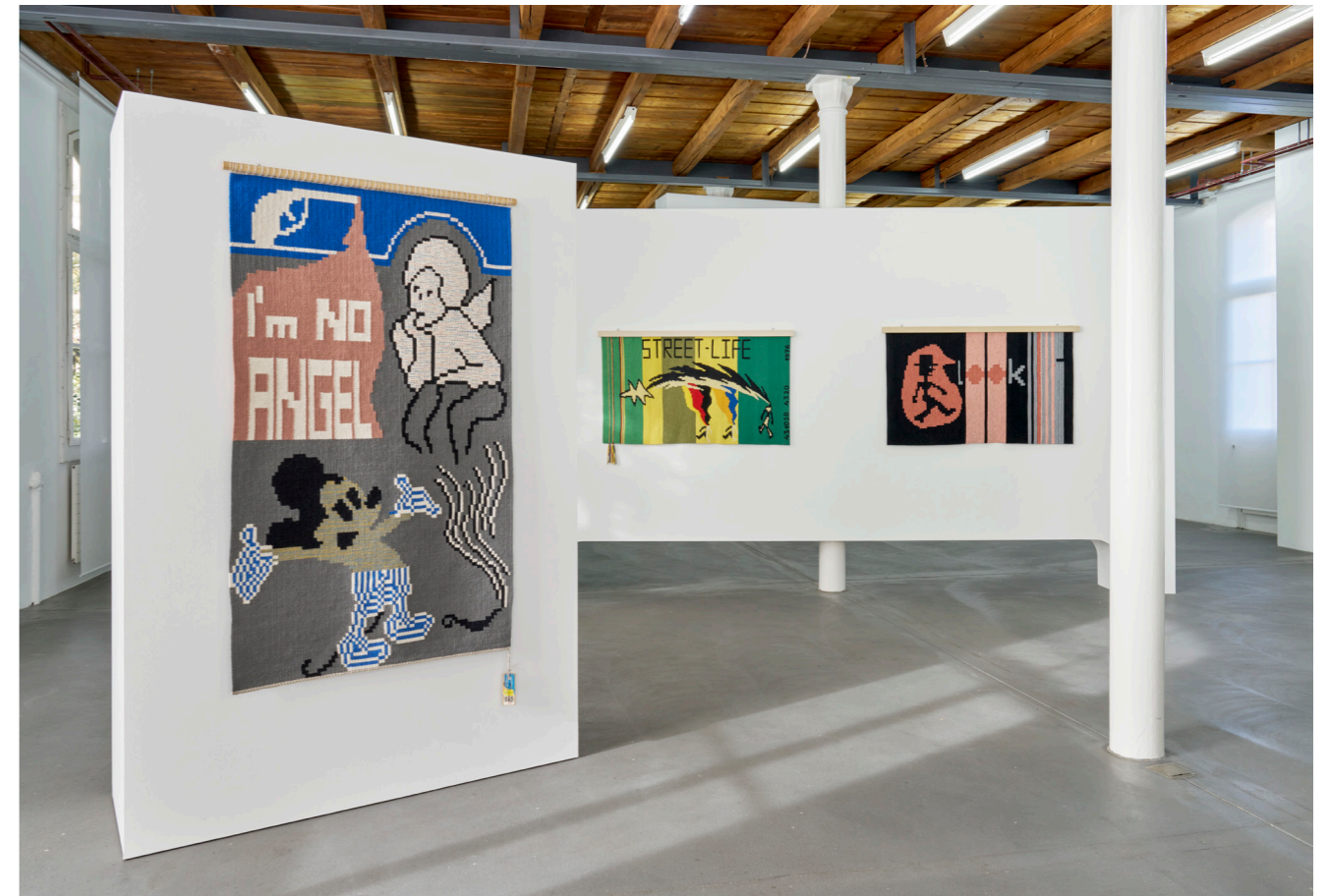
Exhibition view, Charlotte Johannesson, Save as art? , Kunsthalle Friart Fribourg, 2023.