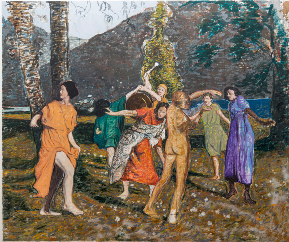
Andrea Salvino Noi siamo una minoranza che pensa e agisce come una maggioranza , 2023 oil and oil stick on canvas 250 x 300 cm