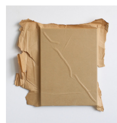
Olga Jakob Lignin, 2016 Packpapier, Baumwolle 48 x 47 cm