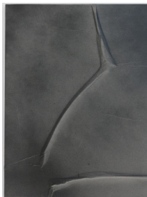
Olga Jakob Macula Relief Nr.10, 2022 Pigment, Seidenpapier, Polyester 60 x 46 cm