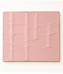
Olga Jakob una, 2016 Pigment, Seidenpapier, Baumwolle, 37,5 x 42 cm