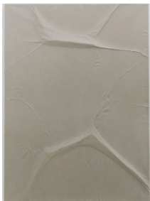
Olga Jakob Macula Relief Nr.14, 2022 Pigment, Seidenpapier, Polyester 60 x 46 cm