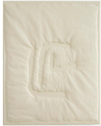
Olga Jakob Ceruse, 2015 Mikrofaser, Wolle, Leinwand 50 x 40 cm