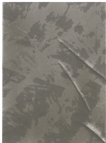
Olga Jakob Macula Relief Nr.7, 2022 Pigment, Seidenpapier, Polyester 60 x 45 cm