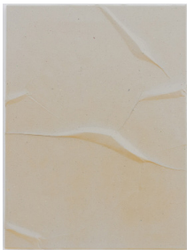
Olga Jakob Macula Relief Nr.12, 2022 Pigment, Seidenpapier, Polyester 60 x 46 cm