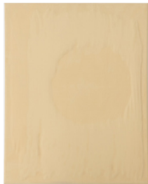
Olga Jakob Auri, 2015 Mikrofaser, Wolle, Leinwand 50 x 40 cm