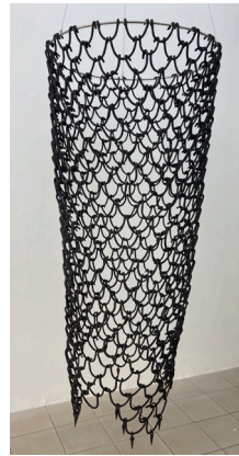
Aline Witschi Sound from World End, Castel 3, 2021-23 grob schamottierter Ton gebrannt, d 91 x 200 cm