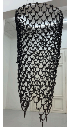
Aline Witschi Sound from World End, Castel 2, 2021-23 grob schamottierter Ton gebrannt, d 69 x 130 cm