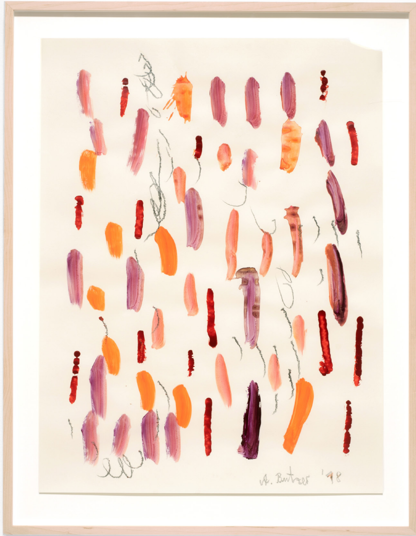
Untitled , 2018 Watercolour and graphite on paper 61 x 45,7 cm