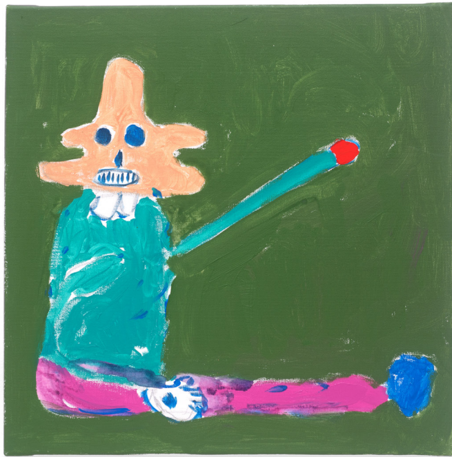
Untitled , 2018 Acrylic on canvas 50 x 50 cm