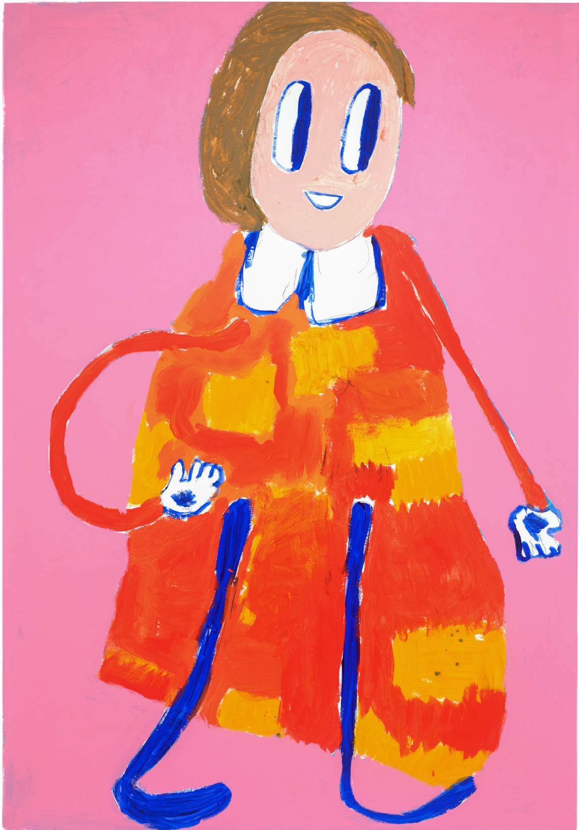
Untitled , 2018 Acrylic on canvas 271 x 188 cm