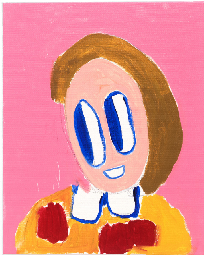
Untitled , 2018 Acrylic on canvas 50,8 x 40,5 cm