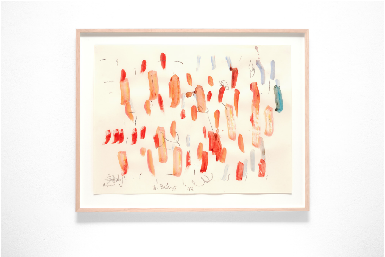
Untitled , 2018 Watercolour and graphite on paper 45,7 x 61 cm