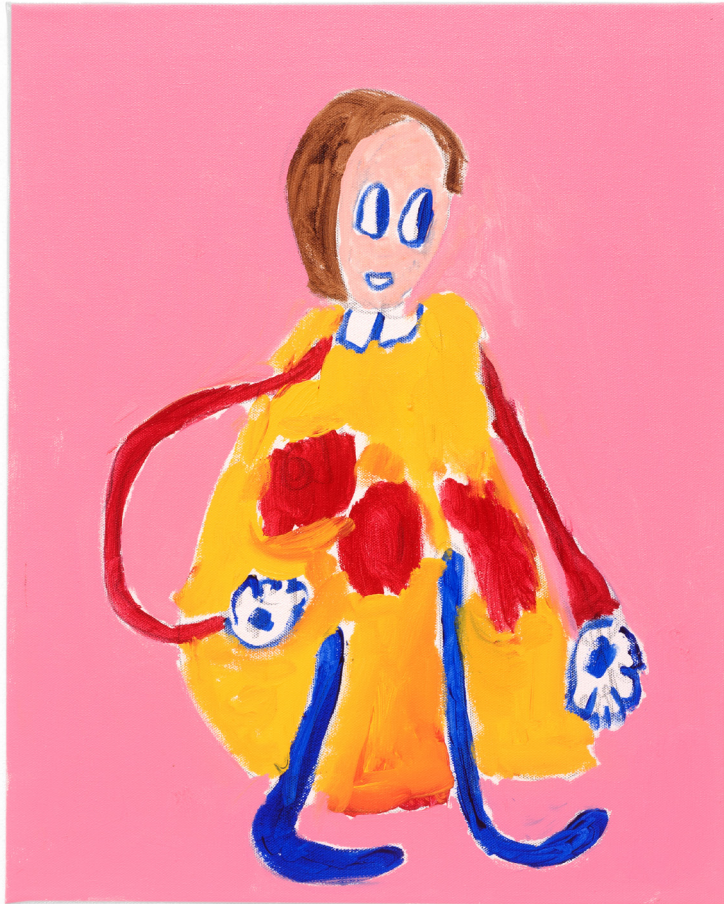
Untitled , 2018 Acrylic on canvas 51 x 40 cm