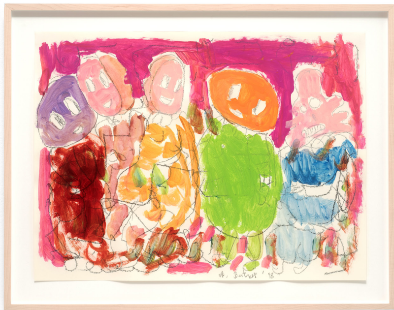
Untitled , 2018 Watercolour and graphite on paper 45,7 x 61 cm