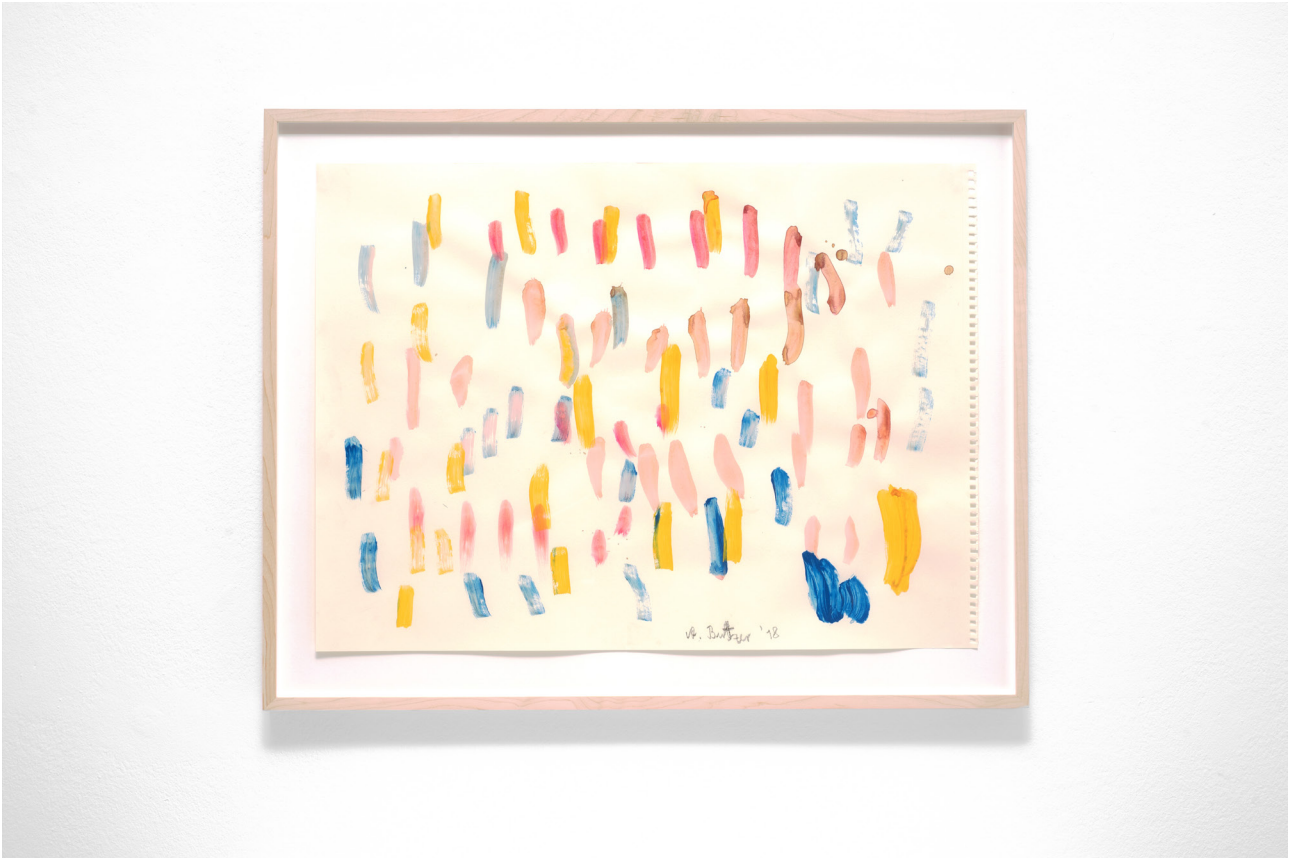
Untitled , 2018 Watercolour on paper 45,7 x 61 cm