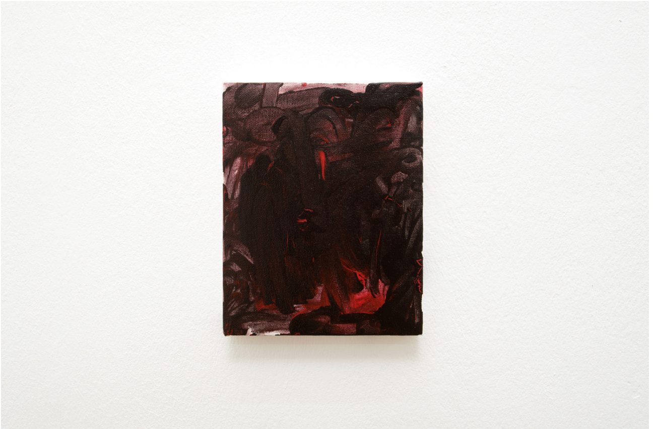
Tan Kagami Untitled , 2015 Paint on canvas 18 x 14 cm