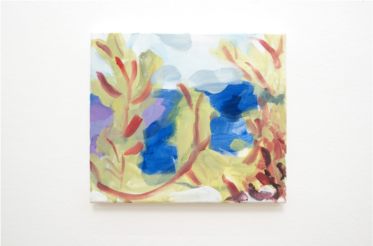
Eric Palgon Marseille , 2017 Oil on canvas 33 x 34 cm