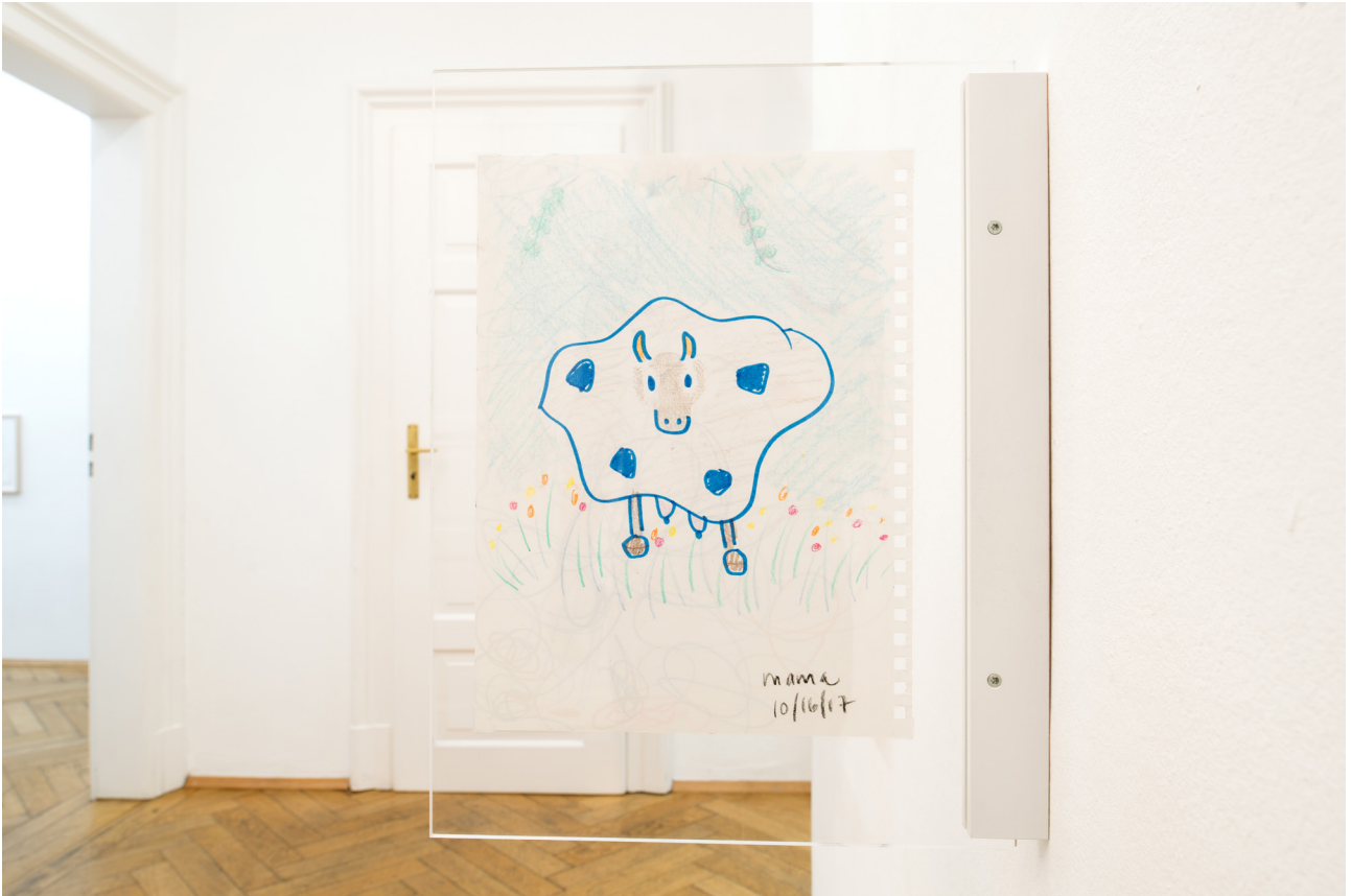
Kitty Cat Meow Meow Untitled , 2017 Coloured pencil, felt pen on paper 31 x 23 cm