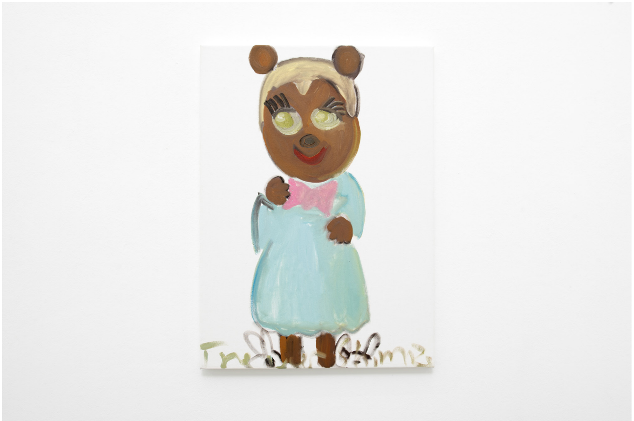
Trevor Shimizu Posey Bear , 2018 Oil on canvas 76,5 x 55,5 cm