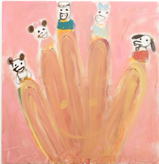
Trevor Shimizu Finger Family , 2018 Oil on canvas 78,7 x 76,2 cm