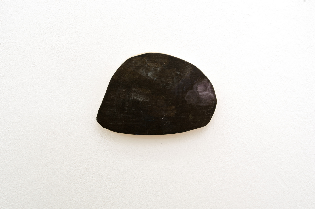
Monique Mouton Untitled , 2017 Oil on wood panel 11,5 x 16,5 cm