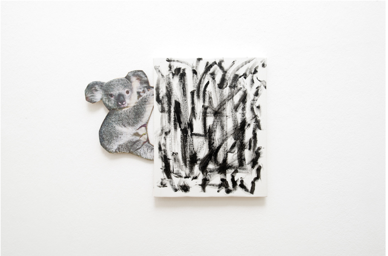
Ken Kagami Koala , 2019 Oil on canvas 27 x 35 cm