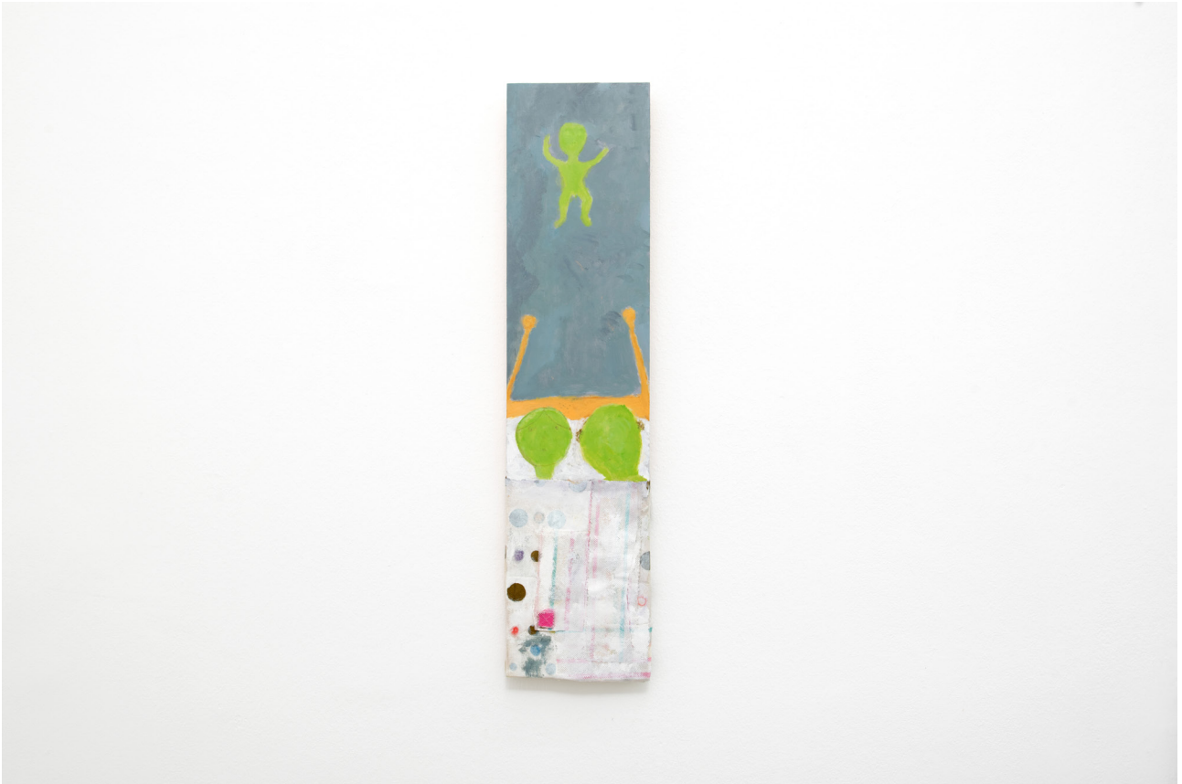
Marc Matchak The Impossible Theatre , 2018 Acrylic, fabric on wood 79 x 19 cm