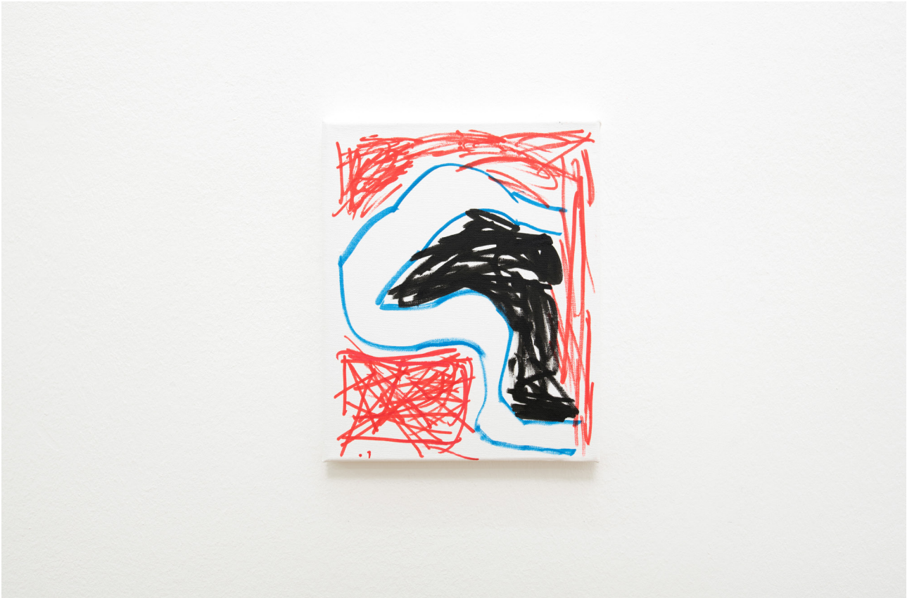
Tan Kagami Untitled , 2017 Marker on canvas 27 x 22 cm