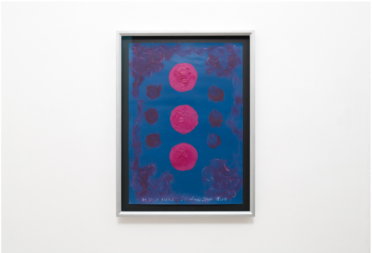
Andy Hope 1930 NO BRAIN SERIES , 2014 Oil, lacquer on board 67,8 x 48 cm