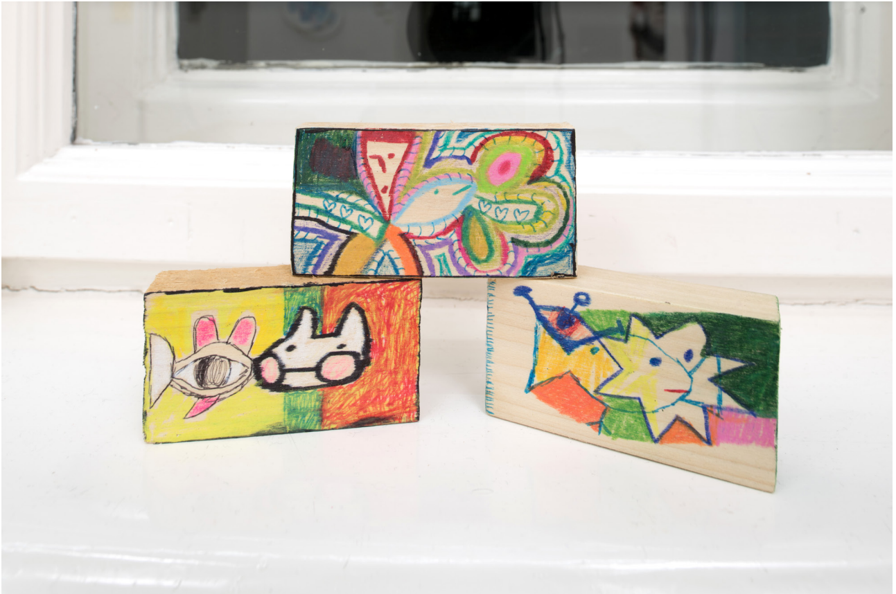
Chris Milic (from left to right) science is boring , 2019 Felt pen on wood 8 x 4,5 x 2 cm