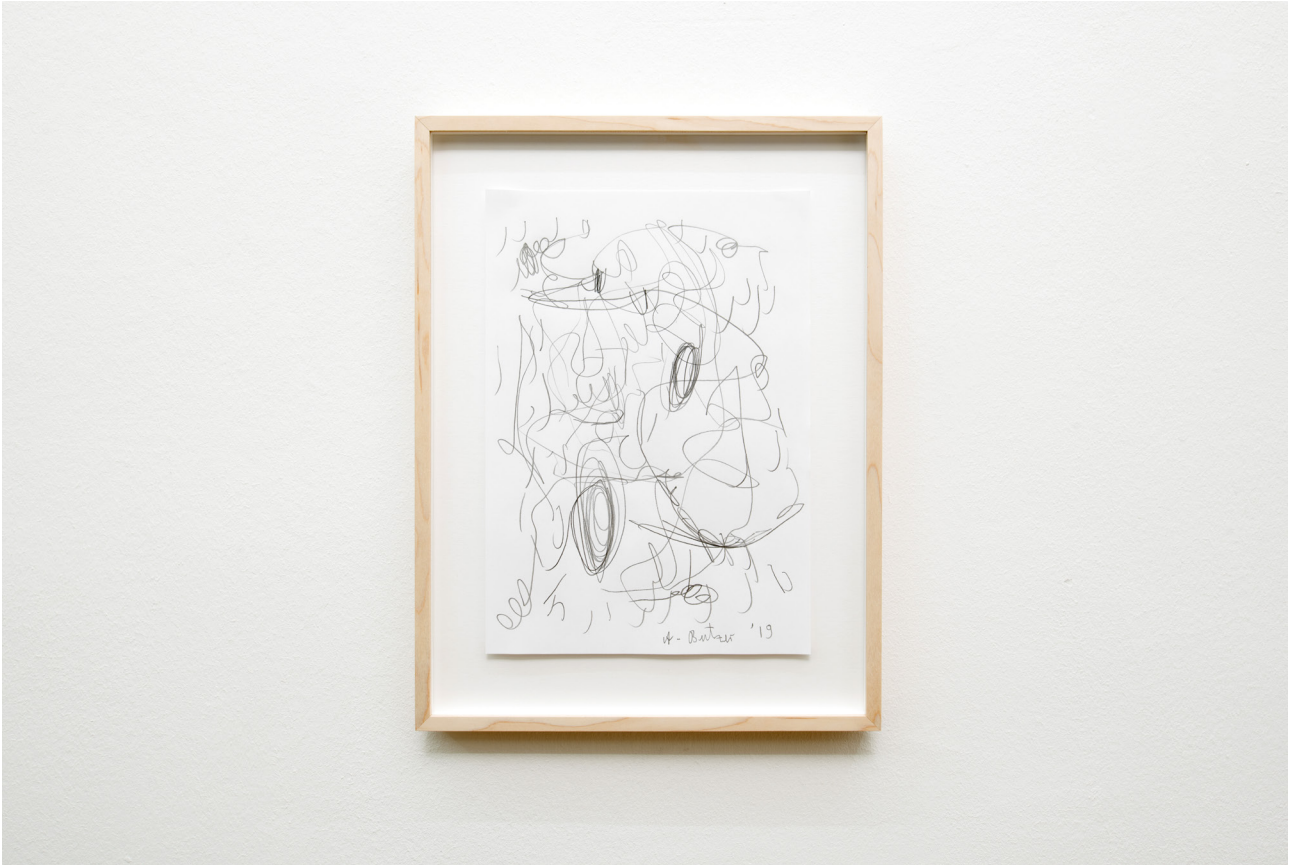
André Butzer Untitled , 2019 Pencil on paper 29,7 x 21 cm