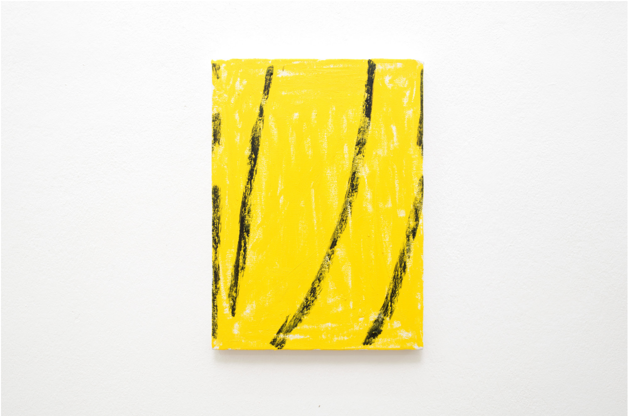
Ken Kagami Banana , 2019 Oil on canvas 33 x 24 cm