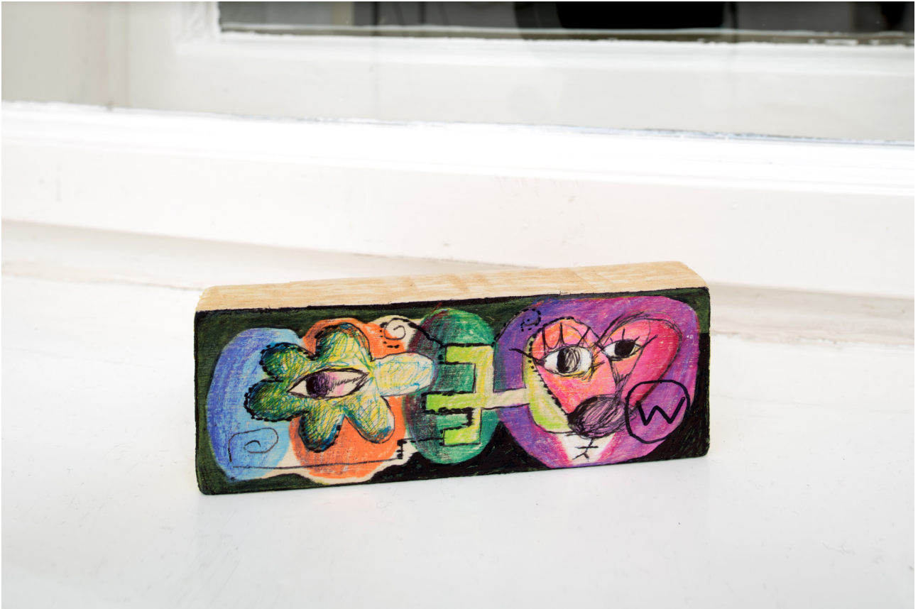
Chris Millic egg health w , 2019 Felt pen on wood 13 x 4,5 x 2 cm