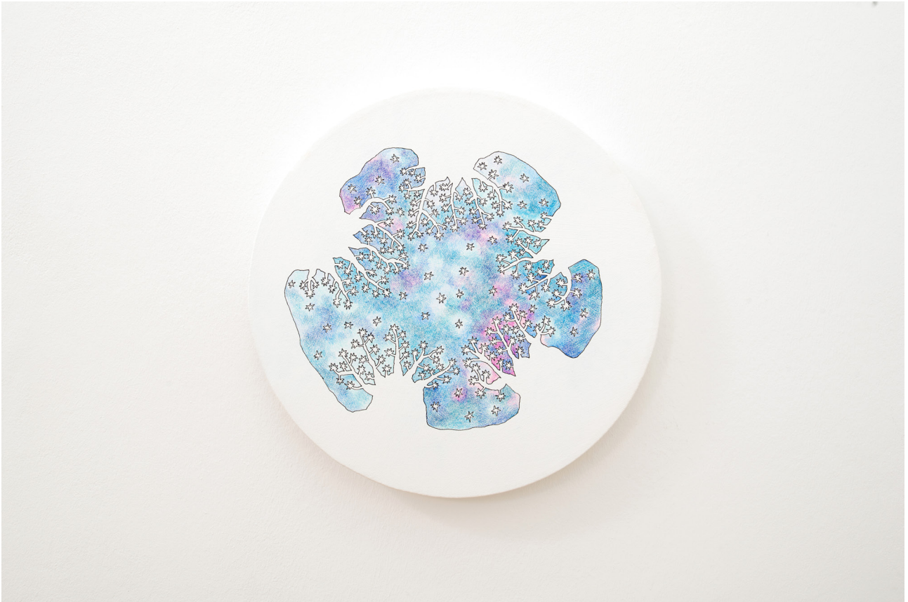
Mieko Meguro Trees grab Stars #5 , 2019 Pen, coloured pencil on gessoed canvas 45 cm in diameter