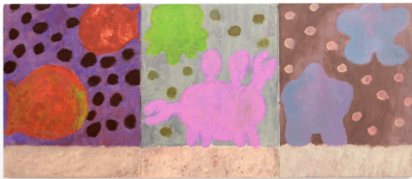
Marc Matchak Walk away and turn around , 2016 Acrylic on canvas 35,5 x 83,2 cm