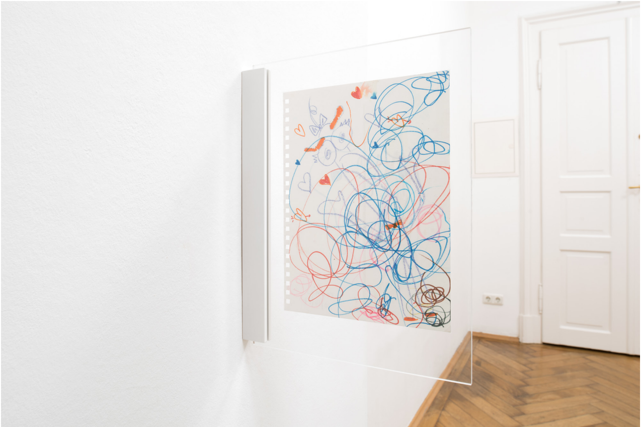
Kitty Cat Meow Meow, Untitled , 2017