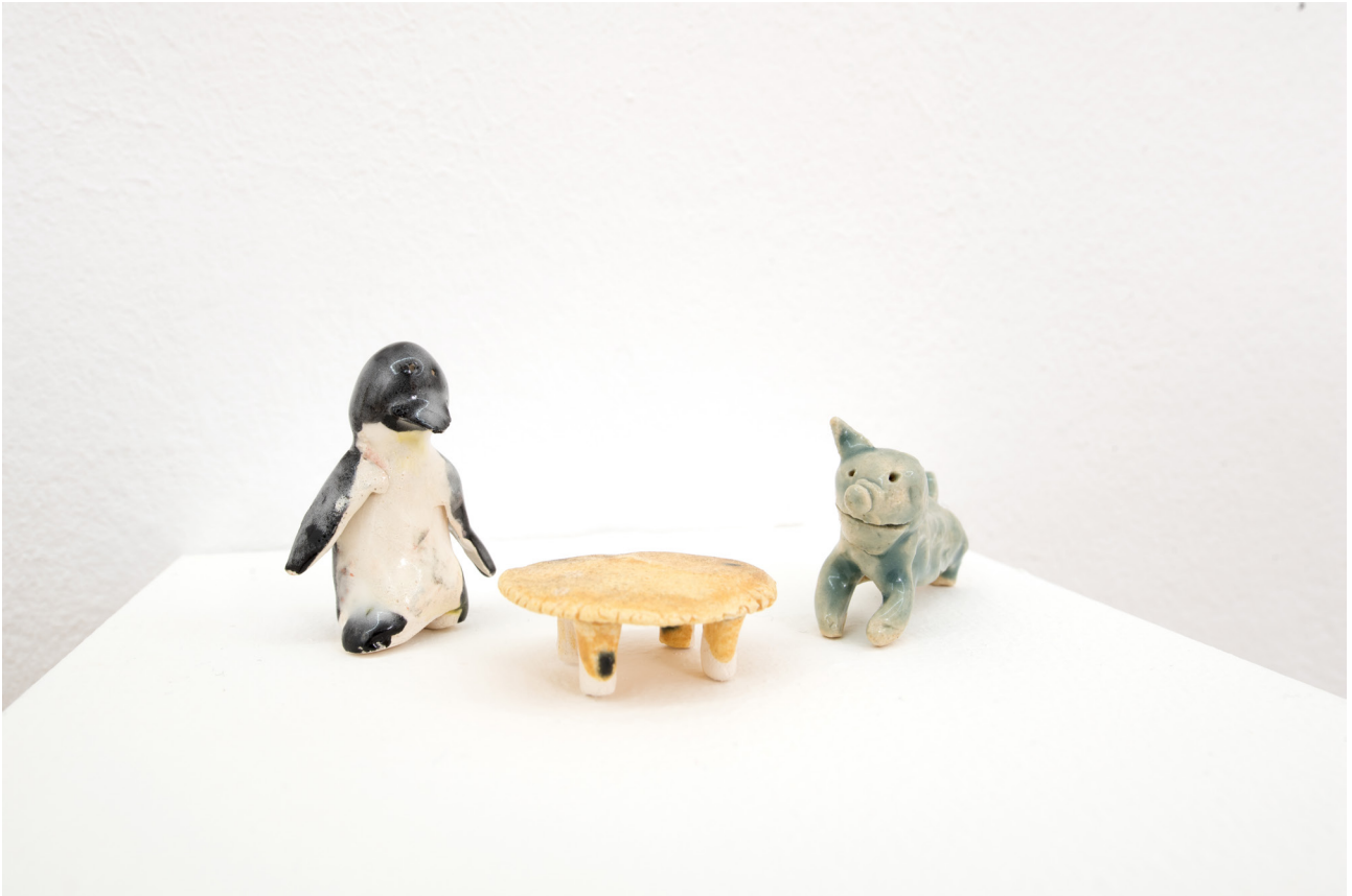
Asha Schechter Penguin and Pig post-breakup , 2019 Glazed ceramic ca. 8 x 12 x 5,5 cm