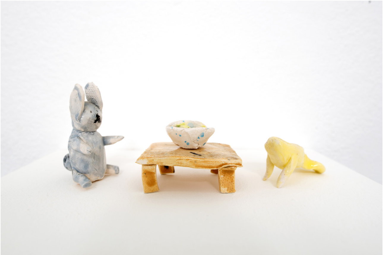
Asha Schechter Rabbit and Manatee share a salad , 2019 Glazed ceramic ca. 6 x 15,5 x 6 cm