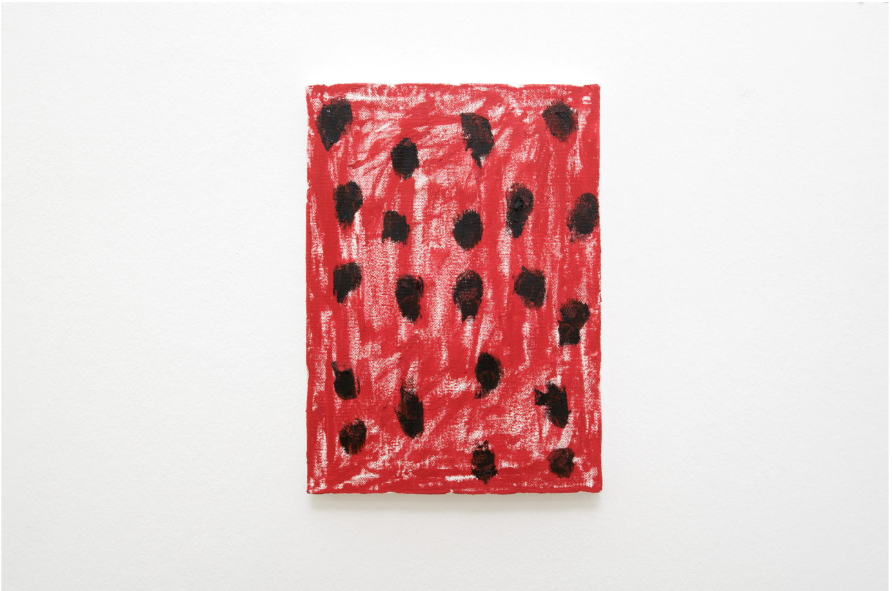
Ken Kagami Strawberry , 2019 Oil on canvas 33 x 24 cm