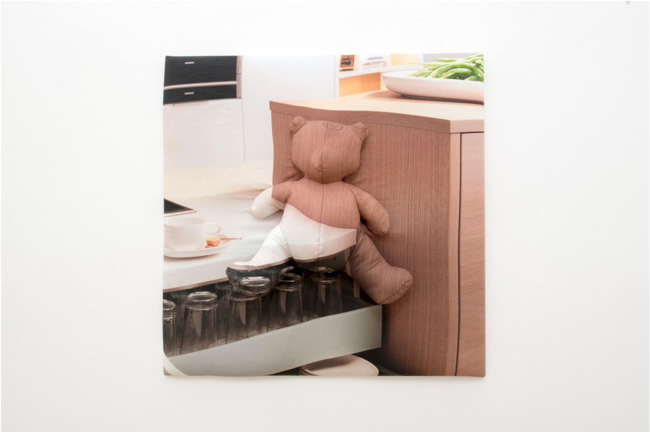
Antoine Catala Untitled , 2019 Printed fabric, polyester filling on MDF 75 x 75 x 15 cm Edition 3 + 2 AP