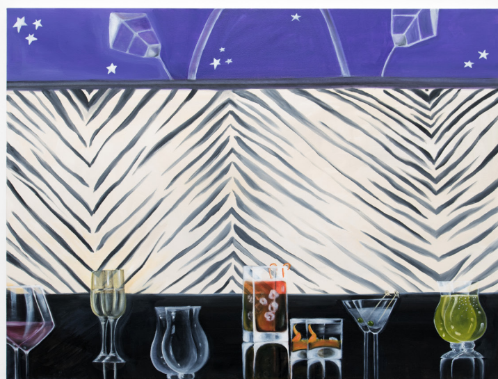
Quintessa Matranga Drunk Painting 001 , 2019 Oil on canvas 76,5 x 101,5 cm