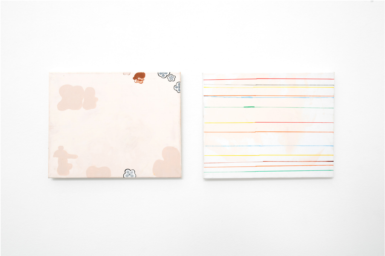
Rafael Delacruz Guitar music 1 & Guitar music 2 , 2019 Acrylic on canvas 41 x 50,5 cm