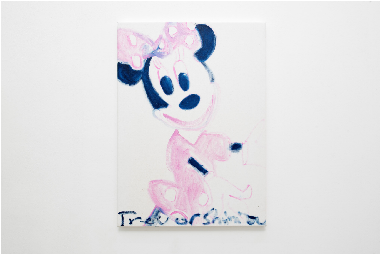
Trevor Shimizu Minnie (dance) , 2017 Oil on canvas 76,2 x 55,8 cm