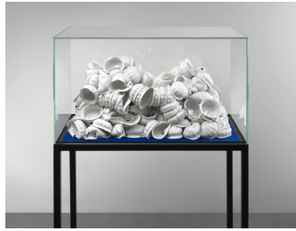
Untitled, 2011 porcelain in glass display, vitrine 36 × 80 × 46 cm, 148 × 87 × 54 cm