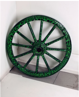
Wheel, 2008 found object, crinkle lacquer Ø 67 cm