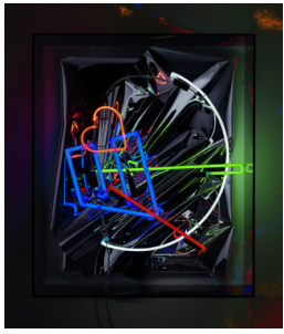
Untitled, 2023 mixed media, neon, cable, acrylic glass 96 × 81 × 24 cm