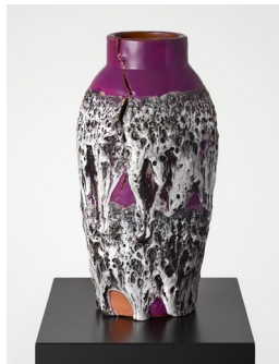
Skull, 2014 glazed ceramics Ø 15 cm (height: 30 cm)