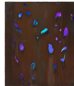
Untitled, 2008 steel, LED 135 × 114 cm