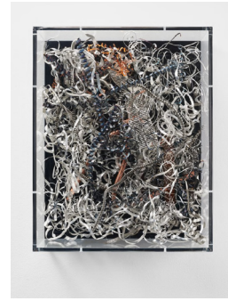
Untitled, 2020 mixed media, acrylic glass 50 × 40 × 15 cm