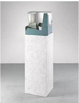
Kutxa Hutsa (for Jorge Oteiza), 2010 mirror glass, plinth acrylic glass 40 × 40 × 40 cm, plinth 93 × 33 × 33 cm