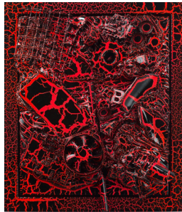
Untitled, 2009 mixed media on canvas, steel frame, crinkle lacquer, frame 36 × 30 cm, 43 × 37 cm