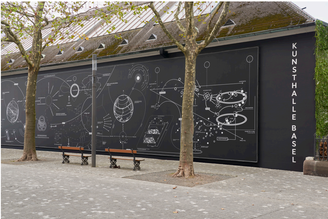
Nolan Oswald Dennis, a recurse 4 [3] worlds , Kunsthalle Basel Rückwand, 2023, Ausstellungsansicht, Foto: Philipp Hänger / Kunsthalle Basel Nolan Oswald Dennis, a recurse 4 [3] worlds , Kunsthalle Basel back wall, 2023, exhibition view, photo: Philipp Hänger / Kunsthalle Basel