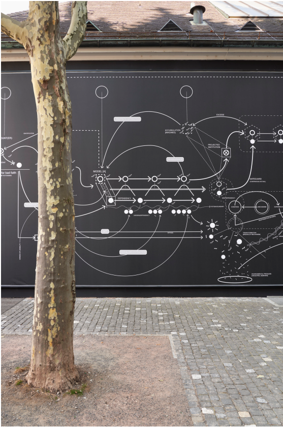
Nolan Oswald Dennis, Detailansicht, von: a recurse 4 [3] worlds , Kunsthalle Basel Rückwand, 2023