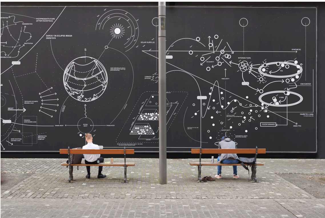
Nolan Oswald Dennis, Detailansicht, von: a recurse 4 [3] worlds , Kunsthalle Basel Rückwand, 2023