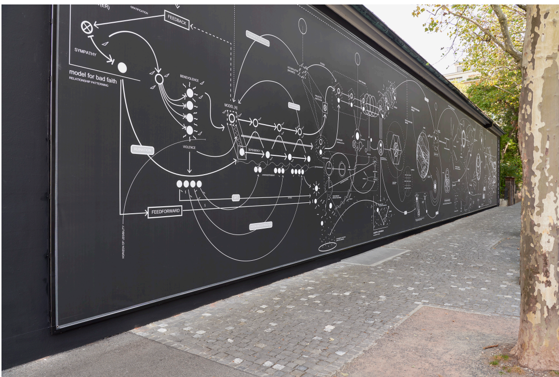
Nolan Oswald Dennis, a recurse 4 [3] worlds , Kunsthalle Basel Rückwand, 2023, Ausstellungsansicht, Foto: Philipp Hänger / Kunsthalle Basel