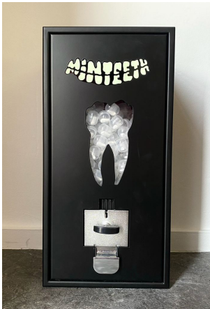
Minteeth 2022 Vendor 56,5 x 28 x 21 cm