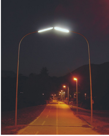
Elektrosex 2005 Street lamps, electric components 700 x 520 x 25 cm