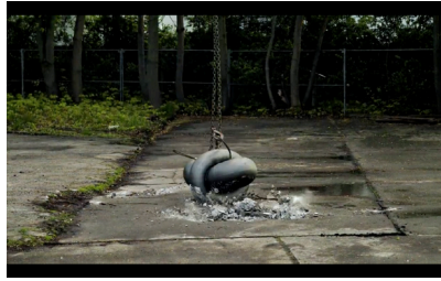
Berlin Depression 2016 Video 1 min Edition of 5