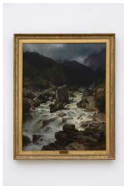
34_0D6A1256 Johann Gottfried Steffan Am Löntsch (zwischen Riedern und Kohlgrübli) , 1881 Öl auf Leinwand / Oil on canvas, 117 x 91,5 cm Sammlung / Collection Glarner Kunstverein