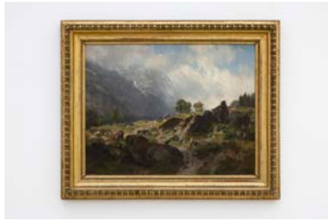
29_0D6A1247 Johann Gottfried Steffan Alp im Klöntal , 1880 Öl auf Leinwand / Oil on canvas, 99 x 129 cm Sammlung / Collection Glarner Kunstverein