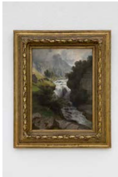
30_0D6A1254 Johann Gottfried Steffan Tschingelbach bei Elm , 1883 Öl auf Leinwand / Oil on canvas, 43 x 31,5 cm Sammlung / Collection Glarner Kunstverein