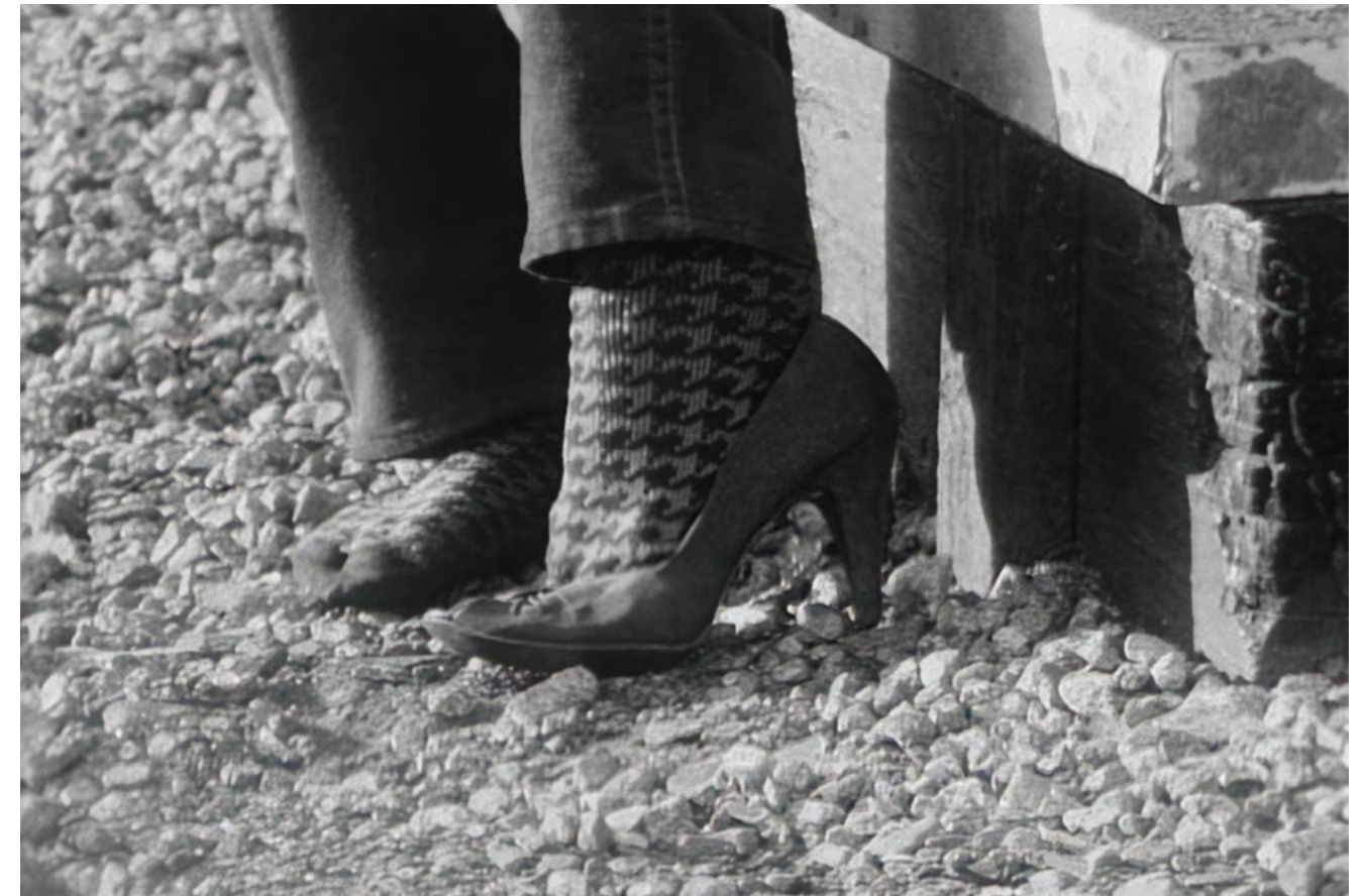
Leslie Thornton, beloved , 2024

Sid landovka / Leslie Thornton, twin of earth , 2024, site-specific installation with video and sound