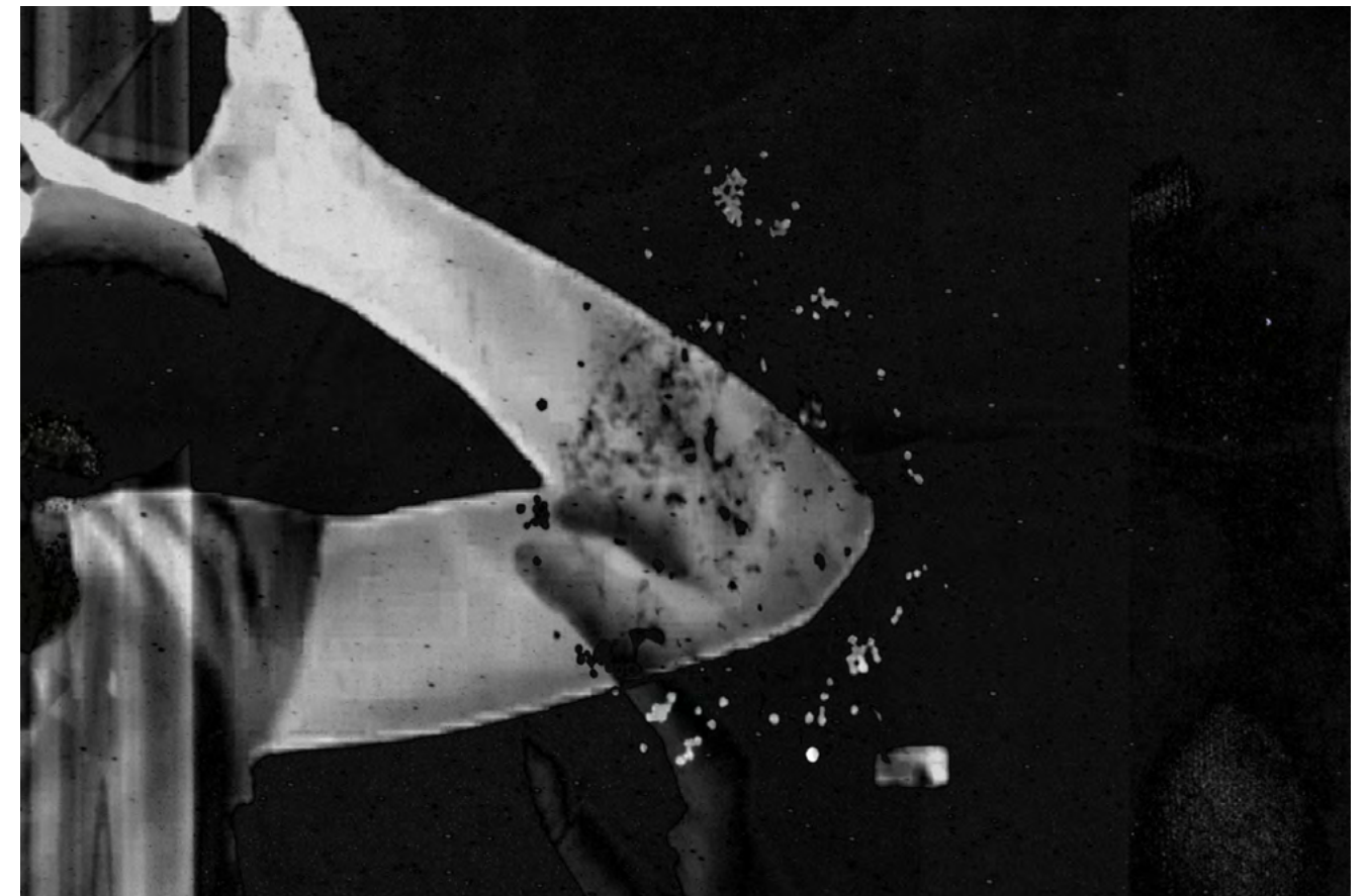
Sid landovka/Anya Tsyrlina, once in a hundred years , 2024