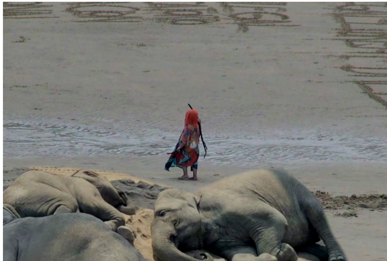
Sid landovka/Anya Tsyrlina, escape goat , 2020