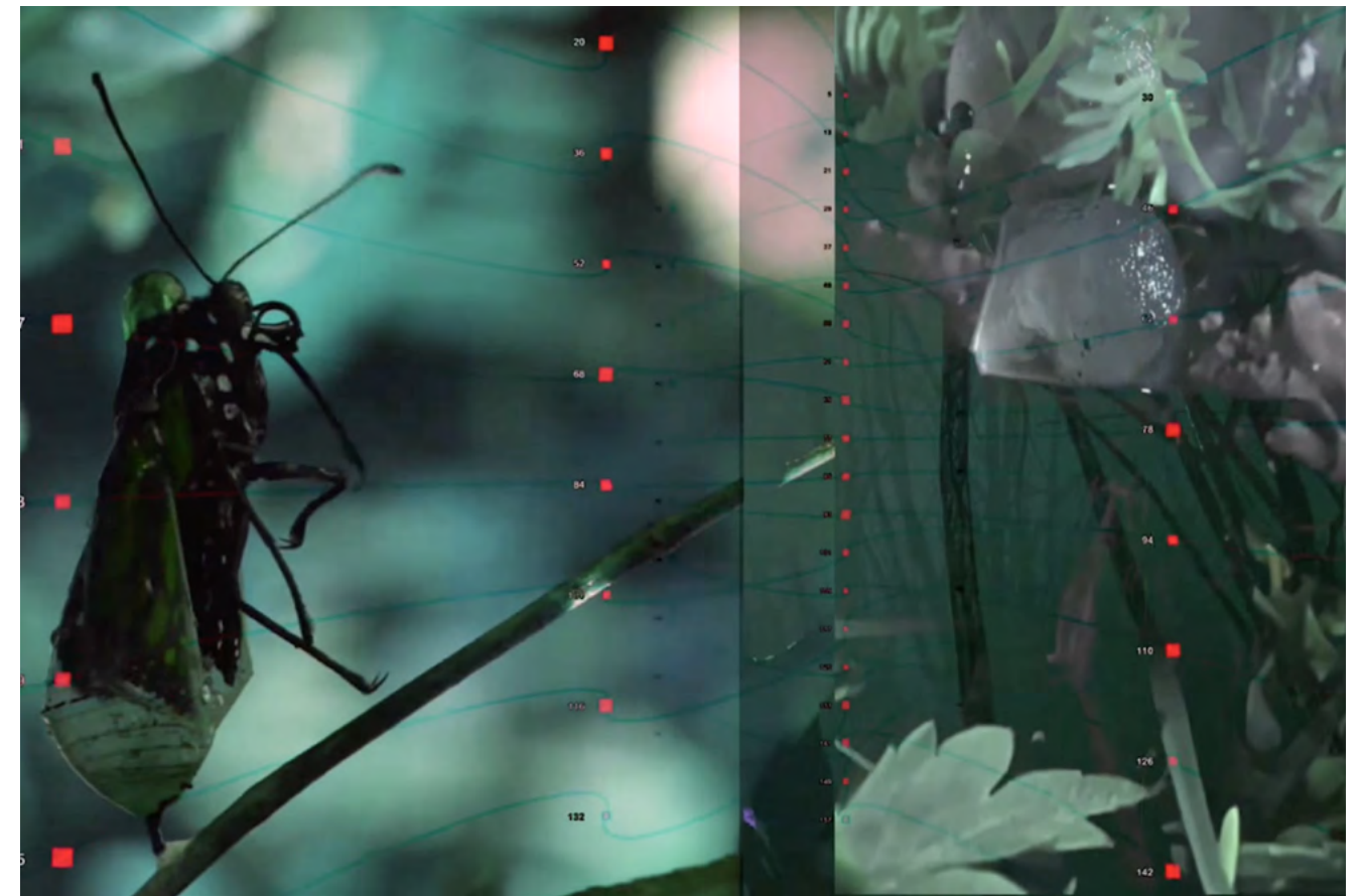
Sid landovka/Leslie Thornton, twin of earth , 2024