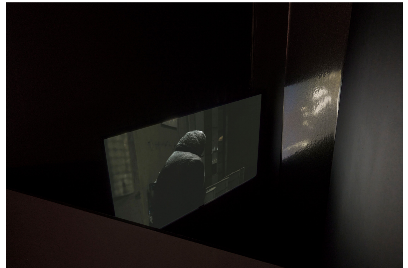
Iandovka/Tsyrlina, colder , 2024.