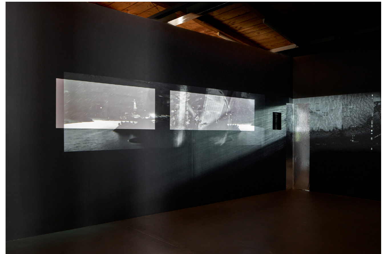
landovka/Tsyrlina, once in a hundred years (detail), 2024.