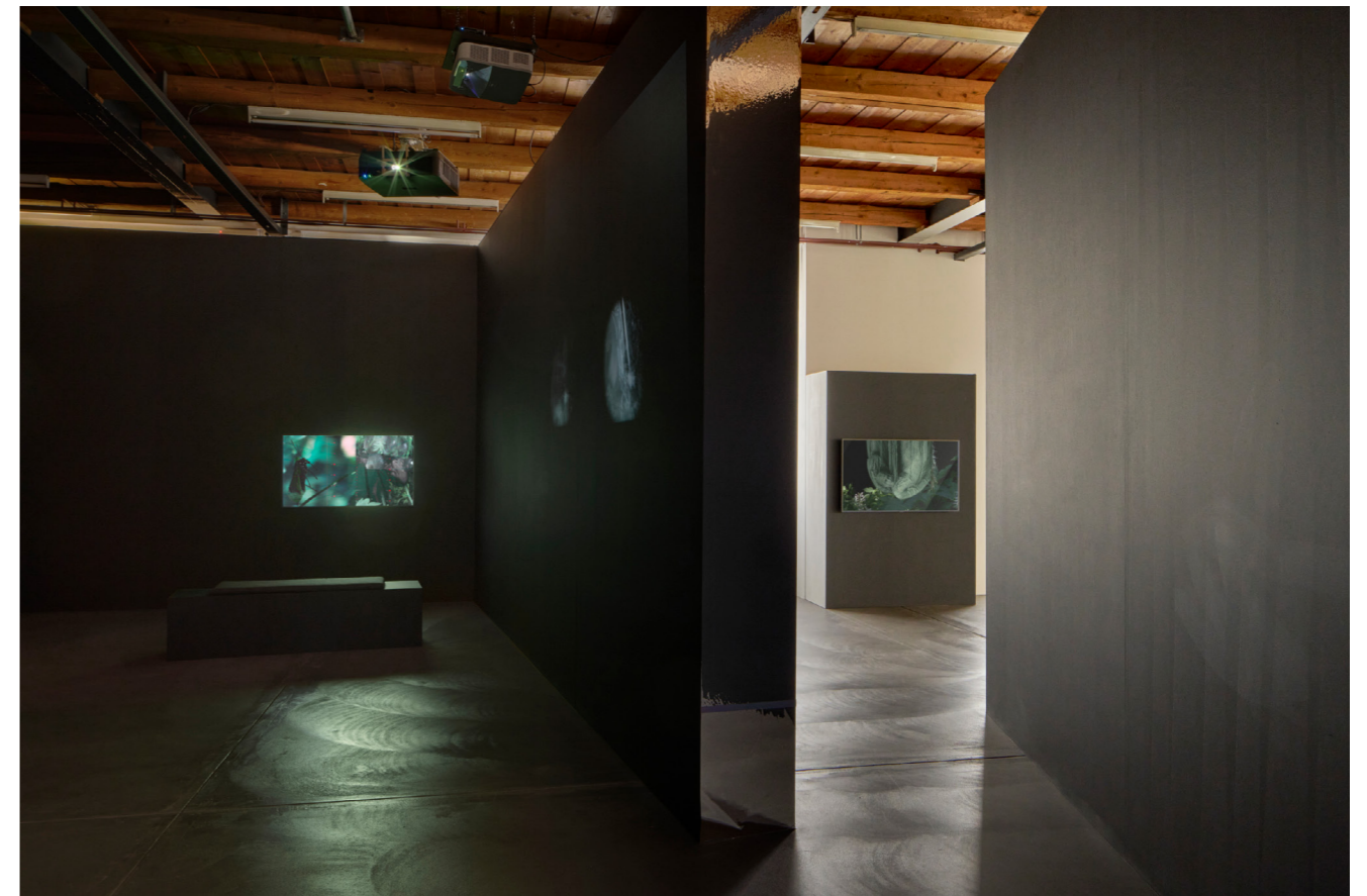
Exhibition view, once in a hundred years , Kunsthalle Friart Fribourg, 2024.