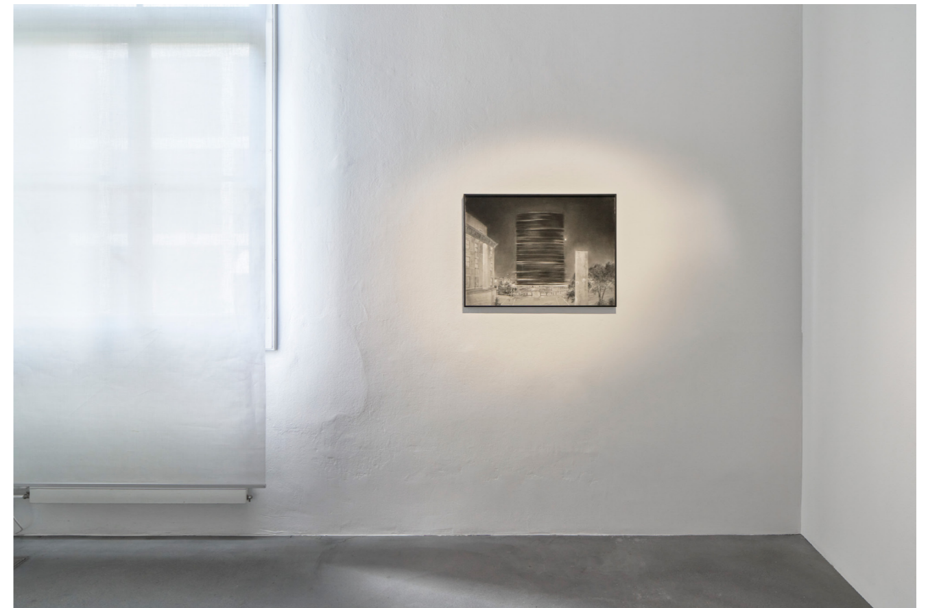
Thomas Zimmer, The U.N. Building at 78 rpm, 2012 .