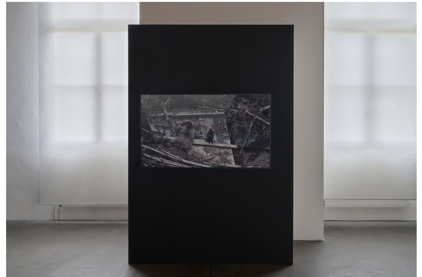
Iandovka/Tsyrlina, escape goat , 2020.

In the last five years their works have been shown at International Film Festival Rotterdam; Vienne, Vienna; Art of the Real, New York; Open City Documentary Festival, London; Courtisane, Ghent; Berwick Art and Media Festival, Berwick-upon-Tweed; MIEFF, Moscow; EMAF, Osnabrück; International Film Festival Oberhausen among other festivals; as well as at art spaces, exhibitions, and events.