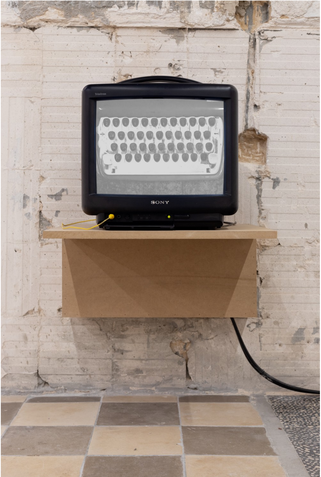
Fantasma na máquina, 2024