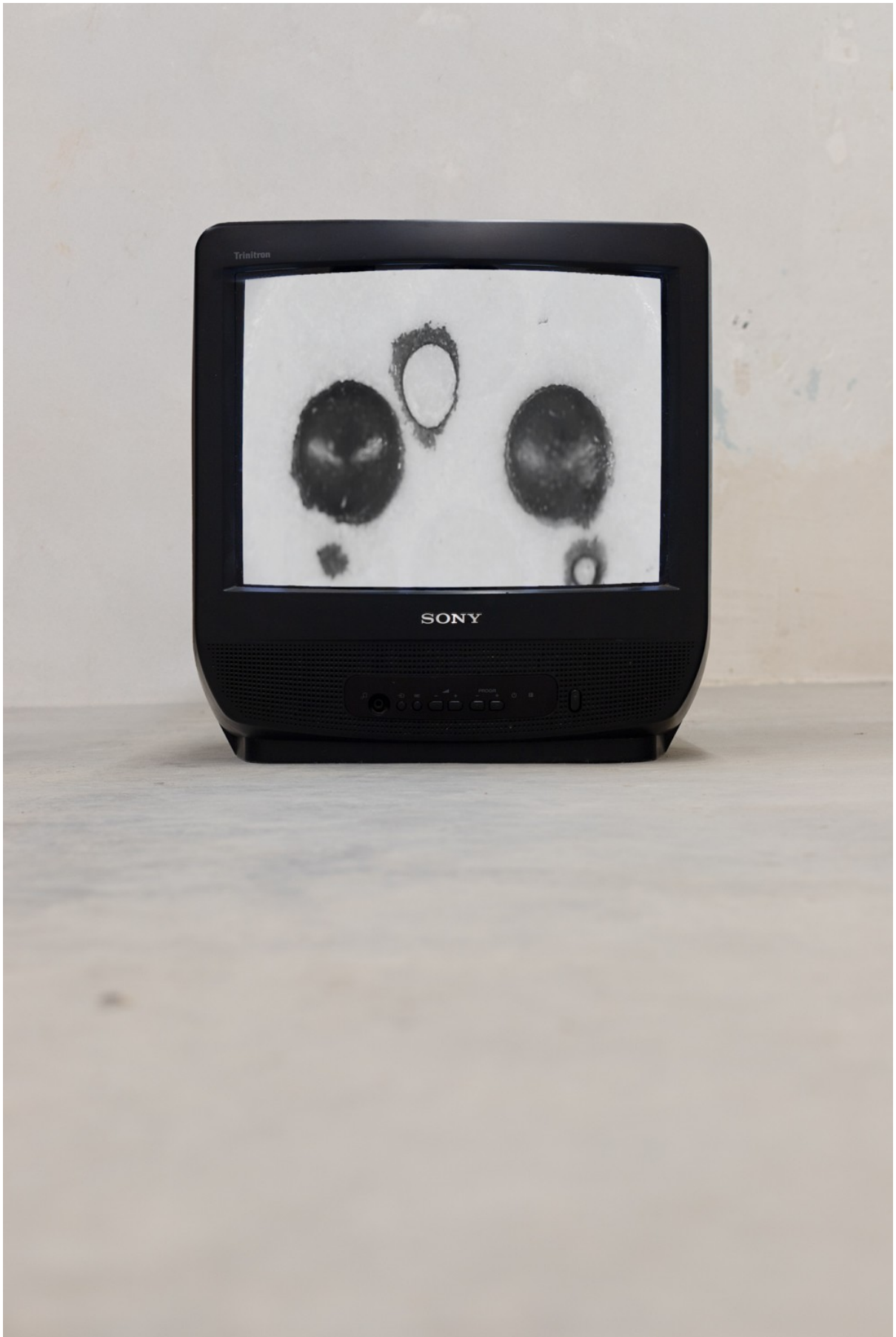
Jogo do osso, 2024