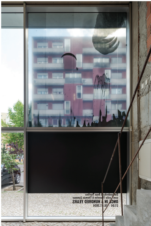
once in a hundred years , vista da instalação, 2024 mural na janela de landovka/Tsyrlina once in a hundred years-6.tiff