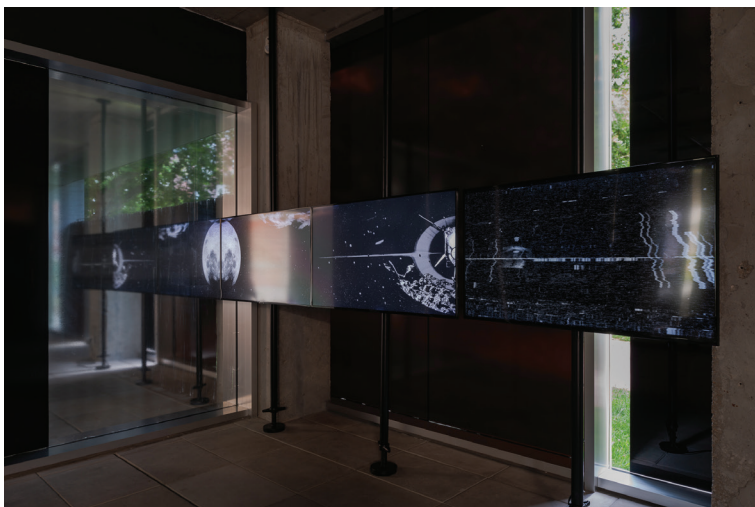
landovka/Tsyrlina, once in a hundred years , 2024 instalação site-specific, múltiplos écrans, vídeo, som once in a hundred years-10.tiff