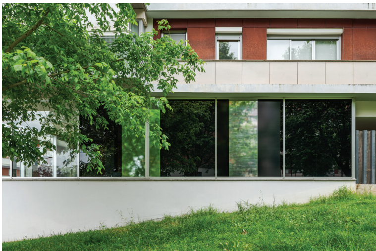
once in a hundred years , vista da instalação, 2024 once in a hundred years-17.tiff