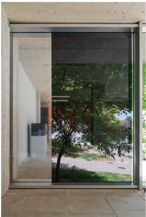
once in a hundred years , vista da instalação, 2024 once in a hundred years-18.tiff