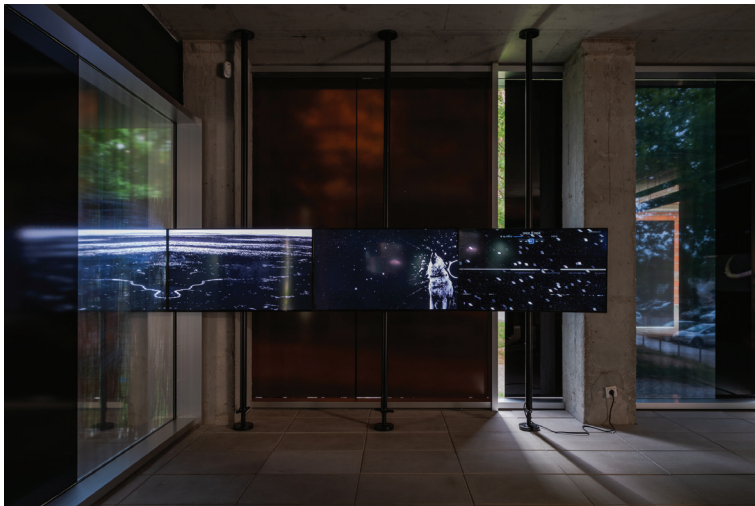
landovka/Tsyrlina, once in a hundred years , 2024 instalação site-specific, múltiplos écrans, vídeo, som once in a hundred years-9.tiff