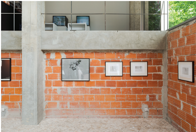
once in a hundred years , vista da instalação, 2024 desenhos e monotípias de Thomas Zimmer once in a hundred years-1.tiff