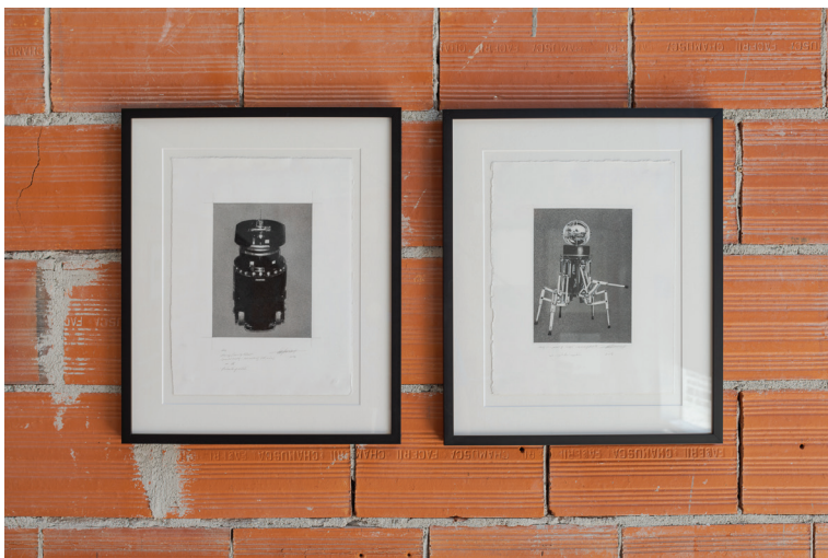
Thomas Zimmer, Portrait of 'Denning Security Robot' , 2004 / Portrait of 'ODEX' , 2006 estudo para a série Portraits of Robots once in a hundred years-3.tiff