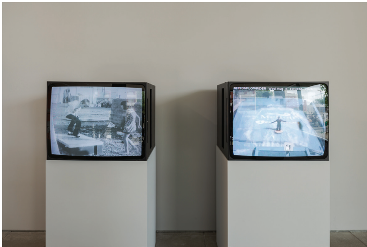
Thornton, landovka/Tsyrlina, beloved/memory , 2024 instalação site-specific em monitores CRT, vídeo e filme de 16 mm transferido para vídeo, som once in a hundred years-8.tiff