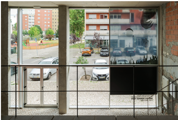
once in a hundred years , vista da instalação, 2024 once in a hundred years-5.tiff