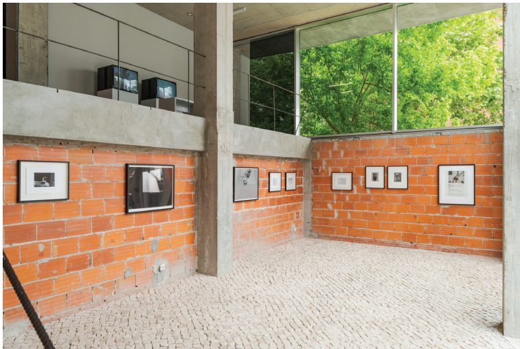
once in a hundred years , vista da instalação, 2024 desenhos e monotípias de Thomas Zimmer once in a hundred years-2.tiff