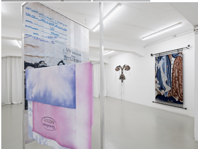
Exhibition view Reproductive Matters KH Künstler:innenhaus Bremen 2024