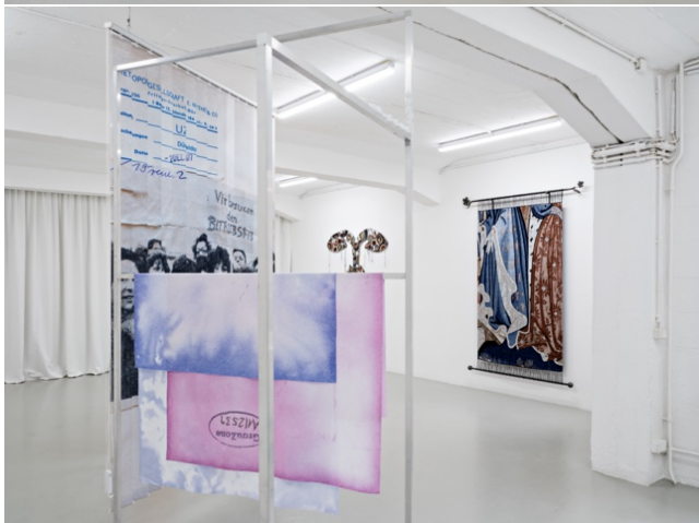
Exhibition view Reproductive Matters KH Künstler:innenhaus Bremen 2024