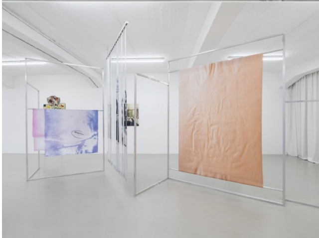
Exhibition view Reproductive Matters KH Künstler:innenhaus Bremen 2024