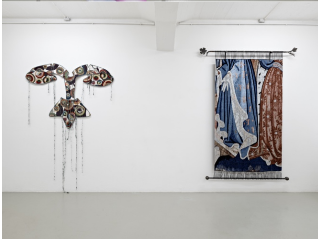
Left: Ana Navas Una fuente iluminada por luces de colores , 2022