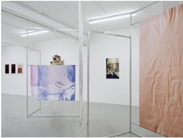
Exhibition view Reproductive Matters KH Künstler:innenhaus Bremen 2024