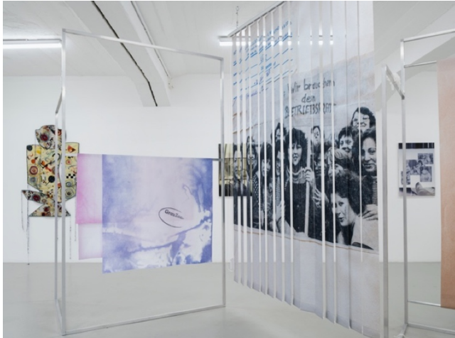
Exhibition view Reproductive Matters KH Künstler:innenhaus Bremen 2024