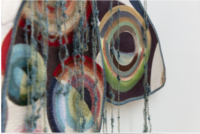
Ana Navas Una fuente iluminada por luces de colores (Detail), 2022

Courtesy Ana Navas and Sperling, München