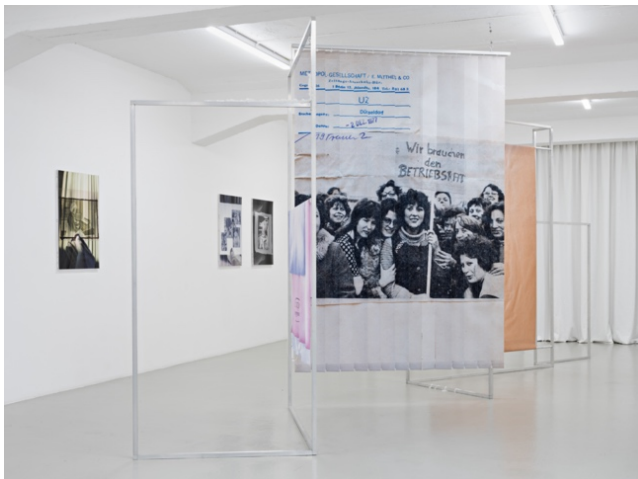
Julia Lübbecke Kleber und Falten , 2023

Installation view Reproductive Matters KH Künstler:innenhaus Bremen 2024