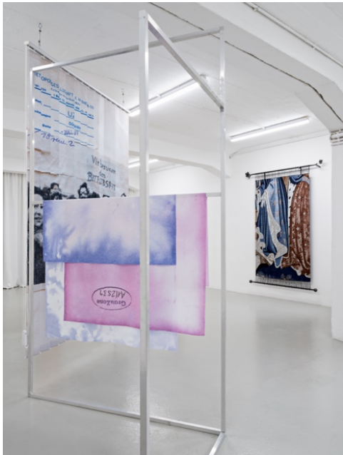
Left: Julia Lübbecke Kleber und Falten , 2023 VG Bild-Kunst Bonn 2024