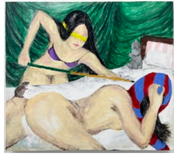
Raiki Yamamoto Stunner 2024 53 x 45.5cm Acrylic on canvas