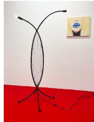
Raiki Yamamoto Black Stage 2024 92 x 105 x 57.5 cm Acrylic on canvas, velvet, wood