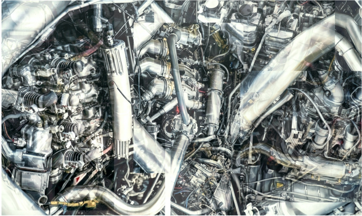
Ai Makita, 解剖と改造 (Dissection/Modification), 2024, oil on canvas, 180 x 300cm

さらには牧田が機械やエンジンを描き始めた初期からの特徴として視点の誘導が挙げられますが、画面上に立体的に絡み合っている要素はそのほとんど同一レイヤー上にあり、奥行きといった視覚的なヒエラルキーを取り除いています。特に今回の牧田の生成された画像をベースにした作品群は伝統的な西洋絵画における明暗や遠近によって生み出されるフォーカスポイントよりも、浮世絵にも見られる平面的に広がった視点誘導に近く、構成要素のサイズも誇張され歪められ、尺度が現実には即していないからこそよりリアルに見える機械風景を提示してくれるのです。