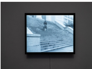
Anna Bella Geiger, Passagens 1 , 1974. Installation view, Wo wir sprechen , Kunstverein Bielefeld, 2024. Photo: Fred Dott.

* For short captions: Installation view, Wo wir sprechen , Kunstverein Bielefeld, 2024. Photo: Fred Dott.