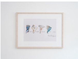
Anna Bella Geiger, Am. Latina ( Amuleto, A Mulata, A Muleta, América Latina ), 1977. Installation view, Wo wir sprechen , Kunstverein Bielefeld, 2024.