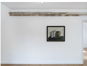
Doris Ziegler, Stilleben mit Zange , 1975. Installation view, Wo wir sprechen , Kunstverein Bielefeld, 2024.