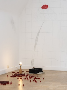
Sonja Heim, B-Ware, poliert , 2024. Detail, Wo wir sprechen , Kunstverein Bielefeld, 2024.