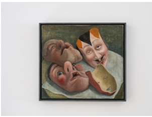
Doris Ziegler, Stilleben mit Masken , 1983/2016. Installation view, Wo wir sprechen , Kunstverein Bielefeld, 2024.