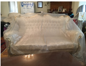
Alexandra Sheherazade Salem, Silent Echo of Time , 2024. Courtesy der Künstlerin | of the artist.