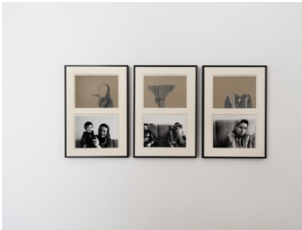
Nil Yalter, Turkish Immigrants #5. Two Women and Child , 1977. Installation view, Wo wir sprechen , Kunstverein Bielefeld, 2024. Courtesy der Künstlerin | of the artist & Sammlung Reydan Weiss | Collection Reydan Weiss. Photo: Fred Dott.