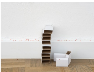
Sonja Heim, B-Ware, poliert , 2024. Detail, Wo wir sprechen , Kunstverein Bielefeld, 2024.