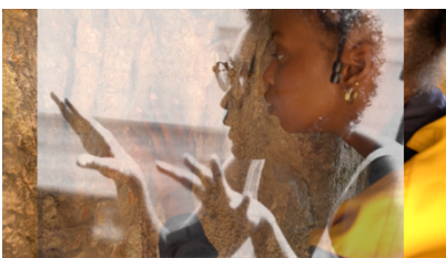
Laure Prouvost, You, My, Omma, Mama , 2023. HD Video, colour, sound, 14:23 min, Video Still. Courtesy der Künstlerin | of the artist.