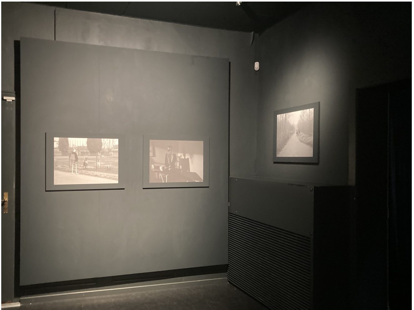
Exposition de photos de J. Klottemans à Bern en septembre 2024