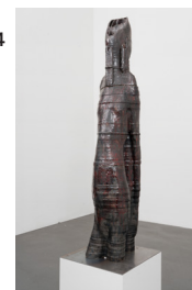
Sans titre (Maschinenmensch #3), 2024

Céramique (faïence) émaillée / Glazed ceramic (earthenware) 149 × 32 × 25 cm / 58 5/8 × 12 9/16 × 9 13/16 in.