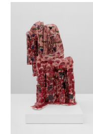
Spinario #4, 2024

Céramique (porcelaine) émaillée / Glazed ceramic (porcelain) 51,5 × 31 × 32 cm / 20 1/4 × 12 3/16 × 12 9/16 in.