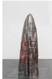
Démon #3, 2024

Céramique (faïence) émaillée / Glazed ceramic (earthenware) 117 × 31 × 23 cm / 46 1/16 × 12 3/16 × 9 in.