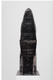
Démon #2, 2024

Céramique (faïence) émaillée / Glazed ceramic (earthenware) 108 × 46 × 31 cm / 42 1/2 × 18 1/16 × 12 3/16 in.