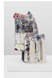
Spinario #3, 2024

Céramique (porcelaine) émaillée / Glazed ceramic (porcelain) 45 × 31 × 23 cm / 17 1/16 × 12 3/16 × 9 in.