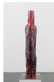
Sans titre (Maschinenmensch #2), 2024

Céramique (faïence) émaillée / Glazed ceramic (earthenware) 88 × 31 × 24 cm / 34 5/8 × 12 3/16 × 9 7/16 in.