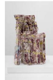
Spinario #2, 2024

Céramique (porcelaine) émaillée / Glazed ceramic (porcelain) 51,1 × 31 × 30 cm / 20 1/4 × 12 3/16 × 11 3/4 in.