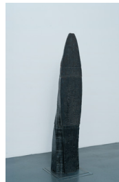
Démon #6, 2024

Céramique (faïence) émaillée / Glazed ceramic (earthenware) 137 × 46,5 × 34 cm / 53 7/8 × 18 1/4 × 13 3/8 in.