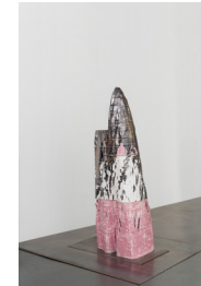
Démon #5, 2024

Céramique (faïence) émaillée / Glazed ceramic (earthenware) 142 × 48 × 34 cm / 55 7/8 × 18 7/8 × 13 3/8 in.