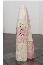
Démon #4, 2024

Céramique (faïence) émaillée / Glazed ceramic (earthenware) 143,5 × 45 × 31 cm / 56 7/16 × 17 1/16 × 12 3/16 in.