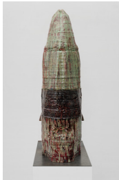
Démon #1, 2024

3, rue du Cloître Saint-Merri, Paris 4 e