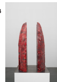
Sans titre (Replicant) #0, 2024

Céramique (faïence) émaillée / Glazed ceramic (earthenware) 155 × 40 × 30 cm / 61 × 15 11/16 × 11 3/4 in.