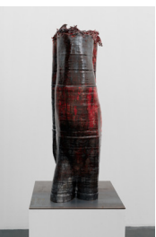
Sans titre (Maschinenmensch #1), 2024

Céramique (faïence) émaillée / Glazed ceramic (earthenware) 63 × 30 × 23 cm / 24 3/4 × 11 3/4 × 9 in.