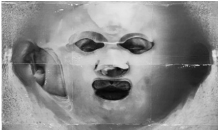
4 "-Hey Siri, can you touch the back of CDs? -Don't touch the back of CDs with anything. -Hey Siri, play "The Narcissist II" by Dean Blunt -Now playing "The Narcissist II" by Dean Blunt."

2024 Pigment, acrylic on canvas 183 x 120 cm