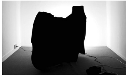
6 'Remember that you may forward this email to all guests included in this reservation allowing them to also complete their details and save time. We hope you have a great trip and we look forward to welcoming you'

2024 Steaticam, plastic, fabric Variable dimensions