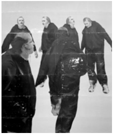
1 'Alex Katz still owes me money. $262.5'

2024 Pigment, acrylic on canvas 220 x 183 cm