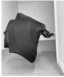
5 'I eat breakfast in the morning'

2024 Pigment, acrylic on canvas 183 x 120 cm