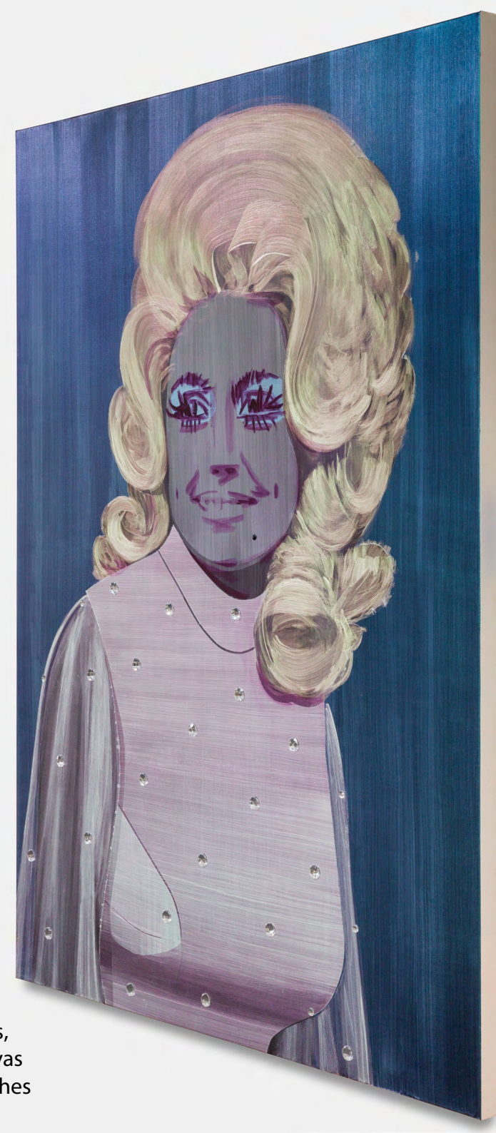
Nina Childress Big Dolly , 2024

Acrylic, iridescent pigments, rhinestones and oil on canvas 210 x 150 cm | 82,5 x 59 inches