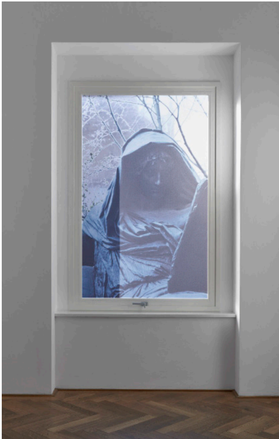
Marie Matusz, Fellow Prisoners , 2025, Installationsansicht, in: Marie Matusz, Reservoir , Kunsthalle Basel, 2025