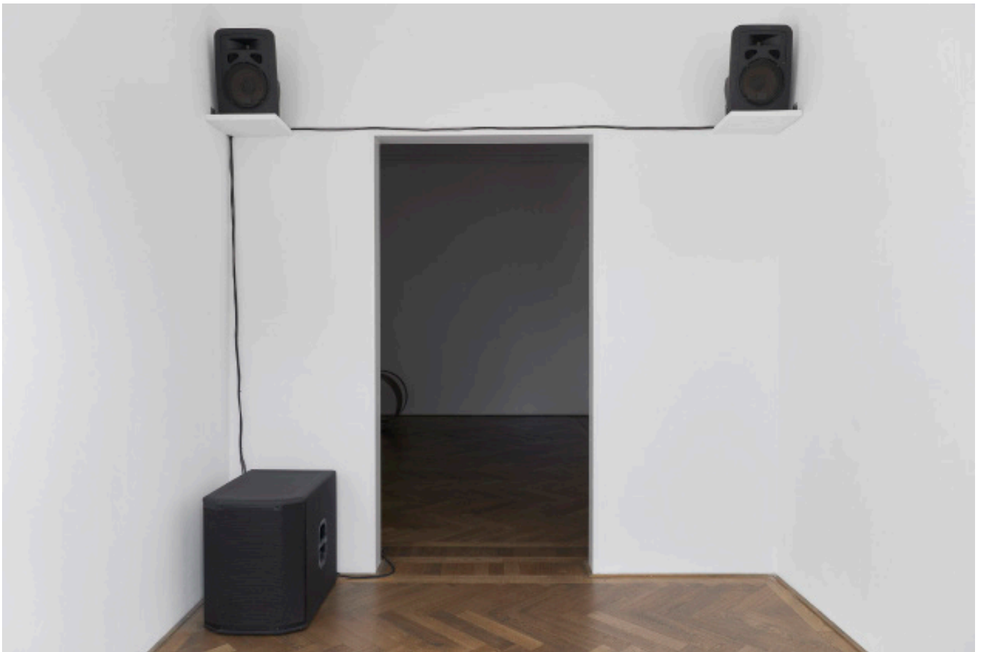
Marie Matusz, Franco Caggese, Reservoir , 2025, Detail, in: Marie Matusz, Reservoir , Kunsthalle Basel, 2025, Foto: Philipp Hänger / Kunsthalle Basel