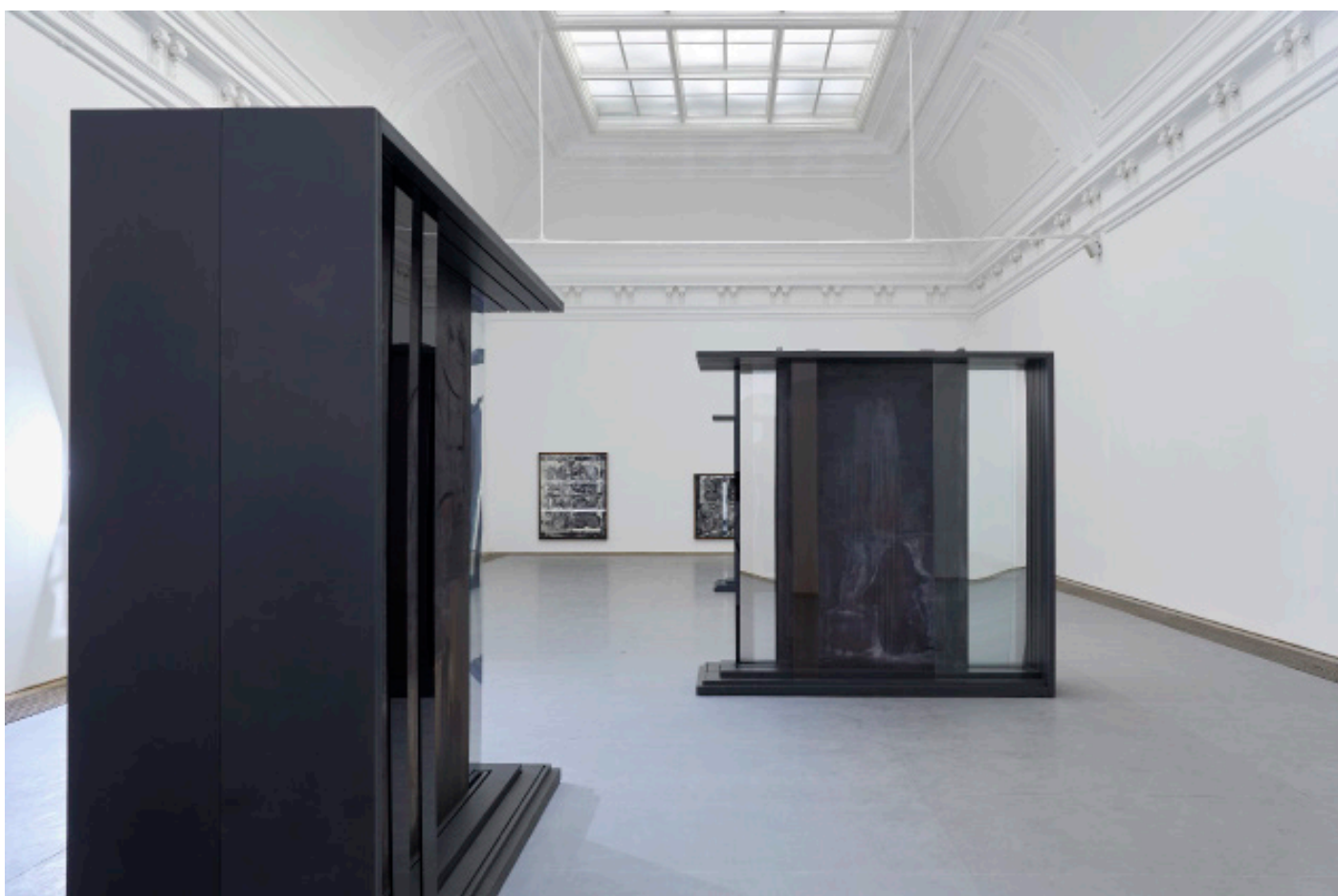
Marie Matusz, Reservoir , Ausstellungsansicht, Kunsthalle Basel, 2025, Foto: Philipp Hänger / Kunsthalle Basel