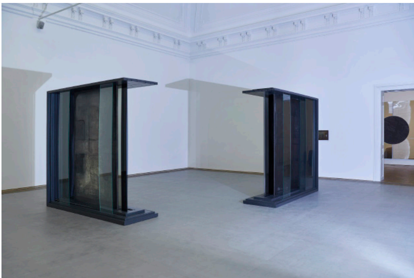
Marie Matusz, Reservoir , Ausstellungsansicht, Kunsthalle Basel, 2025, Foto: Philipp Hänger / Kunsthalle Basel