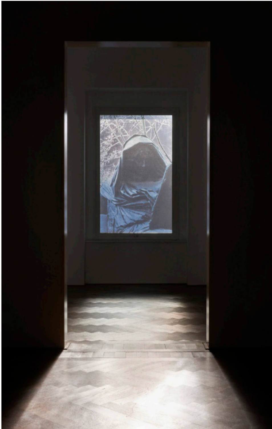
Marie Matusz, Fellow Prisoners , 2025, Installationsansicht, in: Marie Matusz, Reservoir , Kunsthalle Basel, 2025, Foto: Philipp Hänger / Kunsthalle Basel