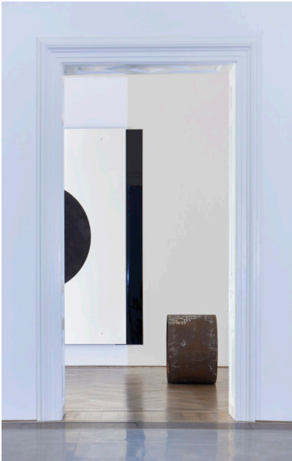
Marie Matusz, Reservoir , Ausstellungsansicht, Kunsthalle Basel, 2025, Foto: Philipp Hänger / Kunsthalle Basel