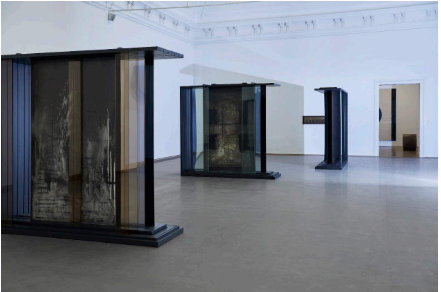
Marie Matusz, Reservoir , Ausstellungsansicht, Kunsthalle Basel, 2025, Foto: Philipp Hänger / Kunsthalle Basel