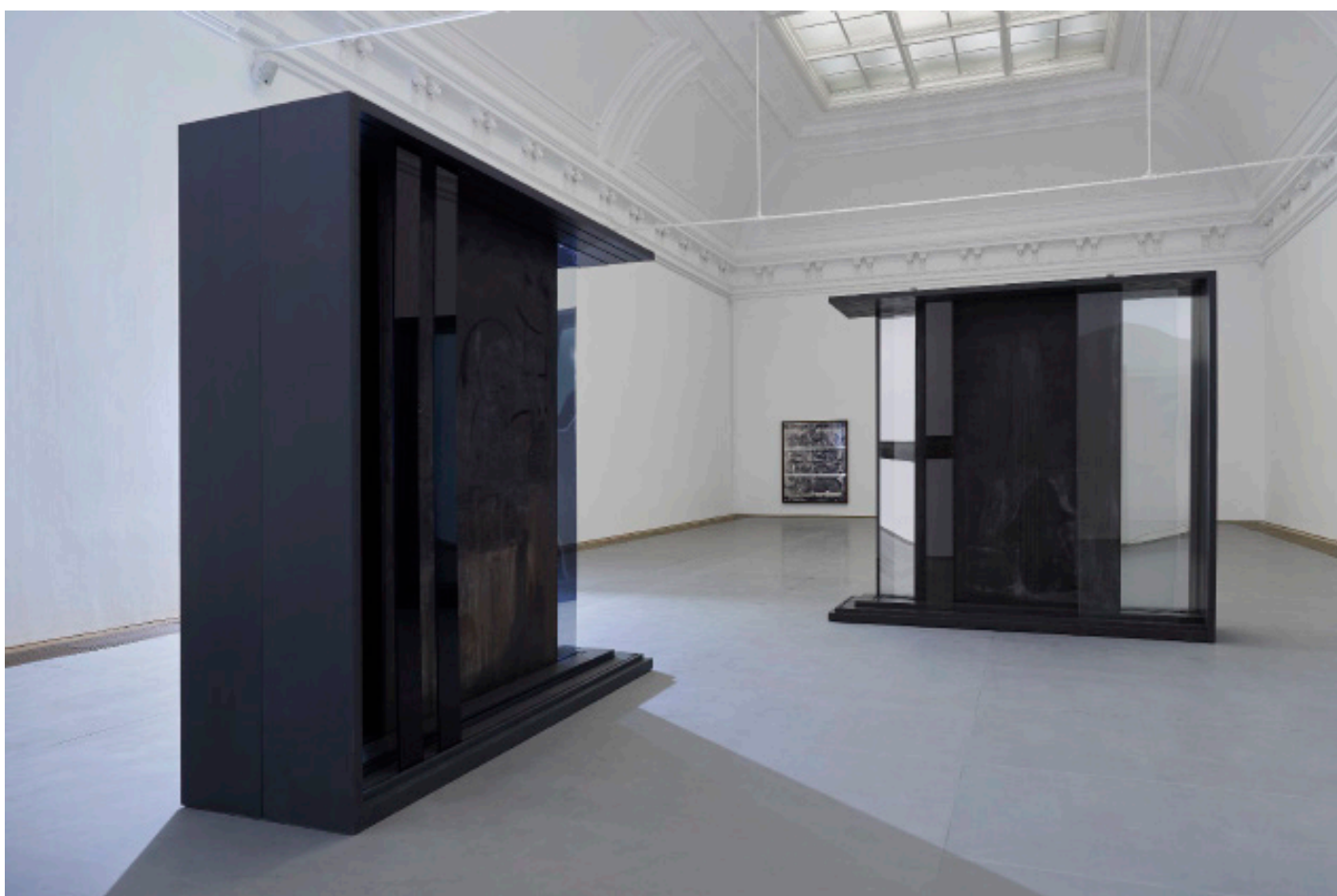
Marie Matusz, Reservoir , Ausstellungsansicht, Kunsthalle Basel, 2025, Foto: Philipp Hänger / Kunsthalle Basel