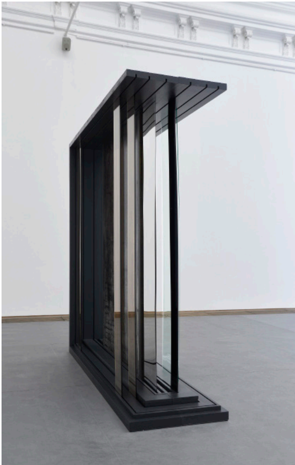
Marie Matusz, Towards Vanishing: Hommage-Letter, Image-Density , 2025; Towards Vanishing: Baroque Seeker, I Would Like To See The Tip Of Your Shoes , 2025, Installationsansicht, in: Marie Matusz, Reservoir , Kunsthalle Basel, 2025, Foto: Philipp Hänger / Kunsthalle Basel