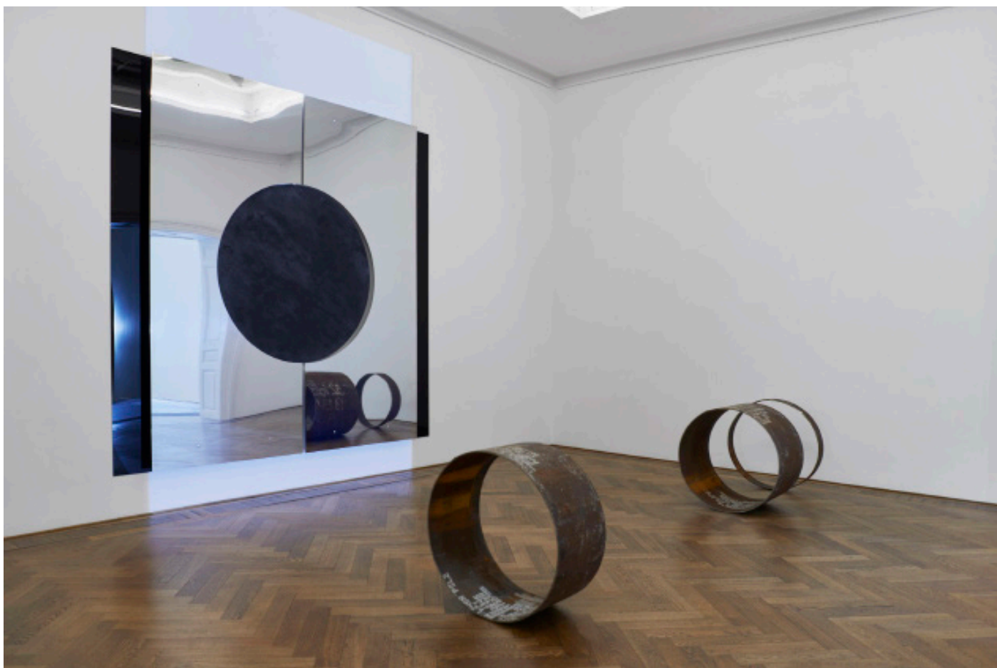
Marie Matusz, Reservoir , Ausstellungsansicht, Kunsthalle Basel, 2025, Foto: Philipp Hänger / Kunsthalle Basel