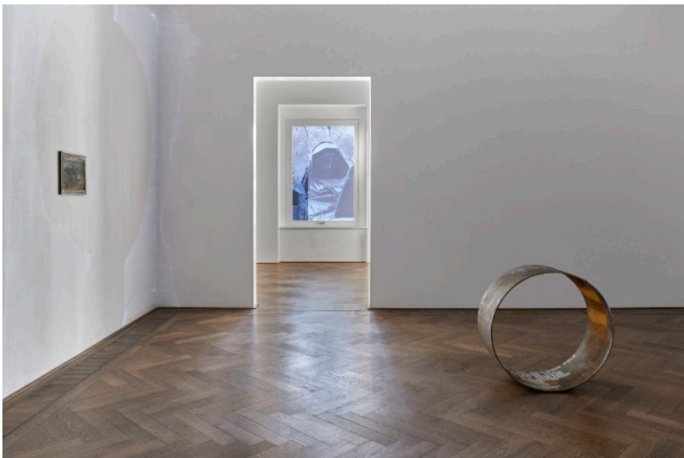
Marie Matusz, Reservoir , Ausstellungsansicht, Kunsthalle Basel, 2025, Foto: Philipp Hänger / Kunsthalle Basel