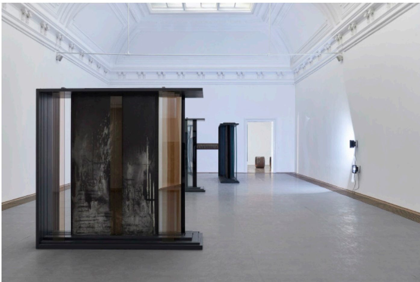
Marie Matusz, Reservoir , Ausstellungsansicht, Kunsthalle Basel, 2025, Foto: Philipp Hänger / Kunsthalle Basel

Pressekontakt / Press Contact Sina Bauer, Kunsthalle Basel, Steinenberg 7, CH-4051 Basel T: +41 61 206 99 11, E: press@kunsthallebasel.ch