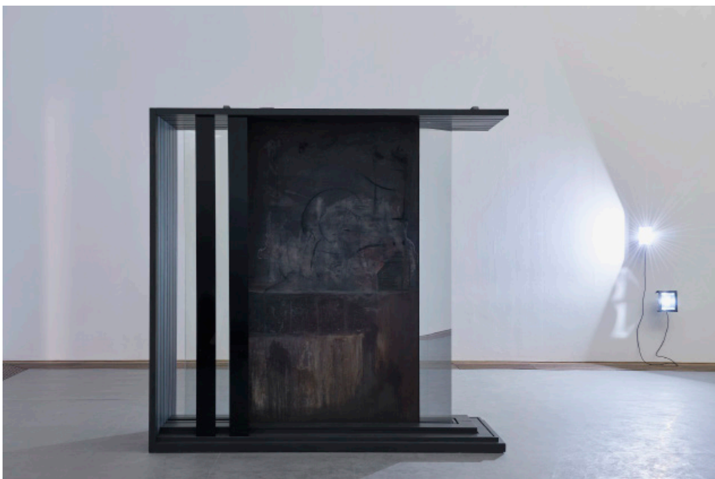
Marie Matusz, Towards Vanishing: Things Fade, We Must Admit , 2025, Installationsansicht, in: Marie Matusz, Reservoir , Kunsthalle Basel, 2025, Foto: Philipp Hänger / Kunsthalle Basel