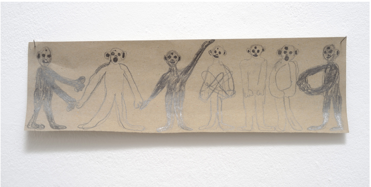
Philipp Schwab T.o. €urütmy, Schaugame maison (am ogust 190010) , 2016 Pencil on paper 9 x 29,5 cm