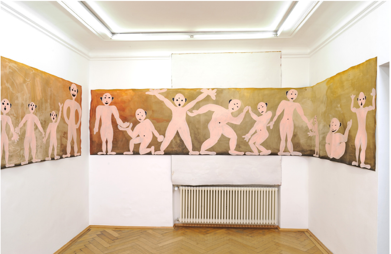
Philipp Schwab Nakkiz un.end.Licht , 2016 Acrylic on canvas 110 x 530,01∞ cm