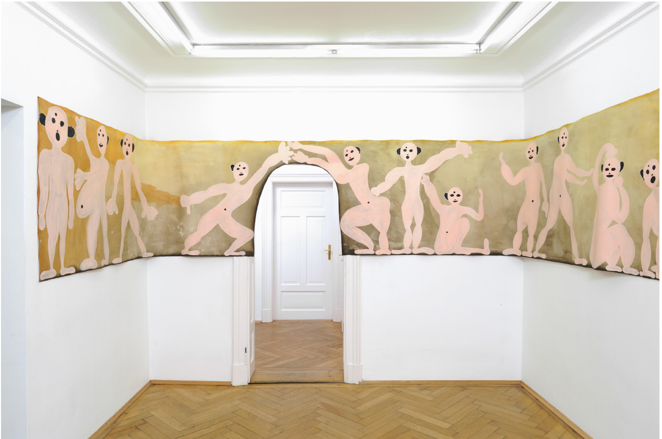
Philipp Schwalb Nakkiz un.end.LichT , 2016 Acrylic on canvas 110 x 1000,01∞ cm