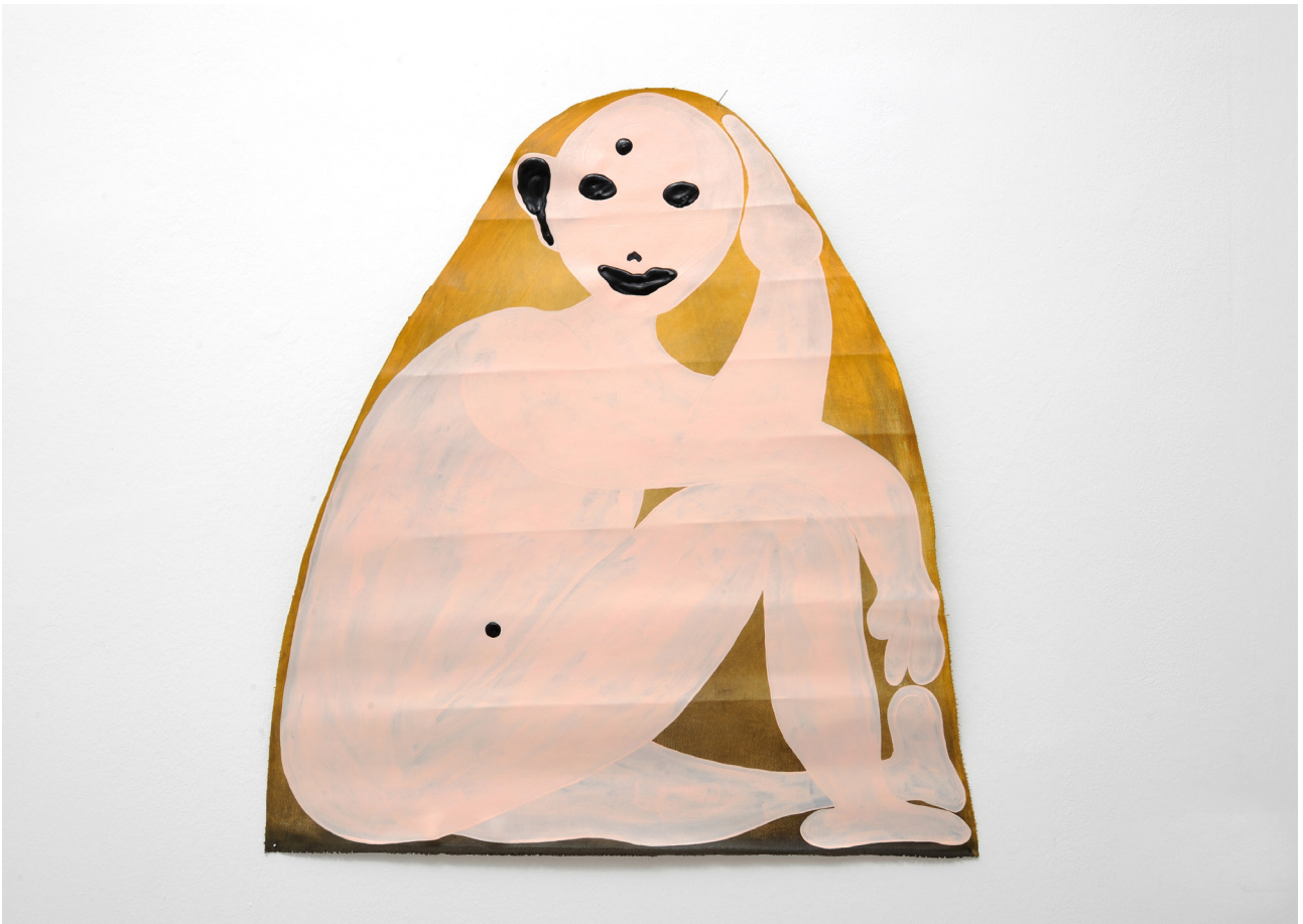
Philipp Schwalb Nakki in unendliche, leichtpsüchodelice Värdfun , 2016 Acrylic on canvas 82 x 77 cm