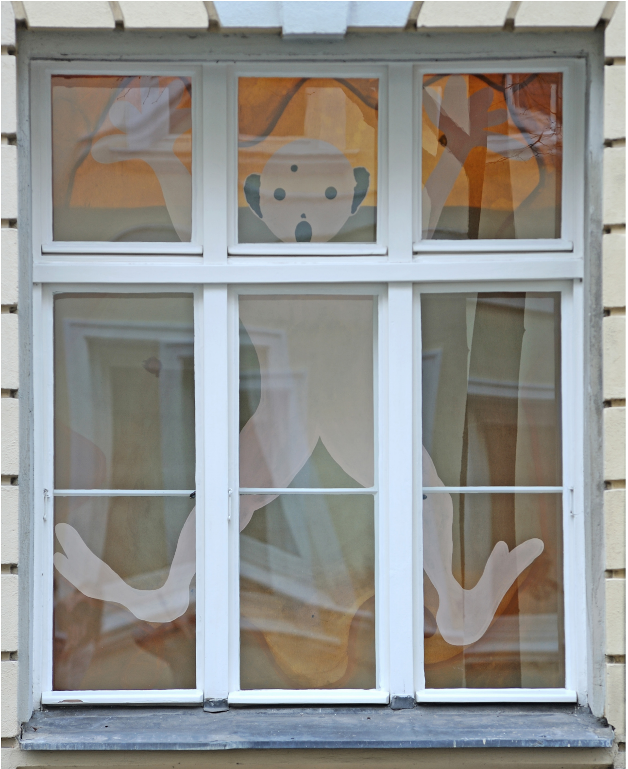
Philipp Schwalb Nakki in Lichtkammagamesä T.o.dLichT , 2016 Acrylic on canvas 216 x 177 cm