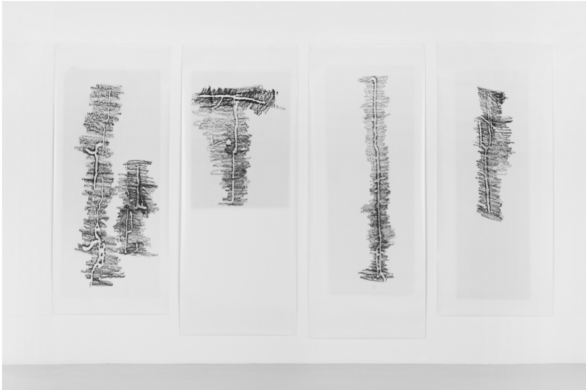
Untitled 2005 4 c-prints (printed by the artist) Variable ; 246 x 106,5 cm, 265 x 106,5 cm, 268 x 106,5 cm, 250 x 106,5 cm Unique