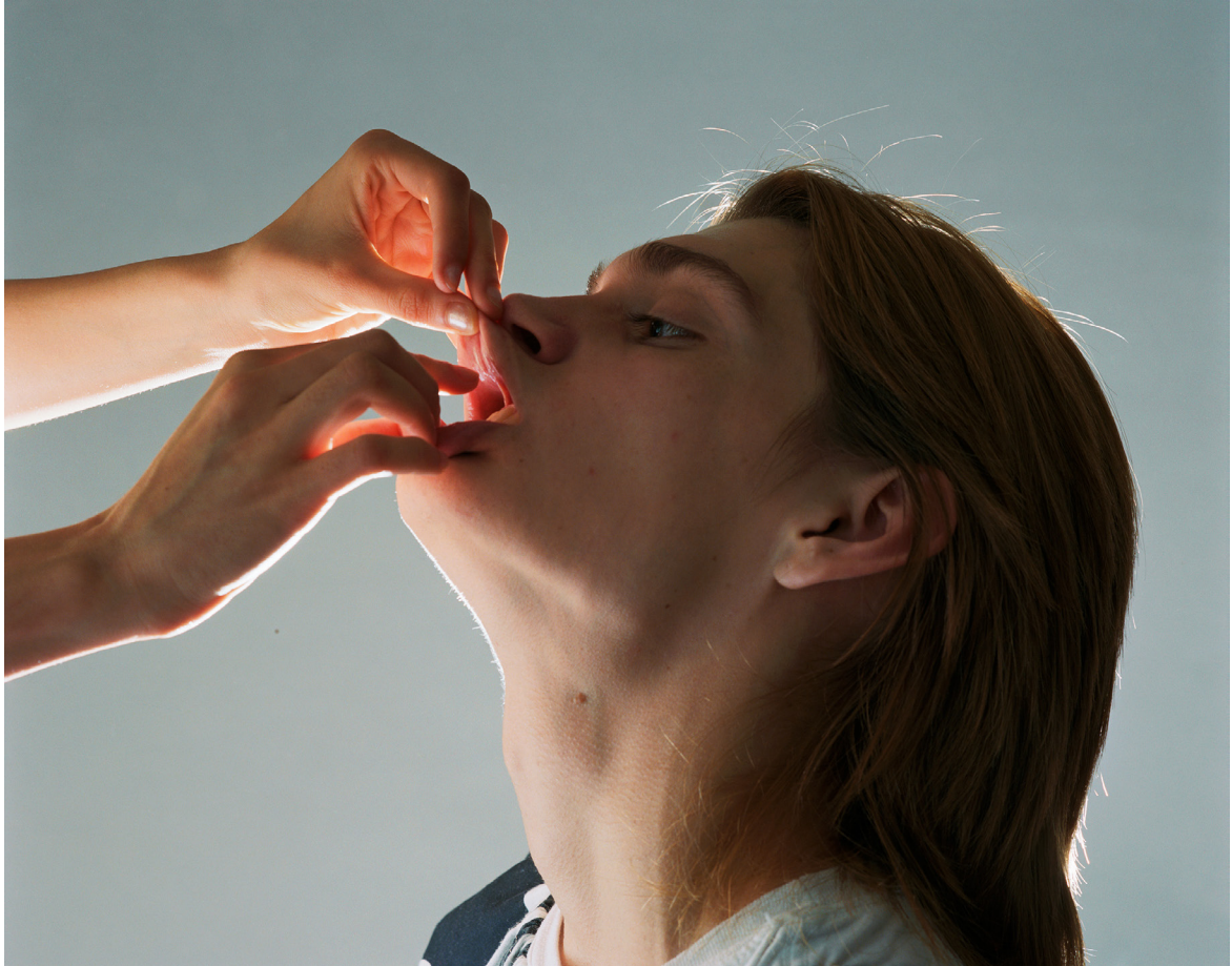
Head and Fingers 2019-2022 Chromogenic print, Kodak Endura paper 62,5 x 78,5 cm Edition of 3 + 1 AP