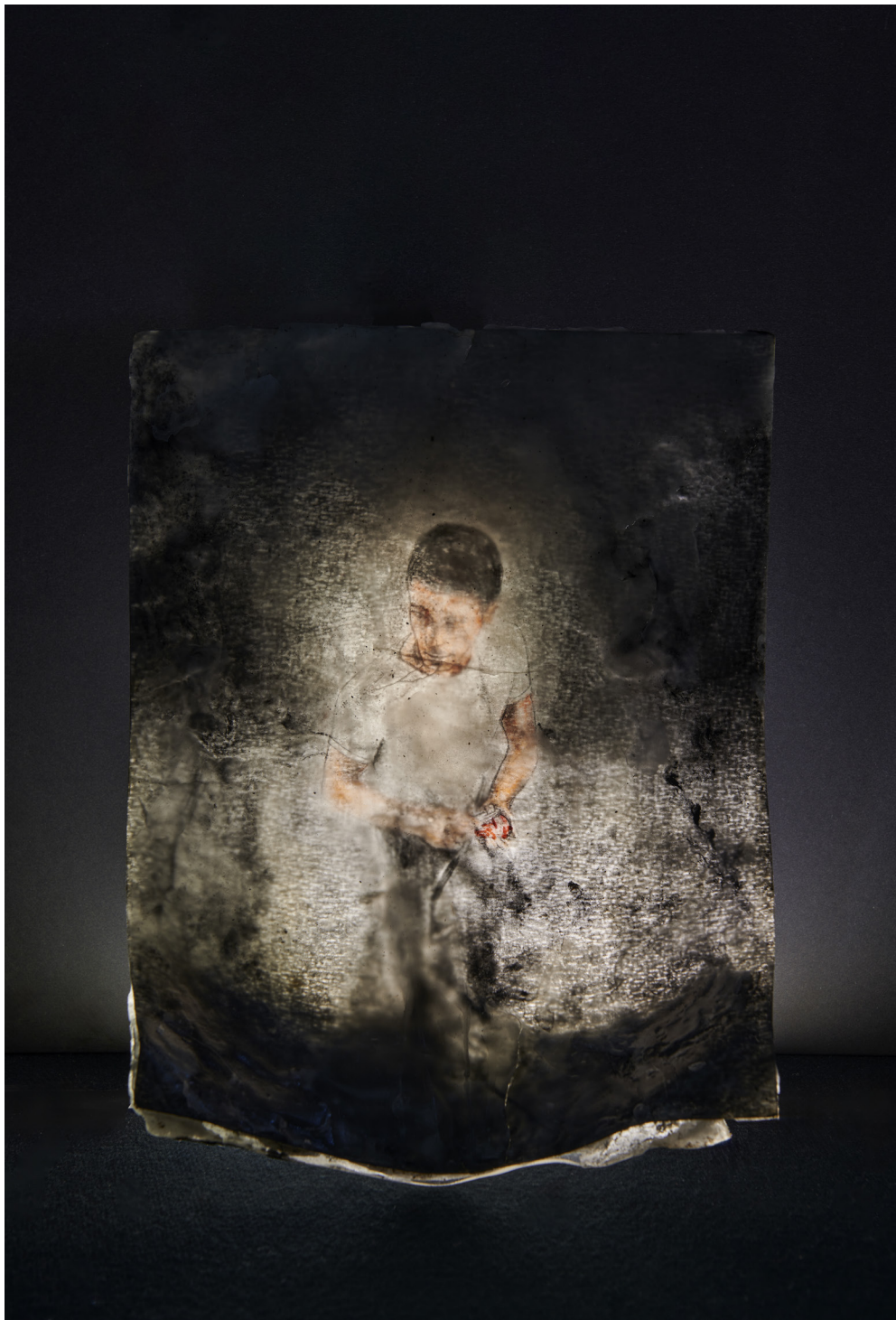
Untitled 1996 Pencil on paper, paraffin wax, pigment 24 x 32 cm Unique