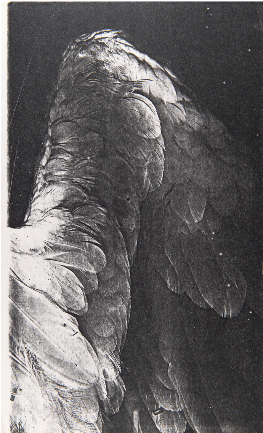
Untitled (Swan's wing) 1978 Xerographie 21,6 x 35,2 cm Unique