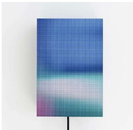
the series of Today , 2025 Acrylic, LED matrix monitor, speaker, micro PC, 7-segment LED, power supply, etc. Technical support: QUMU, Photo: Riko Takagi

As Nomura's first solo exhibition at parcel, this show presents a continuation of his past explorations while pointing toward new directions in his practice. Having long navigated the boundary between photography and sculpture, his engagement with video introduces a different sense of time and a new approach to documentation. More than a simple video experience, this exhibition invites viewers to reconsider the meanings of seeing, existing, and remembering.