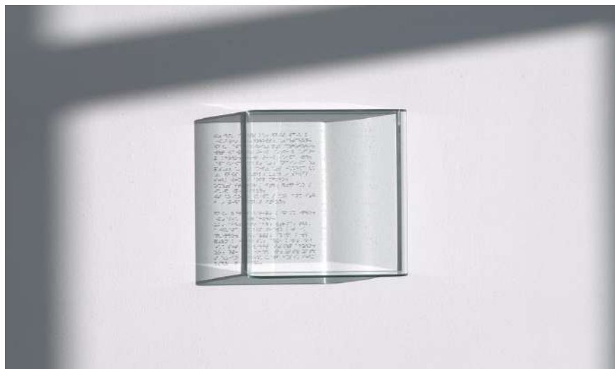
the series of Gift, 2024 Letters that never reached anyone, glass box, glass ball, stainless steel, 31.8 x 30.2 x 7 cm

parcel では初の個展となる本展では、野村のこれまでの表現の延長線上にありながら、新たな展開を示唆します。写真と彫刻の狭間で思索を重ねてきた彼が映像へと接近することで、これまでと異なる時間の流れ、記録のあり方が立ち現れます。本展では、鑑賞者にとって単なる映像体験ではなく、「見ること」「存在すること」「記憶すること」の意味をあらためて問い直します。