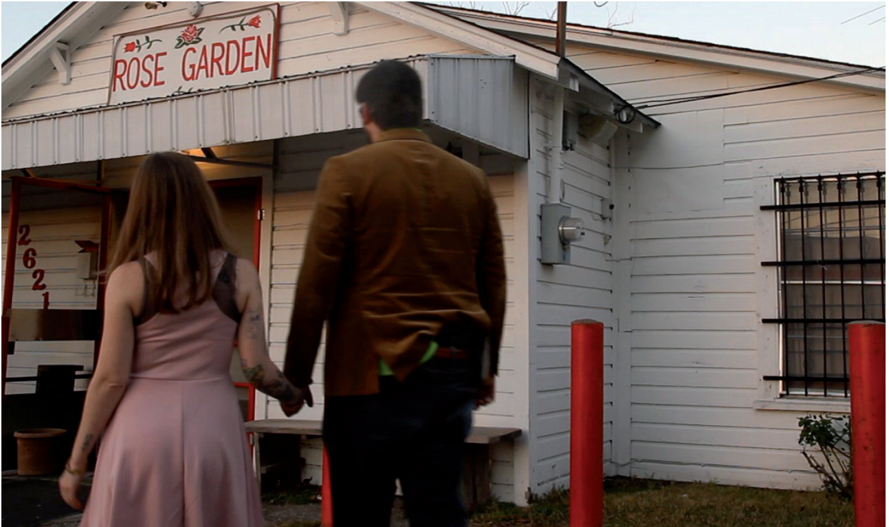
Rose Garden, 2014 Digital HD video, color, sound 8'57" Ed. 5 + II A.P.