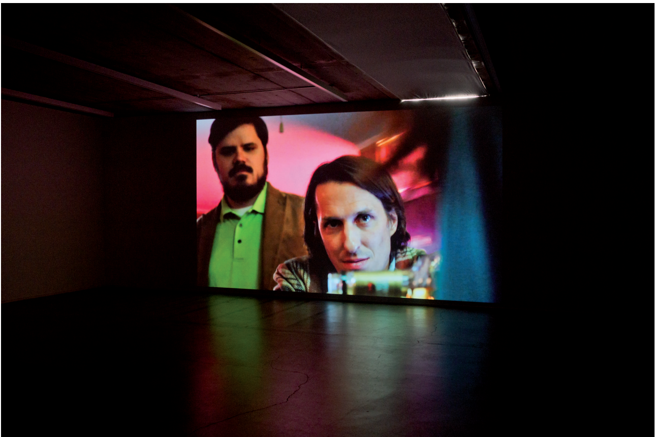
Deweer Gallery, 2016, exhibition views