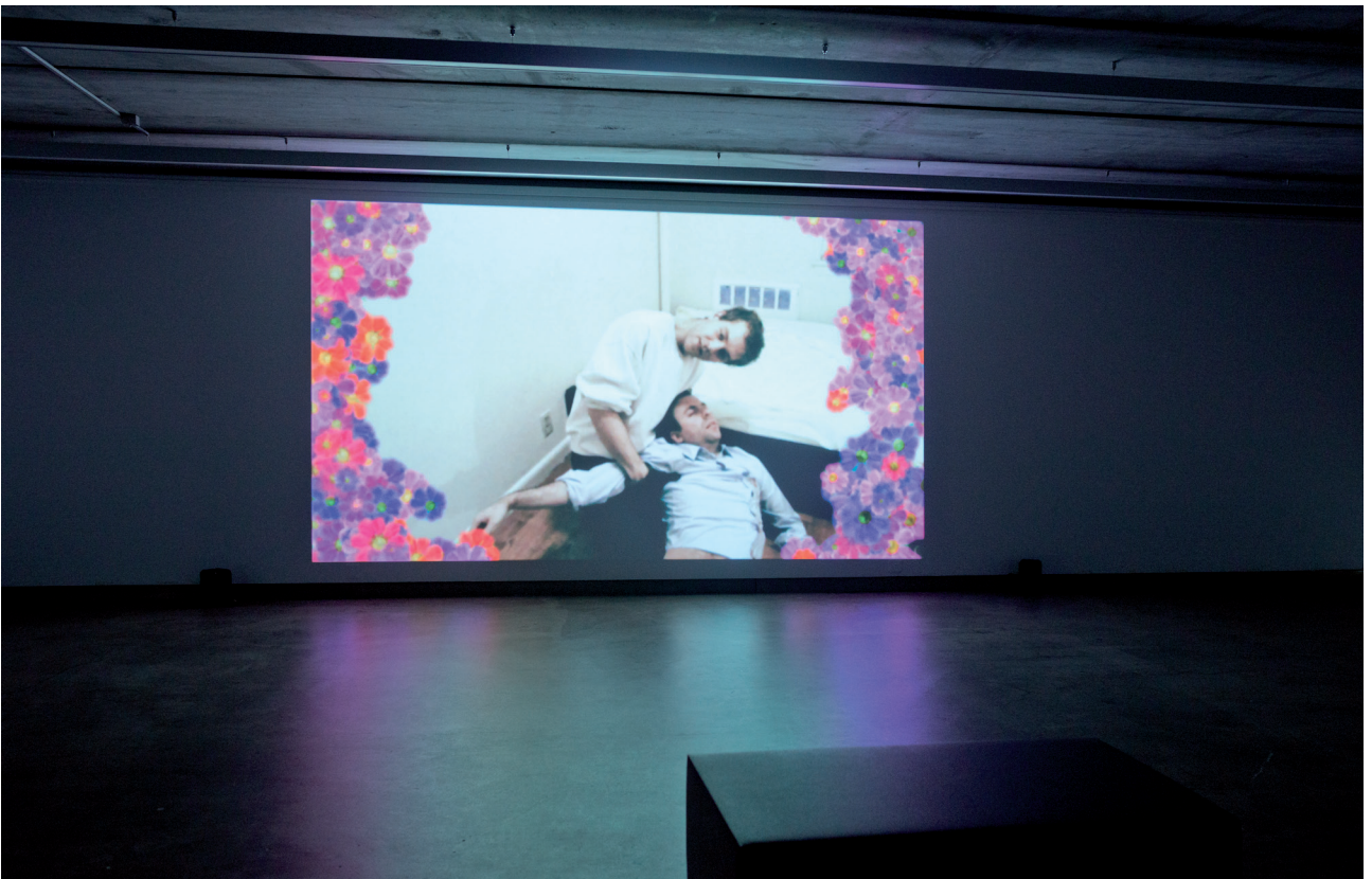
Deweer Gallery, 2016, exhibition views