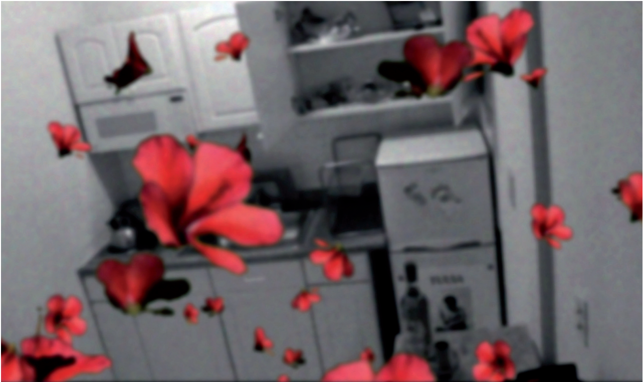
Siren, 2014 Digital HD video, color, sound 14'39" Ed. 5 + II A.P.