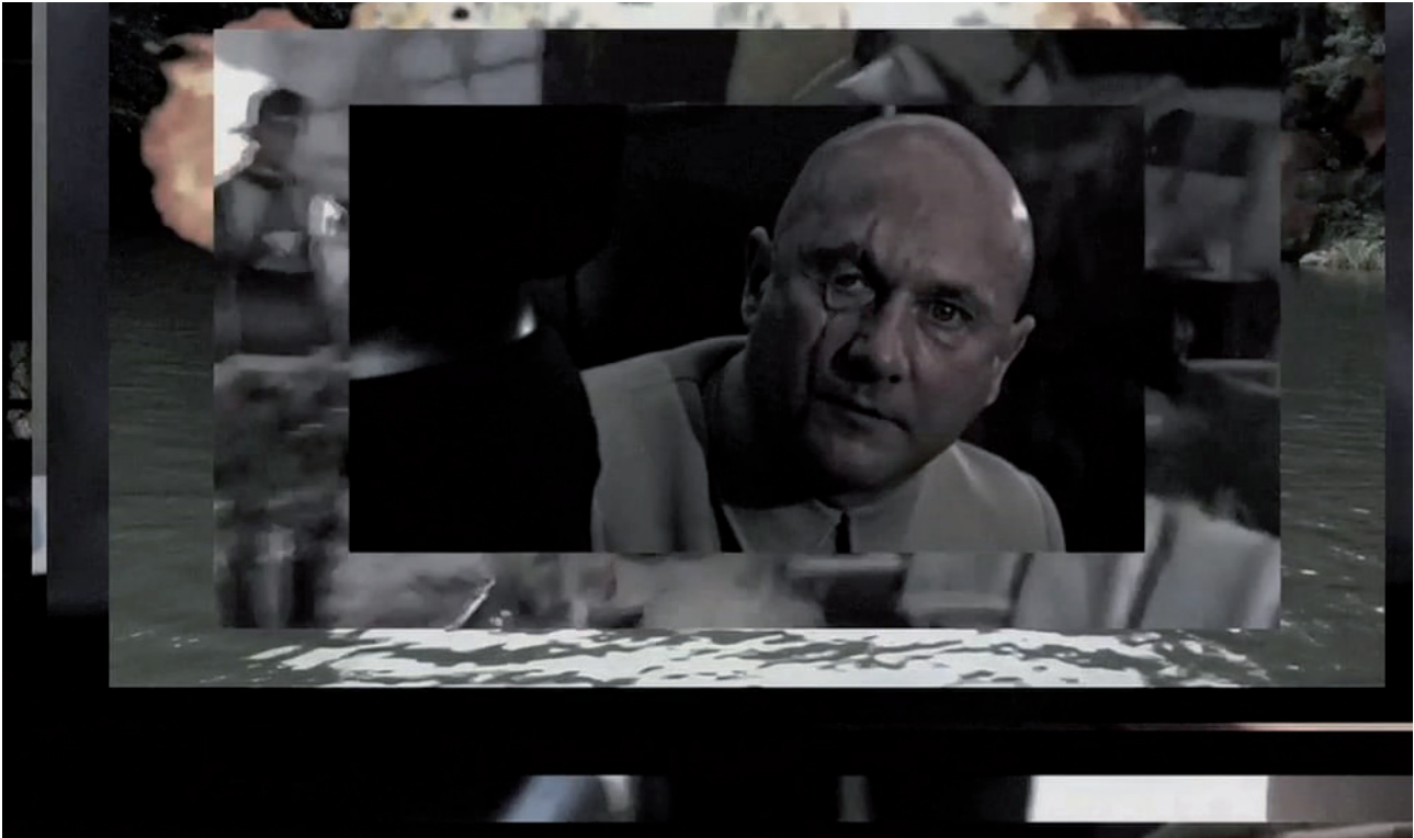
Metamorphosis (2015) Digital HD video, color, sound 11'07" Ed. 5 + II A.P.