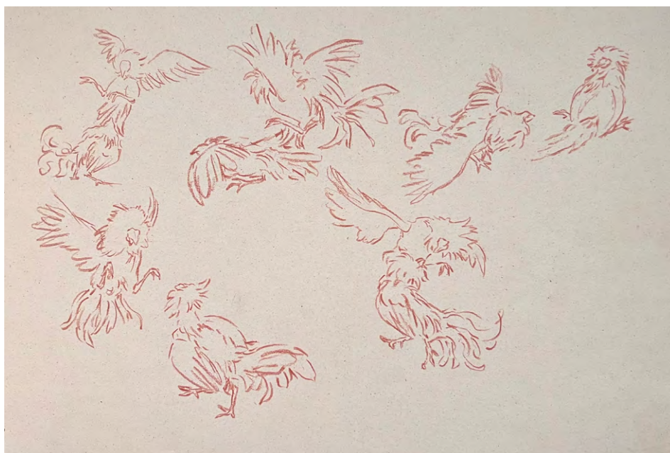
Pietro Fachini, Pelea #2 (2025), sanguigna su carta, 21 x 29.7 cm, courtesy the artist and ArtNoble Gallery

La sua pratica si è nutrita inoltre di periodi di ricerca in situ: la Residenza artistica a Oaxaca (Messico, 2024) e la residenza Tagli a Stromboli (Italia, 2023), momenti che hanno consolidato il legame tra processo pittorico, geografia dei materiali e saperi locali.