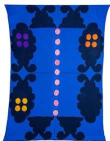
Maja Behrmann, Ohne Titel (Schamani), 2023