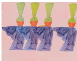
Maja Behrmann, Ohne Titel (Parade), 2020