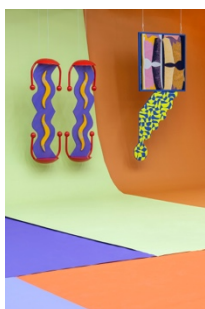
Maja Behrmann: stages, Galaxie Neuer Künste, Halle (Saale), 2023, Foto: Studio kela-mo