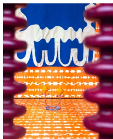
Maja Behrmann, Montage, Kunststiftung Kunze, Gifhorn, 2024