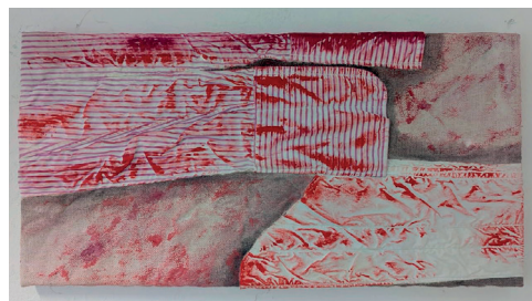
Giulietta Ockenfuß 2025 in private Acryl, gefundene Objekte, Lippenstift auf Leinwand 30,5 x 60 cm

Preise auf Anfrage. pip.munich@gmail.com pip-munich.com