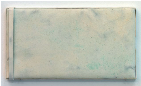
Jakob Forster 2025 gilder's pillow Papier, Karton, Leim, Nägel, Holz 15 x 27,5 x 1,3 cm