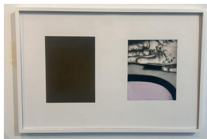
Marta Riniker-Radich 2025 Bonds colored pencil, pencil, wax crayon and pigment powder on paper 36,5 x 55 cm

Preise auf Anfrage. pip.munich@gmail.com pip-munich.com