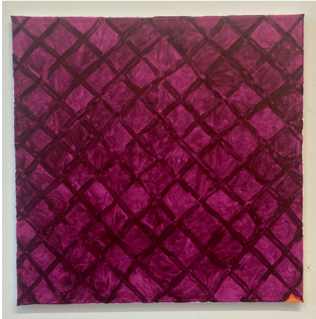
Philipp Schwalb 2025 Surfaces: Schwester_Daughter / day and night Maasreflections 60 x 60 cm acryl, gouache and oil on canvas