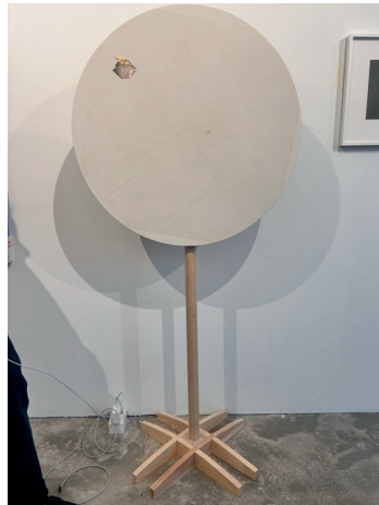
Jakob Forster 2024 Don't kiss me I'm in training Knochenleim, Champagnerkreide, Papier, Leim, Vergolderleim, Blatt- gold, Blattsilber, Holz, 70 x 35 x 148,5 cm