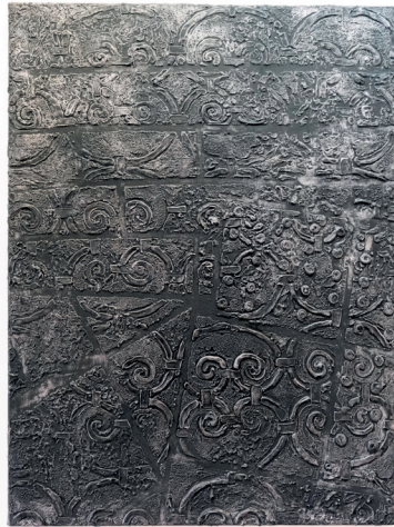
Daniel Giles 2025 Untitled Modelling paste acrylic paint and black gesso on primed canvas Durchmesser 55cm