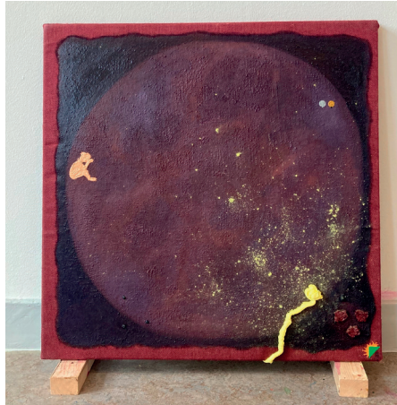
Philipp Schwalb 2025 Surfaces: Mutter_Mother / Geburt im Printemps while playing Kaiawase 70 x 70 cm acryl, gouache and oil on fabric