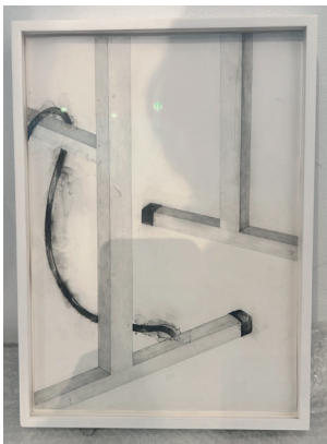
Marta Riniker-Radich 2025 Bonds pencil on paper 32,5 x 22,5 cm