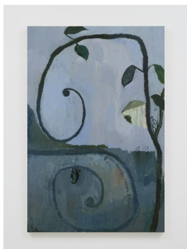
Fu Nagasawa, "Scrollwork", 2026 Oil on canvas 180.3 x 120.2 cm

Wed – Sun 11:00 – 19:00 Closed on Mon, Tue and National Holidays