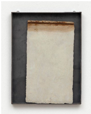
Joseph Beuys Fettwinkel , 1962 Gips und Fett in verglastem Zinkblechkasten 78,2 x 60 x 4,2 cm