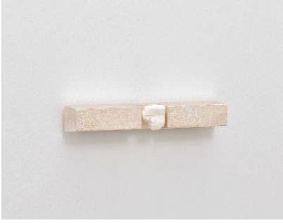
Grant Mooney Fe.(i) , 2025 Sepiaschulp, Gusseisen, Stahl, Nickel, Gusskörner, galvanisiertes Silber 46 x 7 x 7 cm