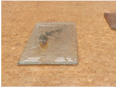
Olga Balema Untitled , 2025 PVC-Folie, Wasser, verschiedene Materialien 184 x 120 x 9 cm