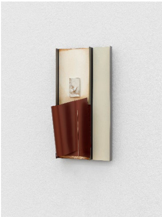
Grant Mooney Housing (c.) xi , 2024 Stahl, galvanisierter Stahl, Silber, Messing, Neodym, kupferbeschichtetes Polyethylen, Farbe, Polymerharz, Eisenoxid 35,6 x 17,8 x 8,9 cm