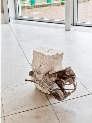
Grant Mooney Partials i, (Gain c.) , 2024 Gips, Bronze 56,5 x 50 x 70 cm