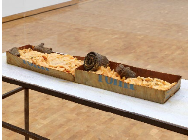
Joseph Beuys Aus dem Maschinenraum, Anhänger , 1977 „Romi“-Margarine und Filz in Pappkartons 111,8 x 31,8 x 16,5 cm