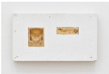
Patricia L. Boyd Borrowed Time XI, XII (Amant, 09/15/2022-03/05/2023) , 2023 Gebrauchtes Speisefett, Wachs, Dammarharz, Spanplatte 68 x 122 x 14 cm