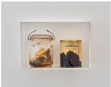
Joseph Beuys ... aus dem Maschinenraum , 1977/78 Glas mit Fett, Dose mit Honig Einmachglas: 17 x 11 (Durchmesser) cm, Konservendose: 10 x 10 (Durchmesser) cm