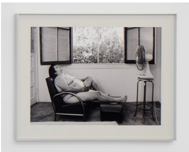
Laura Aguilar In Sandy's Room , 1990 Silbergelatineabzug 48 x 61 cm (gerahmt)